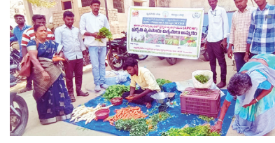
మండల కేంద్రంలో ప్రకృతి వ్యవసాయ ఉత్పత్తుల స్ట్రాల్

-ప్రకృతి వ్యవసాయ ఉత్పత్తుల వాడకం పై ప్రతేక స్ట్రాల్