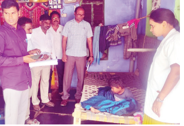
పింఛన్నాలకు వైద్య పరీక్షలు నిర్వహిస్తున్న డాక్టర్లు

మిడుతూరు మేజర్ న్యూస్ : మండల కేంద్రంలో నకిలీ వికలాంగు ధ్రువపత్రాలతో అక్రమంగా పింఛన్న పొందుతున్న వారిని గుర్తించేందుకు ప్రత్యేక వైద్య నిర్ధారణ పరీక్షలు నిర్వహించారు. ఈ పరీక్షలు వచ్చే నకిలీ పెన్షన్లు కొనసాగిస్తున్న నేపథ్యంలో కొత్తవారికి వైకల్య ధ్రువపత్రాలజారీని ప్రభుత్వం తాత్కాలికంగా నిలిపివేసింది. వైకల్య సర్టిఫికేట్ల జారీలో అక్రమాలకు పాల్పడిన వైద్యులనుగుర్తించి, వారిపై చర్యలు తీసుకునేందుకు కూడా ప్రభుత్వం అనర్హులు గుర్తించి వికలాంగ పింఛన్న పై చర్యలు తీసుకుంటున్నారని, అన్నారు పలు ప్రాంతాల నుంచి అనేక ఫిర్యాదులు అందాయని. ఆరోగ్య, వికలాంగుల పెన్షన్లను డాక్టర్ల బృందంతో మిడుతూరు మండల కేంద్రంలోని 15 వేల రూపాయల పెన్షన్దారులను వైద్య పరీక్షలు నిర్వహించారు. వారి నివేదికలను అధికారులకు పంపించినట్లు ఎంపిడిఓ తెలిపారు సోమవారం నాడు దాదాపుగా 43 పెన్షన్లను వైద్య పరీక్షలు నిర్వహించినట్లు తెలిపారు ఈ కార్యక్రమంలో డాక్టర్ల బృందము ఈఓఆర్ డి.సంజన్లు పంచాయతీ కార్యదర్శి గోవిందు తదితరులు పాల్గొన్నారు.