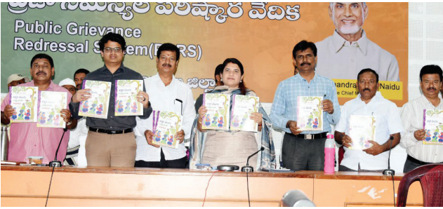
వయోజన విద్య పుస్తకాలు ఆవిష్కరిస్తున్న కలెక్టర్, జాయింట్ కలెక్టర్, అధికారులు

- పుస్తకాలు ఆవిష్కరించిన జిల్లా కలెక్టర్ రాజకుమారి