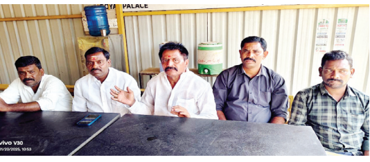
చాగలమర్రి, మేజర్ న్యూస్ : మూడు రోజుల క్రితం ఆంధ్రప్రదేశ్ పర్యటనకు