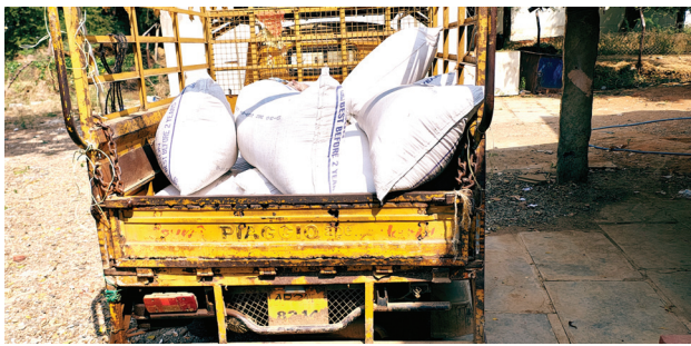
పోలీసులు స్వాధీనం చేసుకున్న రేషన్ బియ్యం