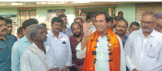
సబ్ రిజిస్ట్రార్ కార్యాలయంలో అధికారులతో మాట్లాడుతున్న ఎమ్మెల్యే

- ప్రజాశక్తిలో రాష్ట్రం ఆదోని వైపు చూడాలి - లంఛం అడిగితే ఫిర్యాదు చేయాలి- ఎమ్మెల్యే డాక్టర్ పార్థసారధి