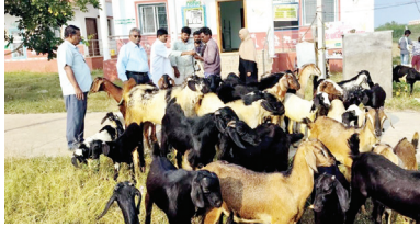
మేకలకు నట్టల నివారణ మందు తావుతున్న ది