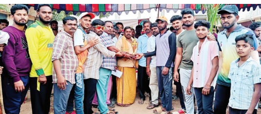
జిల్లా స్థాయి క్రికెట్ టోర్నమెంట్లో విన్నర్ గా గోరంట్ల

వెల్దుర్తి గట్టి లెవెన్ రన్నర్ గా నిలిచింది..