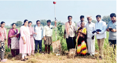
వెల్దుర్తి, మేజర్ న్యూస్: మండలంలో 18