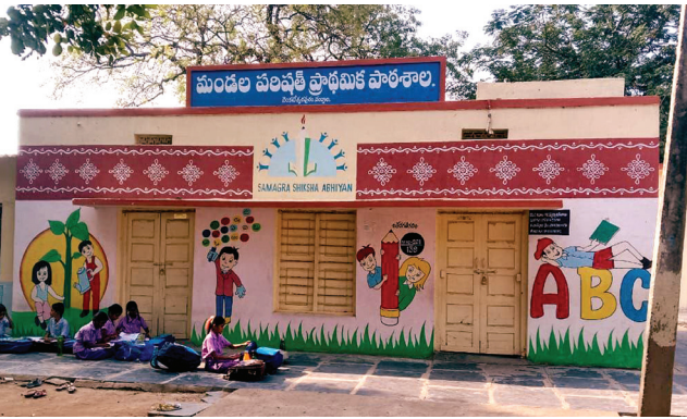
సమయానికి తెరుచుకోని పాఠశాల గదులు