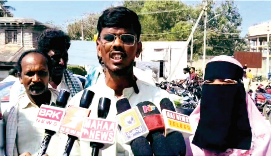
మాట్లాడుతున్న ఎన్ఎఫ్ఐ నాయకులు