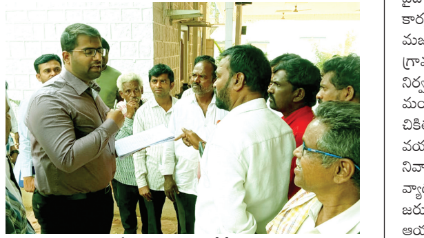
సబ్ కలెక్టర్ తో మాట్లాడుతున్న సీపీఎం నాయకులు