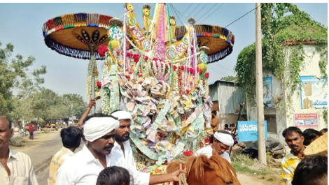
ఉరేగింపు నిర్వహిస్తున్న దృశ్యం