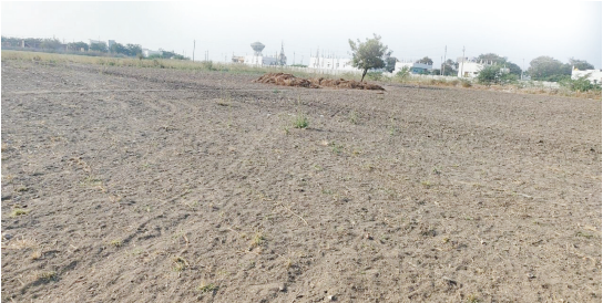
కర్ణాటక గురైన భూమి