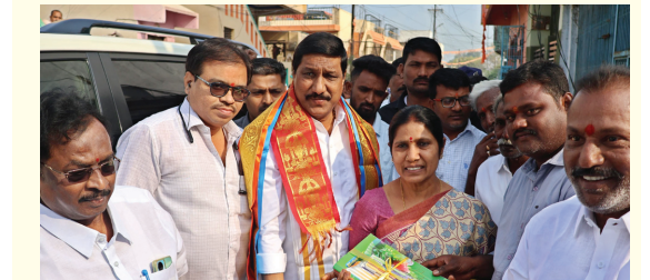
బనగానపల్లెమేజర్, న్యూస్: రాష్ట్ర రోడ్డు భవనాల శాఖా మంత్రి బి.సి జనార్ధన్ రెడ్డి దంపతులను బనగానపల్లె ఆర్యవైశ్య ప్రముఖులు నోట్ పుస్తకాలతో మర్యాదపూర్వకంగా కలిసి నూతన సంవత్సర శుభాకాంక్షలను తెలియజేశారు. పూలదండలు, బొకేలను తీసుకురావడన్న సూచనల మేరకు నోట్ పుస్తకాలతో వారిని కలిశారు. అలాగే ఆదాని సిమెంట్ సంస్థ ప్రతినిధులు పంచాయతీరాజ్ శాఖ ఈ.ఈ , డి.ఈ , ఎ.ఈ.ఎస్ తదితర ఉన్నతాధికారులు మంత్రి బి.సిని కలిసి నూతన సంవత్సర శుభాకాంక్షలను తెలియజేశారు.