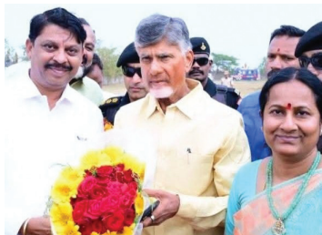
చంద్రబాబుతో వైకుంఠం దంపతులు

దేవనకొండ, మేజర్ న్యూస్ : అంగళ్లో అన్నీ ఉన్నా అల్లుడి నోట్లో శని దాపురించింది అన్న చందంగా ఉంది మన ఆలూరు పరిస్థితి. టిడిపి అధికారంలో ఉన్నప్పటికీ ఆలూరు నియోజక వర్గంలో సీనియర్ టిడిపి నాయకుల మధ్య సై అంటే సై అంటూ ఇటు ప్రస్తుత ఇన్చార్జ్ వీరభద్ర గౌడ అటు వైకుంఠం దంపతులు తమ వర్గాలతో బలాలు నిరూపించుకుంటున్నారు. ఇందులో భాగంగా నూతన సంవత్సర వేడకల్ని ఇద్దరు వేర్వేరుగా ఏర్పాటు చేసుకొని తన బలమెంతో పార్టీ పెద్దలకు తెలియజేయాలని భావించాడో ఏమో కానీ వీరి ప్రవర్తనలతో నియోజకవర్గంలోని నాయకులు, కార్యకర్తలు తీవ్ర ఇబ్బందులకు గురవుతున్నారు. వైకాపా ప్రభుత్వంలో గత ఐదేళ్లుగా ప్రతిపక్షంలో ఉండి తీవ్ర ఇబ్బందులను ఎదుర్కొని పార్టీ కోసం, నియోజకవర్గ నాయకుల కోసం పని చేసిన తెలుగుతమ్ముళ్ళకు పార్టీ అధికారంలోకి వచ్చినా ప్రయోజనం లేదని పలువురు ఆవేధనను వ్యక్తం చేస్తున్నారు. రాష్ట్ర వ్యాప్తంగా టిడిపి భారీ ఆధిక్యంతో విజయం సాధించినప్పటికీ ఎన్నికల సమయంలో ఎమ్మెల్యే అభ్యర్థిని మార్పు చేయడంతోపాటు ఎన్నికల సమయ