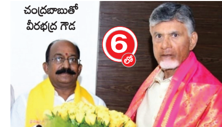
చంద్రబాబుతో వీరభద్ర గౌడ