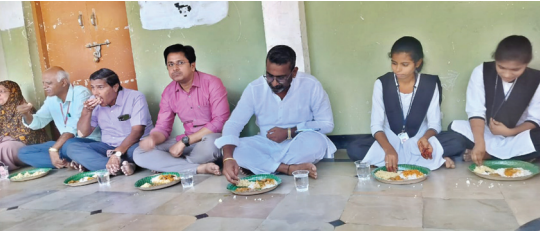
విద్యార్థులతో కలిసి భోజనం చేస్తున్న ఎమ్మెల్యే, ఆర్డీవో