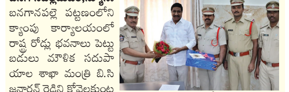
బనగానపల్లెమేజర్, న్యూస్: బనగానపల్లె పట్టణంలోని క్యాంపు కార్యాలయంలో రాష్ట్ర రోడ్డు భవనాలు పెట్టు బడులు మౌళిక సదుపాయాల శాఖా మంత్రి బి.సి జనార్ధన్ రెడ్డిని కోవెలకుంట్ల సి.ఐ, ఎన్.ఐలు సంతోషం

పుష్పగుచ్చం అందజేస్తున్న దృశ్యం ఎన్.ఐ మర్యాదపూర్వకంగా కలిసి పుష్పగుచ్చం అందజేసి నూతన సంవత్సర శుభాకాంక్షలను తెలిపారు.