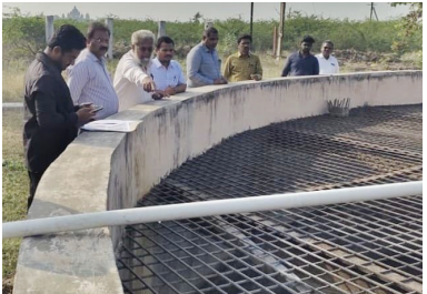
పరిశీలిస్తున్న కమిషనర్ ఎస్. రవీంద్రబాబు

కర్నూలు నగరం, మేజర్ న్యూస్: నగర ప్రజలకు రానున్న వేసవిలో తాగునీటి సమస్య తలెత్తకుండా ముందస్తుగానే పకడ్బందీ చర్యలు తీసుకోవాలని నగర పాలక కమిషనర్ ఎస్. రవీంద్రబాబు అధికారులను ఆదేశించారు. శనివారం ముంగలపాడులోని తాగునీటి సరఫరా (పంపింగ్ స్టేషన్) కేంద్రాన్ని కమిషనర్ పరిశీలించారు. వేసవి కాలంలో తాగునీటి