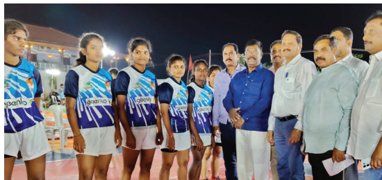
పోటీలను ప్రారంభిస్తున్న దృశ్యం

- మాజీ మంత్రి కేఈ ప్రభాకర్, రాష్ట్ర ఒలంపిక్స్ సంఘం అధ్యక్షుడు పురుషోత్తం