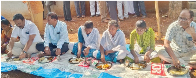
పిల్లలతో కలిసి భోజనం చేస్తున్న ఎమ్మెల్యే కాతా