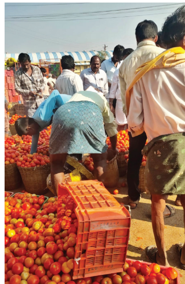
మార్కెట్లో కొనుగోలు చేస్తున్న మార్కెట్ యార్డ్ సిబ్బంది

పత్తికొండ టౌన్ మేజర్ న్యూస్ : స్థానిక వ్యవసాయ మార్కెట్లో టమోటా ధర నిలకడగా ఉన్నట్లు రైతులు తెలిపారు నియోజకవర్గ కేంద్రమైన వ్యవసాయ మార్కెట్ కమిటీ కు మద్దీకేర తుగ్గలి పత్తికొండ ఆస్పరి దేవనకొండ తదితర ప్రాంతాల నుండి పండించిన టమోటా అమ్మకానికి మార్కెట్ కు తీసుకువస్తుంటారు శనివారం మార్కెట్లో టమోటా ధర నిలకడగా ఉందని రైతులు తెలిపారు మార్కెట్ వేలంలో 25 కేజీలు బాక్స్ ధర 400 రూపాయలు నుండి 450 రూపాయల వరకు ధర పలికిందని రైతులు తెలిపారు గత సంవత్సరంలో కంటే ఈ ఏడాదిలో పంటదిగుబడి వచ్చిందని, రాబడి పెరిగిందన్నారు ఈ సంవత్సరం మార్కెట్లో ధరలు స్థిరత్వంగా ఉన్నాయని తెలిపారు మార్కెట్లో వేలంపాటలో, వ్యాపారులు, మార్కెట్ యార్డ్ సిబ్బంది టమోటా సరుకును కొనుగోలు చేశారు