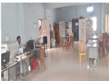
చాగలమలలోని ఉపాధిహామి కార్యాలయంలో ఒక్కరు మాత్రమే హాజరైన దృశ్యం

పోవడంతో ఖాళీ కుర్చీలు దర్శనమిస్తున్నాయి. ప్రతి కార్యాలయంలో ఒకరు ఇద్దరు తప్ప ఉద్యోగులందరూ హాజరుకాని పరిస్థితి ఏర్పడింది. దీనికి కారణం ఉన్నత అధికారుల పర్యవేక్షణ లోపం, ఉద్యోగుల విధి నిర్వహణలో నిర్లక్ష్యం వెరసి ఆవసరాల నిమిత్తం కార్యాలయాల వద్దకు పని మీద వచ్చిన ప్రజలు ఇబ్బందులకు గురౌతున్నారు. ఇప్పటికైన ఉన్నత అధికారులు పర్యవేక్షించి అధికారులు సిబ్బంది సమయ పాలన పాటించేలా చర్యలు చేపట్టాలని మండల ప్రజలు కోరుతున్నారు.మండల