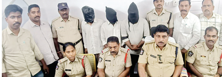
వివరాలు వెల్లడిస్తున్న పోలీసులు

- ముగ్గురిని అదుపులోకి తీసుకున్న పోలీసులు