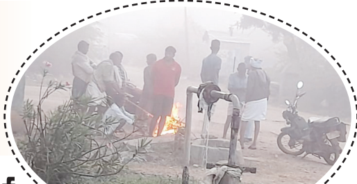
పాగ మంచు అధికంగా కురుస్తుండటంతో చలిమంట వేసుకుంటున్న రైతన్నలు