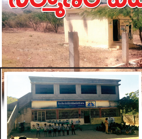
మెట్టుపల్లి గ్రామంలోని మండల పరిషత్ ప్రాథమిక పాఠశాల

వ్యాపిలి, మేజర్ న్యూస్: ప్రభుత్వ పాఠశాలలకు సంబంధించి పాఠశాల చుట్టూ ప్రహారీ గోడలను నిర్మించి, విద్యార్థులను విష సర్పాల నుండి రక్షించడం జరుగుతుంది. అలాగే పాఠశాలలో అసాంఘిక కార్యకలాపాలు చోటుచేసుకోకుండా ఉండేందుకు ప్రహారీ గోడ అడ్డంగా ఉంటుంది. అయితే మండల పరిధిలోని మెట్టుపల్లి గ్రామంలోని మండల పరిషత్ ప్రాథమిక పాఠశాలకు చుట్టూ ప్రహారీ గోడను నిర్మించేందుకు సదరు కాంట్రాక్టర్లు పునాది వేసి, పిల్లర్లు వేశారే గాని, పాఠశాల వెనకభాగాన మాత్రం ప్రహారీ గోడను నిర్మించకుండా వదిలేయడంతో పాఠశాల ప్రాంగణంలోకి విషసర్పాలు వస్తున్నాయి. వాటితో పాటు అకతాయిలు సైతం మద్యం సేవించడానికి, తదితర అసాంఘిక కార్యకలాపాలకు పాఠశాల అడ్డగా మారిపోయింది. దీంతో ఉదయం పాఠశాలకు వచ్చే విద్యార్థులు, ఉపాధ్యాయులు తీవ్ర ఇబ్బందులు పడుతున్నారు. కొందరు అకతాయిలు మద్యం సేవించి, మద్యం సీసాలను అక్కడే వేయడంతో ఉదయం పాఠశాలకు వచ్చిన విద్యార్థులు వాటిని తొలగించడం విచారకరం. కావున ప్రభుత్వ పాఠశాలకు వెనుకభాగాన అసంపూర్ణ గోడను నిర్మించి వదిలేసిన చోటు నుండి తిరిగి ప్రహారీ గోడను నిర్మించి పనులను సంపూర్ణం చేయాలని గ్రామప్రజలు, విద్యార్థుల తల్లిదండ్రులు కోరుకుంటున్నారు.