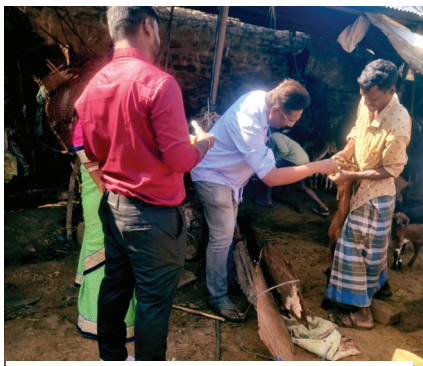
పశువులకు వైద్య పరీక్షలు చేసి, మందులు వేస్తున్న వెటర్నరీ వైద్యులు

కూడా పశువులకు సరైన వైద్యం అందించడంలో కూడా సిబ్బంది పూర్తి నిర్లక్ష్యంగా వ్యవహరిస్తూ, విధుల దుర్వినియోగం చేస్తున్నారంటూ ప్రజలు మండిపడుతున్నారు. కావున జిల్లా పశువైద్యాధికారులు సైతం కాస్త దృష్టి సారించి పశువులకు సరైన సమయంలో వైద్యం అందేలా చర్యలు తీసుకోవాలని పశువుల యజమానులు, ప్రజలు కోరుతున్నారు.