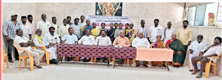
విలేకరుల సమావేశంలో మాట్లాడుతున్న రైతులు న్యాయవాదులు

కర్నూలు, మేజర్ న్యూస్ బ్యూరో : కర్నూలు నగరానికి సమీపంలోని పంచలింగాల, ఇ.తాండ్రపాడు వద్ద కేంద్ర రైల్వే శాఖ నిర్మించ తలపెట్టిన రైల్వే కోచ్ రిహాబిలిటేషన్ వర్క్ షాప్ కు అవసరమైన స్థలాన్ని రైతులకు రాష్ట్ర ప్రభుత్వం మొండిచేయి చూపిస్తోంది. ఎకరా 2 కోట్ల రూపాయల విలువ చేసే 119.88 ఎకరాల భూమిని రైతుల నుండి తీసుకున్న రాష్ట్ర ప్రభుత్వం ఎకరాకు 6,17,