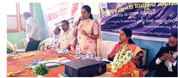
సమావేశంలో మాట్లాడుతున్న ఆదోని జడ్జి