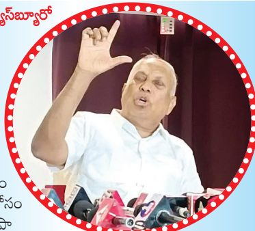
మాట్లాడుతున్న కేంద్ర మాజీ మంత్రి చింతా మోహన్ మిగతా 2లో

కర్నూలు, మేజర్ న్యూస్ బ్యూరో : ఎస్సీ వర్గీకరణ అంశాన్ని తాను తీవ్రంగా వ్యతిరేకిస్తున్నానని కేంద్ర మాజీ మంత్రి, కాంగ్రెస్ పార్టీ నాయకుడు చింతామోహన్ స్పష్టం చేశారు. వర్గీకరణ కోసం ఆంధ్రప్రదేశ్ లో తెదేపా ప్రభుత్వం మిశ్రా కమిటీని ఏర్పాటు చేయడాన్ని అంగీకరించమని ఆయన చెప్పారు.