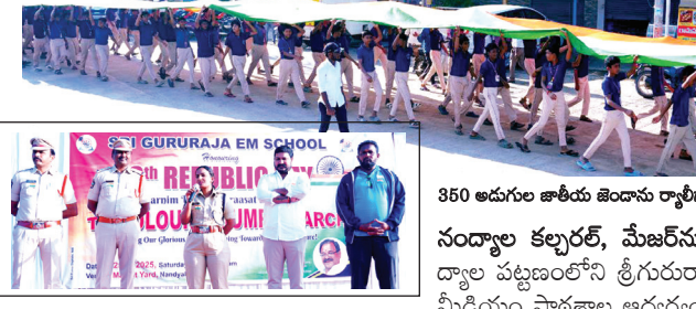
350 అడుగుల జాతీయ జెండాను ర్యాలీగా వెళ్తున్న దృశ్యం