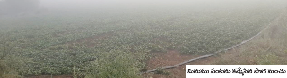
మనుము పంటను కమ్మేసిన పాగ మంచు