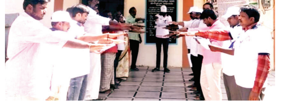
ప్రతిజ్ఞ చేస్తున్న రెవెన్యూ సిబ్బంది