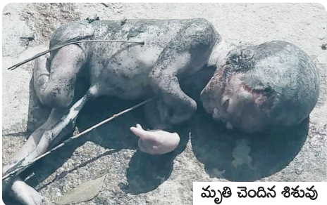
మృతి చెందిన శిశువు