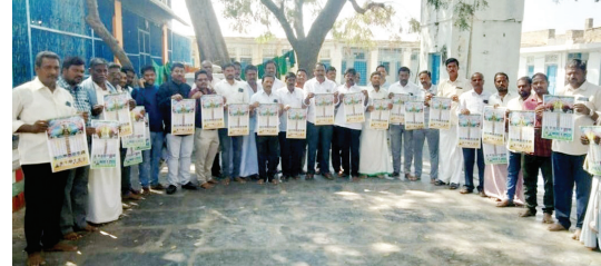
క్యాలండర్ ఆవిష్కరిస్తున్న యాదవ సంఘం నాయకులు