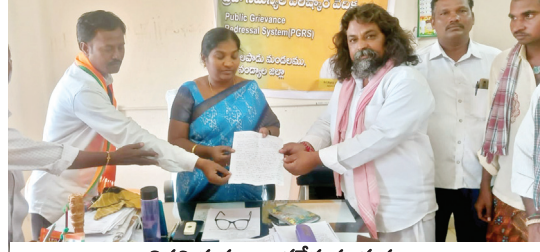
వినతి పత్రం అందజేస్తున్న దృశ్యం