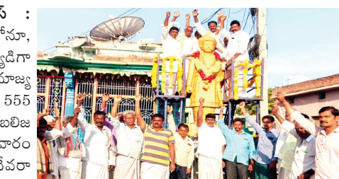
దేవరాయల విగ్రహానికి పూలమాలలు వేస్తున్న దృశ్యం

ఉయ్యాలవాడ, మేజర్ న్యూస్ : ఆంధ్రప్రదేశ్ జ్యోతి, సాహిత్యంలోనూ, సమరంలోనూ సార్వభౌమ్యుడిగా పేరుపొందిన విజయనగర సామ్రాజ్య అధినేత శ్రీకృష్ణ దేవరాయల 555 జయంతిని మండల కేంద్రంలో బలిజ సంఘం ఆధ్వర్యంలో సోమవారం ఘనంగా నిర్వహించారు. దేవరాయల విగ్రహానికి పాలతో అభిషేకం చేసి పూలమాలలతో అలంకరించి