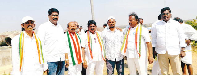
రిజర్వాయర్లను పరిశీలిస్తున్న కాంగ్రెస్ నాయకులు