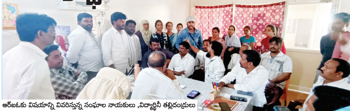
ఆర్.ఐ.ఎస్.కు విషయాన్ని వివరిస్తున్న సంఘాల నాయకులు, విద్యార్థిని తల్లిదండ్రులు