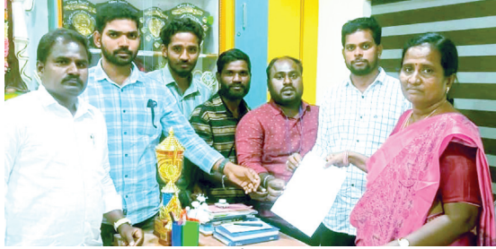
విద్యార్థికారికి వినిపిత్రం అందజేస్తున్న విద్యార్థినంఘాల నాయకులు

మౌంట్ కార్మైల్ పాఠశాలపై చర్యలు తీసుకోండి: కోసిగి మండలంలోని మౌంట్ కార్మైల్ పాఠశాలలో గణతంత్రదినోత్సవాన్ని నిర్వహించామని జరిపిన పాఠశాలపై చట్టపరమైన చర్యలు తీసుకోవాలని