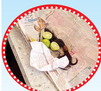
విద్యార్థిని జుట్టు కట్ చేసి నిమ్మకాయలతో కలిపి ఉంచిన దృశ్యం

కర్నూలు క్రైం, మేజర్ న్యూస్ : విద్యార్థిని పై క్షుద్ర పూజలు చేసి హత్యాయత్నం జరిగిన సంఘటన ఆదివారం రాత్రి నగరంలో శివారులో చోటు చేసుకుంది. వివరాల్లోకి వెళ్తే.. కర్నూలు నగర శివారులోని బి. తాండ్రపాడు సమీపంలో ఉన్న ఎస్.ఆర్ జూనియర్ కళాశాల నందు బైపిసి మొదటి సంవత్సరం చదువుతున్న శ్రీశైలం నియో జకవర్గంలోని మిగతా 2లో |