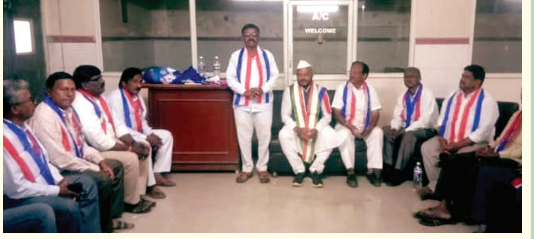
సమావేశంలో మాట్లాడుతున్న బీసీ ఫెడరేషన్ రాష్ట్ర ఉపాధ్యక్షుడు

ఆదోని మార్కెట్ యార్డు కమిటీ చైర్మన్ పదవి బీసీ మైనార్టీ నాయకులకు కేటాయించాలి - బీసీ ఫెడరేషన్ రాష్ట్ర ఉపాధ్యక్షుడు