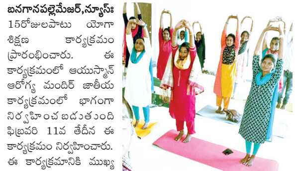
యోగా శిక్షణను ఇస్తున్న దృశ్యం

బనగానపల్లె బేతంచెర్ల మండలాలకు చెందిన కమ్యూనిటీ హెల్త్ అఫీసర్లకు డాక్టర్ వీరం మురళీధర్ రెడ్డి శిక్షణను ఇవ్వనున్నారు. 15రోజుల్లో యోగా యొక్క ప్రాముఖ్యత ఇంటర్వేషనల్ యోగా డే యొక్క విశిష్టత యోగాసనాలు, ఉపయోగాలు ఆధునిక యుగంలో యోగా వలన దీర్ఘకాలికమైనటువంటి వ్యాధులను నిర్మూలించడానికి యోగా ఎంతో ఉపయోగపడుతుందని గ్రామాలలో ఉన్నటువంటి పేదల దగ్గరకు వెళ్లి కమ్యూనిటీ హెల్త్ అఫీసర్లు వారి సేవలను కొనసాగిస్తారని అదే విధంగా యోగా వలన వివిధ రకాలైనటువంటి వ్యాధులు రాకుండా యోగా రోగనిరోధక శక్తిని పెంచుకోవచ్చన్నారు. డాక్టర్ సుజాత మాట్లాడుతూ స్వతహాగా తాము యోగా చేస్తున్నామని తాను బరువు కూడా తగ్గనని ఏ ఆహారం తీసుకోవడం వల్ల ఆరోగ్యానికి చాలా ఉపయోగం అనే విషయాలు ప్రజల దగ్గరకు చేరవేయాలని తెలిపారు.