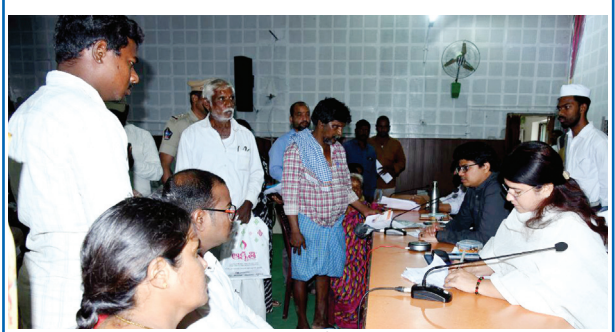
ప్రజలు ఇచ్చిన ఫిర్యాదులను పరిశీలిస్తున్న కలెక్టర్ రాజకుమారి

నంద్యాల కల్చరల్, మేజర్ న్యూస్ : ప్రజా సమస్యలను క్షేత్రస్థాయిలో పరిశీలించి నాణ్యతతో వేగంగా పరిష్కరించాలని జిల్లా కలెక్టర్ రాజకుమారి అధికారులను ఆదేశించారు. సోమవారం కలెక్టరేట్ లోని పిజిఆర్.ఎస్ హాలులో జిల్లా నలుమూలల మూలల మిగతా 2లో |