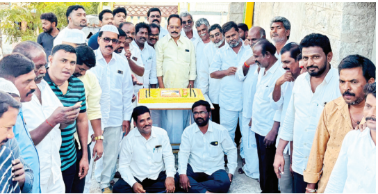
కేక్ కట్ చేస్తున్న టీడీపీ నాయకులు

యువకళానికి రెండేళ్లు పూర్తి పట్ల కేక్ కట్ చేసిన టీడీపీ శ్రేణులు