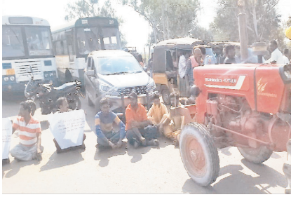
రాస్టా రోకో నిర్వహిస్తున్న ప్రజలు

జూపాడుబండ్ల, మేజర్ న్యూస్ : జాతీయ రహదారి 34ని అధికారుల నిర్లక్ష్యంతో జూపాడుబండ్ల మండల పరిధిలోని పారుమంచాల క్రాస్ రోడ్డు నుంచి వెళ్లే ఏడు గ్రామాల ప్రజలు ఇబ్బందులు పడుతున్నారు. దీనికి కారణం పారుమంచాల క్రాస్ రోడ్డు వద్ద యూ టర్న్ ను నేషనల్ హైవే అధికారులు ఏర్పాటు చేయకపోవడమేనని పారుమంచాల, తూడిచెర్ల, వాడాల, మధూరు, తదితర గ్రామాల ప్రజలు ఆవేదన వ్యక్తం చేశారు. ఈ విషయంపై జిల్లా కలెక్టర్ కు స్పందన కార్యక్రమంలో వినతిపత్రం అందించారు. యూ టర్న్ లేకపోతే రాకపోకలకు ఇబ్బంది కలుగుతుందని కలెక్టర్ కు విన్నవించారు.