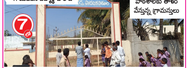
ముద్దటిమార్గి ఆదర్శ పాఠశాలకు తాళం వేస్తున్న గ్రామస్థులు