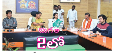
సమావేశం నిర్వహిస్తున్న దృశ్యం