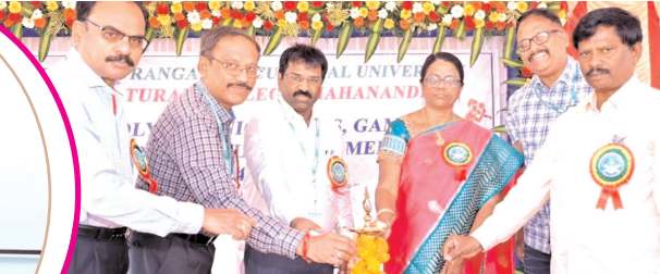
మహానంది వ్యవసాయ కళాశాలలో జ్యోతి ప్రజ్వలన చేస్తున్న అధికారులు

బెలూన్లను ఎగుర వేశారు. విద్యార్థులు జెండాలు పట్టుకొని మార్చిపాస్ నిర్వహించారు. అనంతరం వక్రలు మాట్లాడుతూ క్రీడలు శారీరక, మానసిక ఉల్లాసానికి ఎంతో ఉపయోగపడతాయని, ప్రతి ఒక్క విద్యార్థి క్రీడా స్ఫూర్తితో పోటీలలో పాల్గొని విజయాలను సాధించి కళాశాలకు గుర్తింపు తీసుకు రావాలని పేర్కొన్నారు. విద్యార్థుల్లో మానసిక ఉల్లాసాన్ని పెంపొందించేందుకు ఈ క్రీడలు ఎంతో ఉపయోగపడతాయని అన్నారు. వ్యక్తిత్వం, నాయకత్వ లక్షణాలు పెంపొందించడంలో క్రీడలు ఎంతో దోహదం చేస్తామని అన్నారు. ఈ క్రీడలలో రాష్ట్రంలోని 20 పాలిటెక్నిక్ కళాశాల విద్యార్థులు పోటీ పడుతున్నారని అన్నారు. సాయంత్రం విద్యార్థులకు సాంస్కృతిక కార్యక్రమాలు నిర్వహించారు. ఈ కార్యక్రమంలో బోధన, బోధనేతర సిబ్బంది పాల్గొన్నారు.