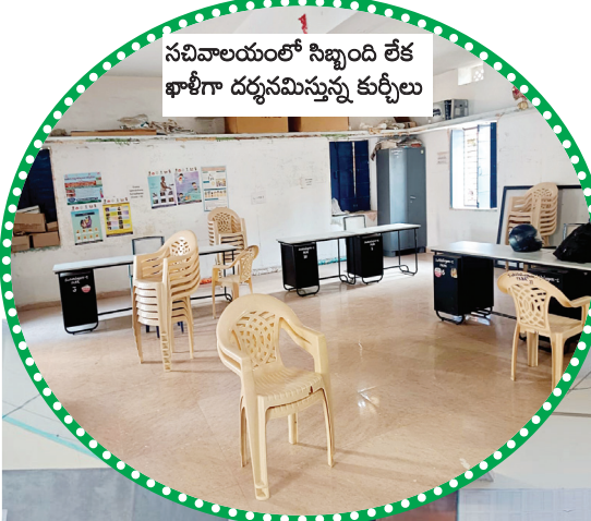
సచివాలయంలో సిబ్బంది లేక ఖాళీగా దర్శనమిస్తున్న కుర్చీలు