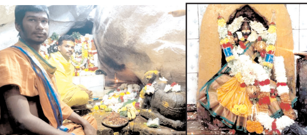
స్వామి వారికి పూజలు చేస్తున్న అలయ అర్చకుడు మాశమ్మ అమ్మవారు