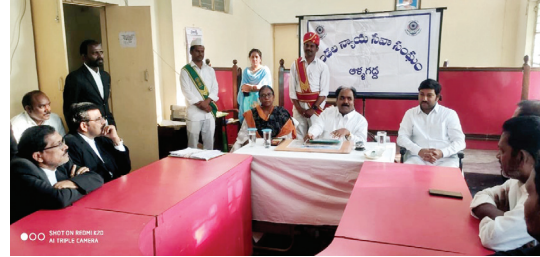
మాట్లాడుతున్న బుధవారం అదనపు జిల్లా జడ్జి