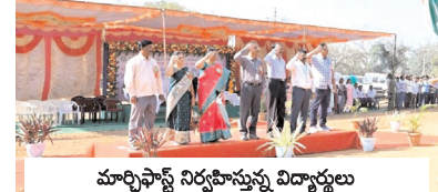
మార్చిపాస్ నిర్వహిస్తున్న విద్యార్థులు

బెలూన్లను ఎగుర వేశారు. విద్యార్థులు జెండాలు పట్టుకొని మార్చిపాస్ నిర్వహించారు. అనంతరం వక్రలు మాట్లాడుతూ క్రీడలు శారీరక, మానసిక ఉల్లాసానికి ఎంతో ఉపయోగపడతాయని, ప్రతి ఒక్క విద్యార్థి క్రీడా స్ఫూర్తితో పోటీలలో పాల్గొని విజయాలను సాధించి కళాశాలకు గుర్తింపు తీసుకు రావాలని పేర్కొన్నారు. విద్యార్థుల్లో మానసిక ఉల్లాసాన్ని పెంపొందించేందుకు ఈ క్రీడలు ఎంతో ఉపయోగపడతాయని అన్నారు. వ్యక్తిత్వం, నాయకత్వ లక్షణాలు పెంపొందించడంలో క్రీడలు ఎంతో దోహదం చేస్తామని అన్నారు. ఈ క్రీడలలో రాష్ట్రంలోని 20 పాలిటెక్నిక్ కళాశాల విద్యార్థులు పోటీ పడుతున్నారని అన్నారు. సాయంత్రం విద్యార్థులకు సాంస్కృతిక కార్యక్రమాలు నిర్వహించారు. ఈ కార్యక్రమంలో బోధన, బోధనేతర సిబ్బంది పాల్గొన్నారు.