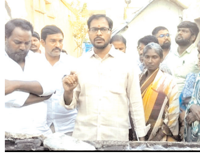
మాట్లాడుతున్న బిజెపి జిల్లా అధికార ప్రతినిధి