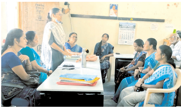
అవగాహన సదస్సులో మాట్లాడుతున్న మహిళా వెల్ఫేర్ సెక్రటరీ