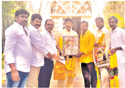
బాలకృష్ణకు స్వామివారి చిత్రపటాన్ని అందజేస్తున్న అభిమానులు