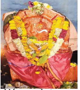
శ్రీశ్రీశ్రీ బాల ఆంజనేయస్వామి వారు సందర్భంగా వారు మాట్లాడుతూ శ్రీగణపతి పూజ, పుణ్యాహ

వెల్లిగ్రామ పెద్దలు, ప్రజలు, భక్తులు వెల్లిగ్రామంలో, మేజర్ న్యూస్: స్వస్తి శ్రీ క్రోధి నామ సంవత్సరం మాఘ శుద్ధ విదియలు 31-1-2025 గుక్రవారం ఉదయం 8:30 గంటలకు శ్రీశ్రీశ్రీ బాల ఆంజనేయస్వామి ఆలయ జీర్ణోద్ధారణ పూర్వక నూతన దేవాలయ పునఃప్రారంభోత్సవ కార్యక్రమాలు ప్రారంభం కాబోతున్నట్లు గ్రామ పెద్దలు బుధవారం ఒక ప్రకటనలో పేర్కొన్నారు. ఈ