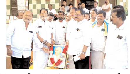
మహాత్మాగాంధీ చిత్రపటానికి నివాళులర్పిస్తున్న ఎమ్మెల్యే

వంత్రి నారాలోకేష్ అవేళ పూరిత మాటలతో రెచ్చగొట్టే రెడ్ బుక్ అంటూ యువతను పెడదోష పెట్టారని గుర్తు చేశారు. పింఛన్ కోసమే దాదాపు 1.19లక్షలకోట్లు అప్పులు తీసుకురావడం జరిగిందన్నారు. పెన్షన్ల పెంపు అంటే సర్టిఫికెట్లు వెర్సిఫికేషన్ అంటూ పెన్షన్లు తొలగించడం బాబుకే సాధ్యమన్నారు. జగన్మోహన్ రెడ్డి ప్రభుత్వంలో 17 మెడికల్ కాలేజీలను మంజూరు చేస్తే, తన మనుషులకు అమ్ముకోవడమే సంపద సృష్టి సాధ్యమే చేశారు.విద్యుత్ చార్జీలను