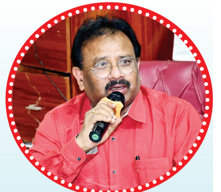
మాట్లాడుతున్న కమిషనర్ రవీంద్ర బాబు