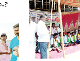
రిలే నిరాహార దీక్షలు చేపట్టిన వారికి నచ్చ చెబుతున్న ఎస్పై సురేష్ బాబు

రైతులతో మాట్లాడుతున్న పిడి పద్దు పాములపాడు, మేజర్ న్యూస్ : పాములపాడు చెలిమిల్లగ్రామాల మధ్యన వెళుతున్న జాతీయ రహదారి 340 ని వెళ్తుంది అయితే అక్కడ నిర్మిస్తున్న అందర్ పాస్ వంతెన ఎత్తు పెంచాలని లేదా సర్వీస్ రోడ్డు ఏర్పాటు చేయాలని చెలిమిళ్ళు, లింగాల, పాములపాడు రైతులు గురువారం రిలే నిరాహార దీక్షలు చేపట్టి నిరసన కార్యక్రమం