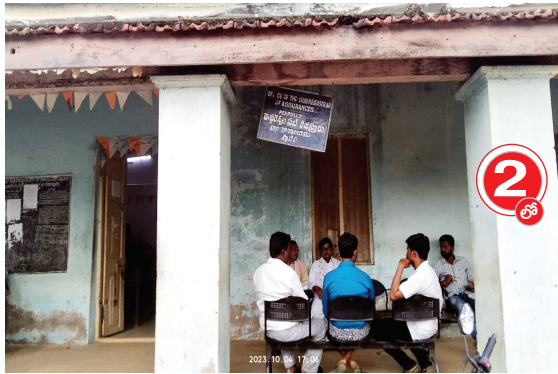
ప్యాపిలి సబ్ రిజిస్ట్రార్ కార్యాలయం