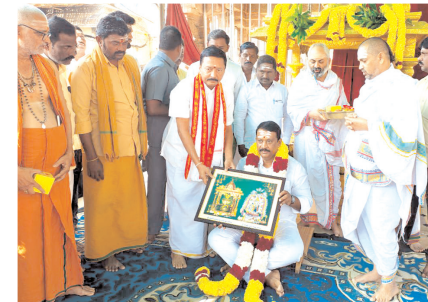
ఎమ్మెల్యే బుడ్డాకు జ్ఞాపికను అందజేస్తున్న అధికారులు