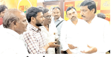
అర్జీలను స్వీకరిస్తున్న దృశ్యం