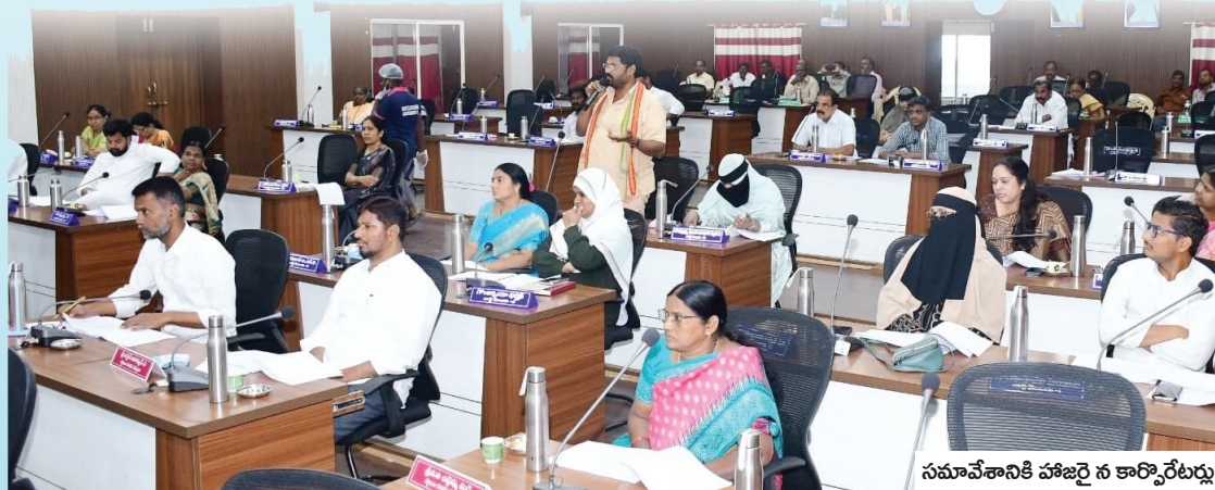
సమావేశానికి హాజరైన కార్పొరేటర్లు

సాధారణ సమావేశం నిర్వహించి, 17 అంశాలపై చర్చించి, ఆమోదం తెలిపారు. రూ. 6.79 కోట్లతో వివిధ అభివృద్ధి పనుల కేటాయింపునకు పచ్చ జెండా ఊపారు. తరువాత కార్పొరేటర్లు లేవనెత్తిన సమస్యలకు కమిషనర్ ఎస్.రవీంద్ర బాబు సమాధానం ఇచ్చారు. కూడళ్ళలో బ్యానర్లు నిషేధిస్తామని, ఏర్పాటు చేసే వారిపై చర్యలు తీసుకుంటామని కమిషనర్ తెలిపారు. మహనీయులను అందరూ గౌరవించాలని, వారి విగ్రహాలు కనబడకుండా ఫైక్సీలు ఏర్పాటు చేయడం సరికాదని అన్నారు. పెగా దానివల్ల ప్రమాదం జరిగే అవకాశం సైతం ఉందన్నారు. మిగతా 2లో