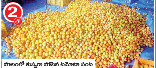
పాలంలో కుప్పగా పోసిన టమోటా పంట