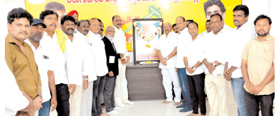
గాంధీ చిత్ర పటానికి నివాలు అర్పిస్తున్న దృశ్యం