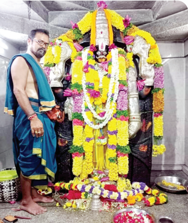
ఆలయంలో కొలువుదీరిన వెంకటేశ్వర స్వామి

చాగలమల, మేజర్ న్యూస్ : చాగలమల మండలంలోని మద్దూరు గ్రామంలో శ్రీ.శ. 450 సంవత్సరాల క్రితం శ్రీకృష్ణ దేవరాయల కాలంలో నిర్మించిన అతి పురాతనమైన, ఉత్తర ముఖ ద్వారంతో, రెండు తెలుగు రాష్ట్రాలలో కూడా ఏక్కడా లేని విధంగా నిర్మించిన పేరు ప్రఖ్యాతులు గాంచిన ప్రాచీన, అత్యంత వైభవం కలిగిన వైష్ణవాలయం