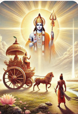
శ్రీ కృష్ణుడు అర్జునుడికి గీతోపదేశం చేస్తున్న దృశ్యం(ఫైల్)