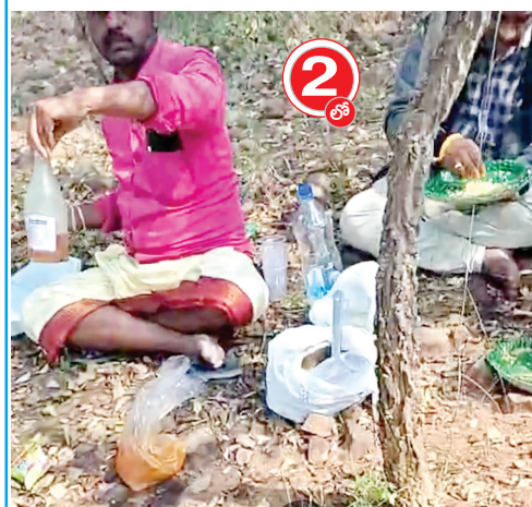
మద్యం మాంసం తింటూ పట్టుబడిన ఆలయ సిబ్బంది

➔ మద్యం మాంసాహారం సేవిస్తూ పట్టుబడిన ఆలయ సిబ్బంది