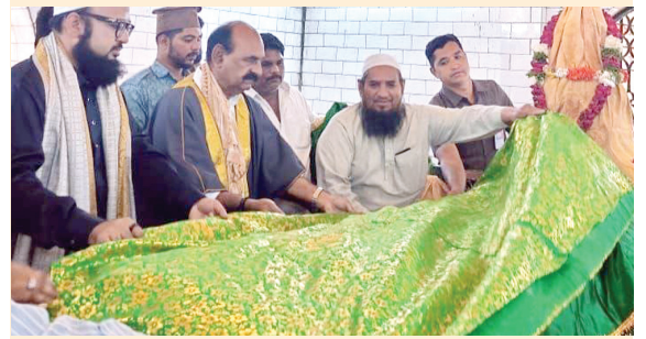
కొండపల్లిలోని హజరత్ సయ్యద్ షా దర్గాసు సందర్శించిన మంత్రి