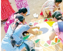
ముగ్గులు వేస్తున్న దృశ్యం

పట్టణ శివార్లలో ఉన్న ఆర్ పంపల్లె రోడ్డులో ఉన్న ఐ జి ఎస్ హైస్కూల్లో సంక్రాంతి ముగ్గుల పోటీలను నిర్వహించారు. ఈ సందర్భంగా పాఠశాల విద్యార్థులు సంక్రాంతి యొక్క సందేశాన్ని తెలుపుతూ రంగురంగుల ముగ్గులు వేయడం వారి ప్రతిభకు నిదర్శనమని ఆళ్లగడ్డ యూనిట్ తరఫున దస్తగిరికి అభినందనలు తెలియజేశారు.