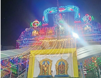
విద్యుత్ కాంతుల్లో ప్రధాన ఆలయం