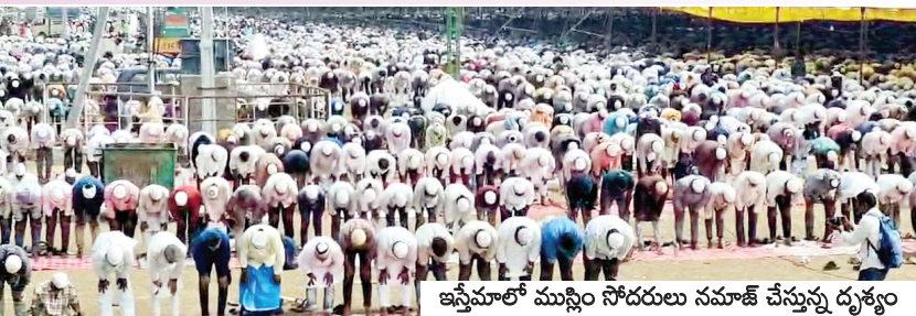
ఇస్మీమాల్లో ముస్లిం సోదరులు నమాజ్ చేస్తున్న దృశ్యం