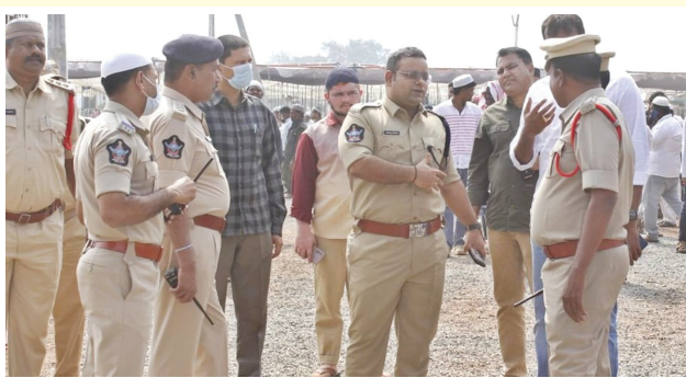
ట్రాఫిక్ అంతరాయం కలగకుండా అధికారులకు సూచనలిస్తున్న జిల్లా ఎస్పీ

అత్యుక్తారు, మేజర్ న్యూస్: అత్యుక్తారు పట్టణంలో అత్యంత భక్తి శ్రద్ధలతో మూడు రోజుల పాటు జరిగిన ఇస్సేమా వేడుకలలో చివరి రోజు ఎస్పీ సందర్శించి భద్రత ఏర్పాట్లను పరిశీలించి ట్రాఫిక్ అంతరాయం కలగకుండా పోలీసులు అధికారులు అప్రమత్తంగా ఉండాలని అన్నారు. గురువారం ఇస్సేమా చివరి రోజు ఇస్సేమా