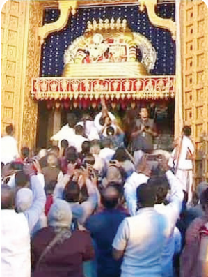
వైకుంఠ ద్వారం వద్ద భక్తులు (ఫైల్)