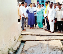
ఆరోగ్యాన్ని దృష్టిలో ఉంచుకొని అధికారులు స్పందించి పైపులను తొలగించి మురుగునీరు నిల్వలేకుండా చూడాలని కోరారు.

ఓర్వకల్లు, మేజర్ స్కూల్స్ : రోడ్డుపై నిలుస్తున్న మురుగునీటిని తొలగించాలని నన్నూరు గ్రామ టిడిపి నాయకులు, ప్రజలు అధికారులను కోరారు. గురువారం మండల పరిధిలోని నన్నూరు గ్రామంలో ని 9వ వార్డులో రోడ్డుపైనే మురుగునీరు నిలుస్తుందని దీంతో దుర్వాసన వెదజల్లుతుందని ప్రజలు త్రాగడానికి వేసిన మంచినీరు పైపు కూడా కాలువ నుంచే వెళ్తుందని ప్రజల