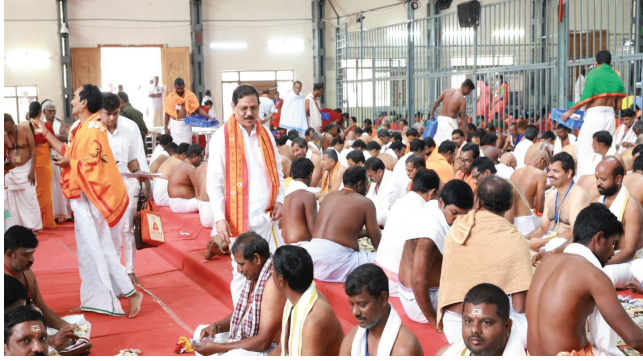
హుండీ ఆదాయం లెక్కిస్తున్న దృశ్యం