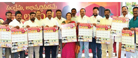
క్యాలెండర్స్ అవిష్కరిస్తున్న దృశ్యం