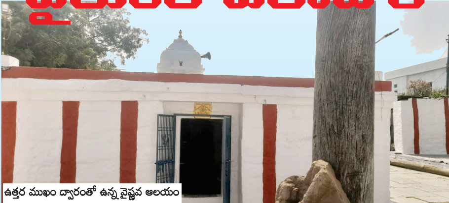
ఉత్తర ముఖం ద్వారంతో ఉన్న వైష్ణవ ఆలయం