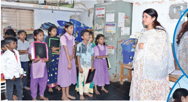
అంగన్వాడీ కేంద్రంలో ఉన్న చిన్నారులతో మాట్లాడుతున్న కలెక్టర్