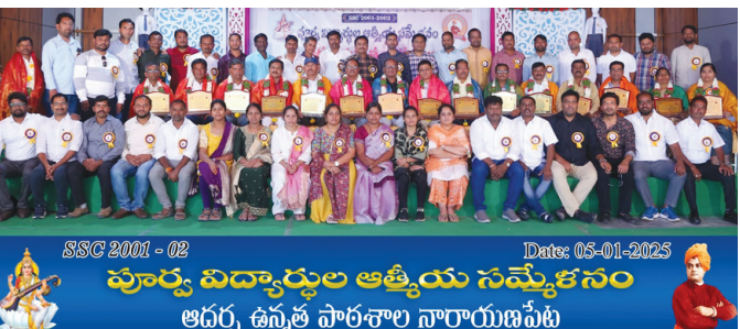
SSC 2001 - 02 పూర్వ విద్యార్థుల ఆత్మీయ సమ్మేళనం ఆదర్శ, ఉన్నత పాఠశాల నారాయణపేట Date: 05-01-2025