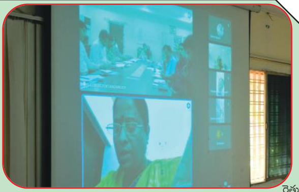
భరోసా, ఇందిరమ్మ ఆత్మీయ భరోసా, నూతన రేషన్ కార్డుల మంజూరు,

సంగారెడ్డి మెజార్ న్యూస్ ప్రతినీధి... ప్రభుత్వం అమలుచేస్తున్న పథకాలు అర్జులైన ప్రతి ఒక్కరికి అందేలా సమర్థవంతంగా కార్యాచరణను అమలు చేయాలని అటవీ, పర్యావరణ, దేవాదాయ ధర్మాదాయ శాఖామాత్యులు, ఉమ్మడి మెదక్ జిల్లా ఇంచార్జి మంత్రి కొండా సురేఖ కలెక్టర్లను ఆదేశించారు. కాంగ్రెస్ ప్రజా ప్రభుత్వం ప్రజా సంక్షేమమే పరమావధిగా ఈ నెల 26 నుంచి అమలు చేయనున్న నూతన పథకాలను నిబద్ధతతో అమలు చేసి, ప్రభుత్వ లక్ష్యాలను నెరవేర్చాలని మంత్రి సురేఖ సూచించారు. రాజ్యాంగం అమలులోకి వచ్చి 26 జనవరి 2025 నాటికి 75 సంవత్సరాలు అవుతున్న నేపథ్యంలో కాంగ్రెస్ ప్రభుత్వం రైతు భరోసా, ఇందిరమ్మ ఆత్మీయ భరోసా, నూతన రేషన్ కార్డుల మంజూరు, ఇందిరమ్మ ఇండ్ల కేటాయింపు పథకాలను ప్రతిష్ఠాత్మకంగా అమలు చేసేందుకు నిర్ణయించింది. ఈ నేపథ్యంలో మంత్రి సురేఖ, సంగారెడ్డి, మెదక్ సిద్దిపేట జిల్లాల కలెక్టర్లు వల్లూరు క్రాంతి, రాహుల్ రాజ్, మిక్కిలినేని మను చౌదరిలతో ఢిల్లీ నుంచి గూగుల్ మీట్ ద్వారా సన్నాహక సమావేశాన్ని నిర్వహించారు.