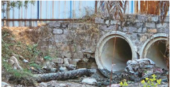
అమీన్ పూర్, మేజర్ న్యూస్ : అమీన్పూర్ మండల పరిధిలోని గండిగూడెం కాల్వనీకి వెళ్లే దారిలో ఉన్న నాలను కట్టా చేసిన వెంచర్ యాజమాన్యులు,

- పూర్తిగా నీటిని డైవర్ట్ చేసిన వెంచర్ యజమాని - నాలపై అక్రమ నిర్మాణాలు -పట్టించుకొని ఇరిగేషన్ అధికారులు నిత్యం బొల్లారం, ఆసానికుంట, గండి చెరువు, కాజిపల్లి,బాచుపల్లి-మల్లంపేట్ -తదితర ప్రాంతాల నుండి నీరు ప్రవహిస్తున్న నాలను వెంచర్ యాజమాన్యులు, సుట్టు -రేకుల పెద్ద -నిర్మించి-నీటిని డైవర్ట్ చేసి మళ్లించారు. నాలకు అవతలపక్క వారి ల్యాండ్ ఉండడంతో నాలా చుట్టూ రేకులు నిర్మించి నాలను కనుమరుగు చేస్తున్న- గానీ- ఇరిగేషన్ అధికారులు మాత్రం ఇటు పక్క కన్నెత్తి చూడని పాపన పోలేరు. తెలంగాణ ప్రభుత్వం నాలు- చెరువు కుంటలు కట్టాలకు గురవుతే తక్షణమే చర్యలు తీసుకుంటున్నారూ. గానీ -గండిగూడెంలో మాత్రం నాలను పూర్తిగా కట్టా చేస్తున్న గాని అధికారులు మాత్రం పట్టించుకోవడం లేదంటూ గ్రామస్థులు ముక్కున వేలేసుకుంటున్నారు. ఇప్పటికైనా తక్షణమే నాల ప్రవాహ తీరును పునరుద్ధరించాలని గ్రామస్థులు కోరారు.