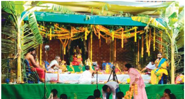
పెద్దశంకరంపేట్ మేజర్ న్యూస్ : పెద్దశంకరంపేట్ పట్టణంలో మకరసంక్రమణ మహోత్సవాన్ని పురస్కరించుకొని సంక్రాంతి పండుగ వేడుకలను ఘనంగా జరుపుకున్నారు.పెద్దశంకరంపేట్లోని టీటీడీ కల్యాణ మండపంలో ఆర్యవైశ్య మహిళా సంఘం ఆధ్వర్యంలో సంక్రాంతి పండుగ సందర్భంగా టీటీడీ కల్యాణ మండపంలో ఆర్యవైశ్య మహిళలు పంచ

-పంచ కల్యాణాలు, బృందావనం, గాజుల బండి నోములు - అంబరాన్నంటిన సంక్రాంతి సంబురాలు