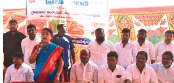
సంక్షేమ పథకాలలో దేశంలోనే తెలంగాణ నెంబర్ వన్ : చైర్మన్ నిర్మల జగ్గారెడ్డి

అందిస్తామని ఈ ప్రక్రియ నిరంతరం కొనసాగుతుందని తెలంగాణ రాష్ట్రంలో అందిస్తున్న సంక్షేమ పథకాలు దేశంలో ఎక్కడ లేవని తెలిపారు. అర్హులు ఎవరు ఇబ్బంది పడవద్దని కార్యక్రమాలు నిరంతరం కొనసాగుతాయని తెలిపారు. ఈ కార్యక్రమంలో గ్రామస్తులు అధికారులు లబ్ధిదారులు దరఖాస్తుదారులు పాల్గొన్నారు.