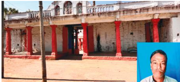
ఎంతో మంది ప్రజలు ఈ దారిలో వెళ్తున్నారు. అయినా కూడా ప్రజల సమస్యలు పట్టవు అన్నట్లుగా స్థానిక ప్రజాప్రతినిధులు గ్రామపంచాయతీ అధికారులు వ్యవహరిస్తున్నారని ప్రజల ఆగ్రహం వ్యక్తం చేస్తున్నారు. ఇదిలా ఉంటే త్వరలో సీతారామచంద్రస్వామి కళ్యాణం ఉత్సవాలు ఘనంగా నిర్వహిస్తారు ఇట్టి సందర్భంగా భక్తుల రాకపోకలు విపరీతంగా తాకిడి ఉంటుంది. అలాగే ఉత్సవ విగ్రహాల ఊరేగింపు తో పాటు పల్లకి సేవ కూడా అంగరంగ వైభవంగా నిర్వహిస్తారు. అటువంటి సమయంలో రోడ్డు ఈ విధంగా ఉంటే అటు భక్తులకు గాని ఇటు కార్యక్రమానికి విచ్చేసే అధికారులకు గాని జరగరాని ప్రమాదం జరిగితే ఎవరు బాధ్యత వహిస్తారు. అని చెప్పి స్థానిక ప్రజలు నిరసిస్తున్న వాయనం నెలకొంది. నర్పంచి లేకపాలన స్పందించింది. ఇకనైనా సమస్యలతో మాకేంది. అనుకోకుండా సంబంధిత శాఖ అధికారులు ప్రజా ప్రతినిధులు స్పందించి సమస్యను పరిష్కరించాలని గ్రామ ప్రజలు కోరుకుంటున్నారు.

కుకునూరుపల్లి, మేజర్ సూర్య: మండల కేంద్రంలో పరిపాలన పడకేసినట్లు కనబడుతుంది. పలు రకాల సమస్యలతో సతమతమవుతున్న ప్రజలకు స్థానిక ప్రజా ప్రతినిధులు గ్రామపంచాయతీ అధికారుల పైన వ్యతిరేకత వ్యక్తం అవుతుంది. గత 8 సంవత్సరాల క్రితం చేసిన రోడ్డు కూడా నాణ్యత లోపం వల్ల కుంగి పోవడం తో నిత్యం రద్దీగా ఉండే దారిలో ప్రజలు అవస్థలు పడుతున్నారు. ఇక మండల కేంద్రంలోని అత్యంత ప్రాచీనమైన