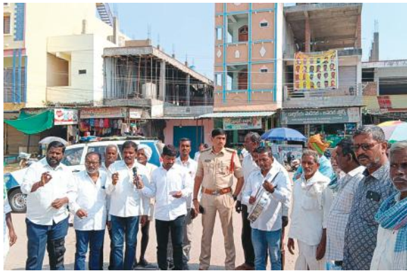
అతివేగము రాంగ్ రూట్లో వాహనాలు నడపవద్దని తెలిపారు. లితెలంగాణ సాంస్కృతిక సారథి బృందం సభ్యులు, రోడ్డు నిబంధనలు ట్రాఫిక్ నిబంధనలు హెల్మెట్, సీట్ బెల్ట్, అధిక వేగము, రాంగ్ సైడ్ డ్రైవింగ్, సెల్ ఫోన్ డ్రైవింగ్, ట్రిబుల్ రైడింగ్, మైనర్ డ్రైవింగ్, తదితర అంశాల గురించి పాటల రూపంలో వాహనదారులకు ప్రజలకు అవగాహన కల్పించారు.

చేర్యాల మేజర్ సూర్య: చేర్యాల మండల కేంద్రంలో జాతీయ రోడ్డు భద్రత మాసోత్సవాల సందర్భంగా చేర్యాల మార్కెట్ చౌరస్తాలో చేర్యాల సీఐ శ్రీమ ఆధ్వర్యంలో తెలంగాణ సాంస్కృతిక సారథి బృందం సభ్యులతో ట్రాఫిక్ నిబంధనలు రోడ్డు నిబంధనల గురించి పాటల ద్వారా అవగాహన కల్పించడం జరిగింది. ఈ సందర్భంగా చేర్యాల సీఐ శ్రీమ, మాట్లాడుతు వాహనాలు నడిపే ప్రతి ఒక్కరూ ట్రాఫిక్ నిబంధనలు రోడ్డు నిబంధనలు పాటించి వాహనాలు నడపాలని సూచించారు. మోటార్ సైకిల్ వాహనదారులు తప్పకుండా హెల్మెట్ ధరించాలని తెలిపారు. నాలుగు చక్రాల వాహనదారులు తప్పకుండా సీట్ బెల్ట్ ధరించి వాహనం నడపాలని సూచించారు. ప్రమాదం చిన్నదైనా పెద్దదైనా దాని పర్యవసానాలు తీవ్రంగా ఉంటాయని తెలిపారు. ఒక్క రోడ్డు ప్రమాదం కుటుంబాన్ని ఆర్థికంగా, మానసికంగా, శారీరకంగా, కృంగదీస్తుందన్నారు. ఇంట్లో ఇంటి యజమాని రోడ్డు ప్రమాదంలో జరగరానిది ఏదైనా జరిగితే ఆ కుటుంబం మొత్తం రోడ్డున పడే అవకాశం ఉంటుందన్నారు. మానవ తప్పిదం వల్లే రోడ్డు ప్రమాదాలు ఎక్కువగా జరుగుతున్నాయన్నారు. రోడ్డు నిబంధనలు ట్రాఫిక్ నిబంధనలు పాటించి ప్రయాణికులు వాహనదారులు సురక్షితంగా గమ్యస్థానాలకు చేరుకోవాలని సూచించారు. మద్యం సేవించి వాహనాలు నడపవద్దన్నారు.