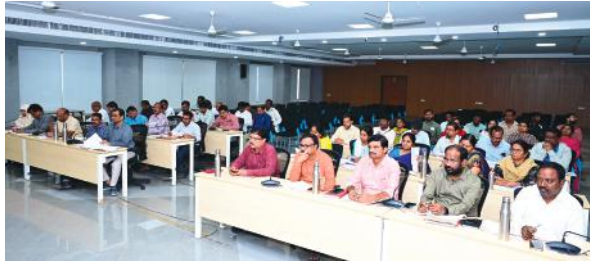
మెదక్ మేజర్ న్యూస్ ప్రతినిధి : పారదర్శక రెవెన్యూ పాలనే లక్ష్యంగా జిల్లాను