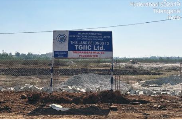
ఎంఎస్ శ్రీనిధి ఇండస్ట్రీస్ కు చెందిన భూమిలో ఏర్పాటు చేసిన టీజీఐఐసీ బోర్డు

♦ కోర్టు ఆదేశాలు బేఖాతర్ ♦ అనుమతులకు నిరాకరిస్తున్న అధికారులు ♦ టీజీఐఐసీ అధికారుల తీరుపై సర్వత్రా విమర్శలు