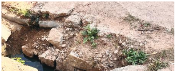
సీతారామచంద్రస్వామి దేవాలయంలో జరిగే ఏప్రిల్ 6 నుండి కళ్యాణ మహోత్సవం జరగనుంది. 9 నాడు ఉత్సవాలకు దేవత విగ్రహాల ఊరేగింపులు జరిగే ఈ ప్రధాన దారి లో డ్రైనేజీ కుంగిపోయి సిసి రోడ్డు కూడా కుంగిపోయి గోతుల మరియు అంగడి బజార్ నుండి రామాలయం సిసి రోడ్డు గుంతల మరియు పరిస్థితి ప్రత్యక్షంగా రోజు చూస్తున్నాం నిత్యం