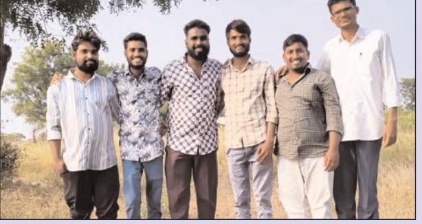
చౌటుప్పల్ : చౌటుప్పల మండలంలోని పంతంగి గ్రామ పడవ తరగతి 2014