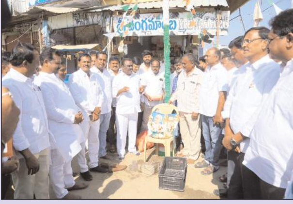
తిరుమలగిరి : తిరుమలగిరి పట్టణంలోని ప్రభుత్వ జూనియర్ కళాశాల, జిల్లా