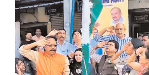
హిమాయత్ నగర్, మేజర్ న్యూస్ : సార్వభౌమాధికారం, స్వేచ్ఛ, ఐక్యత, సమగ్రత, సమానత్వ హక్కులు కల్పిస్తున్న భారత రాజ్యాంగాన్ని బీజెపి