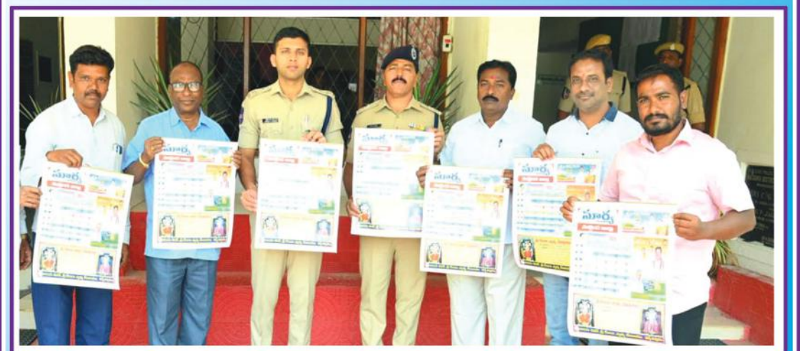
నల్గొండ జిల్లా బ్యూరో

సూర్య దినపత్రిక నూతన సంవత్సరం (2025) క్యాలెండర్ ను జిల్లా ఎస్సీ శరత్ చంద్ర పవర్ సోమవారం జిల్లా పోలీస్ కార్యాలయంలో ఆవిష్కరించారు. అనంతరం ఎస్సీ మాట్లాడుతూ ప్రజలకు ప్రభుత్వానికి వారధిగా పనిచేస్తూ నిరంతరం ప్రజా సమస్యలను అధికారుల, ప్రభుత్వం దృష్టికి తీసుకువస్తూ పరిష్కారం మార్గాలని ఎజెండాగా పనిచేస్తూ సూర్యాపత్రిక ముందుకు సాగుతుందన్నారు. ప్రజా సమస్యల పరిష్కారం కోసం నిరంతరం పనిచేస్తున్న ఏకైక పత్రిక మిగతా 2లో