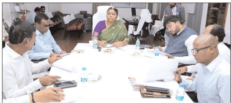
ఉమ్మడి నల్గొండ జిల్లా బ్యూరో