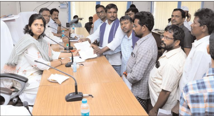
నల్గొండ జిల్లా బ్యూరో

ప్రజావాణి ద్వారా స్వీకరించిన ఫిర్యాదులను వెంటనే పరిష్కరించాలని జిల్లా కలెక్టర్ ఇలా త్రిపాఠి అధికారులను ఆదేశించారు. రెవెన్యూ శాఖతో పాటు, అన్ని శాఖల అధికారులు ప్రజావాణి దరఖాస్తుల పరిష్కారం పై ప్రత్యేక డిప్లీ సారించాలని చెప్పారు. ప్రజావాణి కార్యక్రమంలో భాగంగా సోమవారం అమె జిల్లా కలెక్టర్ కార్యాలయంలోని సమావేశ మందిరంలో ప్రజల వద్ద నుండి ఫిర్యాదులను స్వీకరించారు. అనంతరం వివిధ అంశాలపై జిల్లా కలెక్టర్ జిల్లా అధికారులతో సమ్మిళిత సమావేశం నిర్వహించి సమీక్షించారు. ఇందిరమ్మ ఇండ్ల డేటా ఎంట్రీలో ఎలాంటి తప్పులు లేకుండా చర్యలు తీసుకోవాలన్నారు. కొన్ని ప్రైవేటు పాఠశాలల్లో 3 శాతం అనాధలకు రిజర్వేషన్ అమలు చేయడం లేదని తమ దృష్టికి వచ్చిందని, అలాంటి వారిపై చర్యలు తీసుకుంటామని తెలిపారు. ఈ సందర్భంగా జిల్లా కలెక్టర్ మహిళా ప్రాంగణం, మహిళా క్యాంటీన్ ఏర్పాటు, వైద్య, ఆరోగ్యశాఖ, తదితర అంశాలపై సమీక్ష నిర్వహించారు. మిర్యాలగూడ సబ్ కలెక్టర్ నారాయణ అమిత్, డిఆర్వో అమరేందర్, స్పెషల్ కలెక్టర్ నటరాజ్, ఆర్డీవో వై.అశోక్ రెడ్డి, జిల్లా అధికారులు ప్రజల వద్ద నుండి ఫిర్యాదులను స్వీకరించారు. కాగా ఈ సోమవారం (87) మంది ఫిర్యాదుదారులు వారి ఫిర్యాదులను సమర్పించారు.