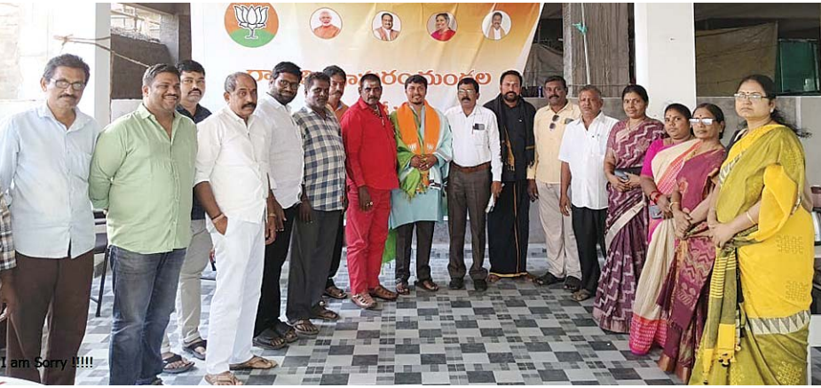
I am Sorry !!!!!