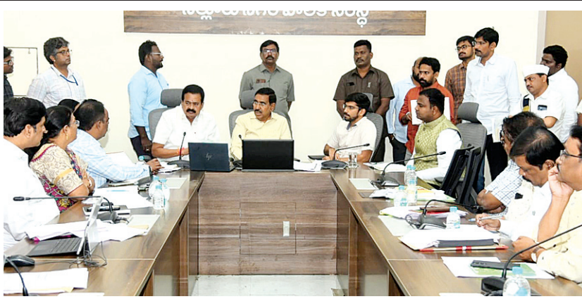
అంశాలలో మార్పులు చేసి ప్రజలకు అనుకూలం దారులు, అలాగే లేఅవుట్ నిర్వాహకులు గా సులభతరం చేశామన్నారు. ఇంటి నిర్మాణ అత్యంత సులువుగా -మిగతా 2లో