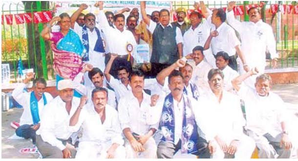
డిల్లీలో ధర్నా చేస్తున్న బెస్తసంఘీయులు, ఫైల్ ఫోటో