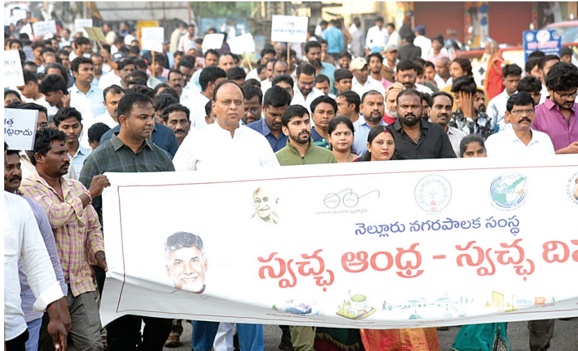
నెల్లూరు కలెక్టరేట్, మేజర్స్ హ్యూస్ :