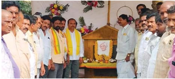
అభినందనం.. తెలుగు జాతికి శుభాభివందనం' అనే మాటలు తెలుగోడి సత్కాను జగమంతా చాటిందని గుర్తు చేసుకుంటున్నారు.

'సినిమా వాళ్లను చిన్నచూపుతో చూడకండి.. ఏదో ఒక రోజు వారు ప్రపంచాన్నే మార్చేయగలరు' అన్న ఆంగ్ల రచయిత బెర్నార్డ్ షా మాటలను నిజం మహనీయుడు ఎన్టీఆర్ వర్ధంతి. ఈ సందర్భంగా ఎన్టీఆర్ ప్రసంగాల్లో తొలి పలుకు అభిమానులు సర్పించుకుంటున్నారు. 'తెలుగు జనతకు వందనం.. తెలుగు యువతకు అభివందనం.. తెలుగు మమతకు