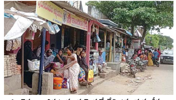
జిల్లా వైద్యశాల ఎదుట మండుబెండల్లో వేచి ఉన్న ప్రయాణీకులు