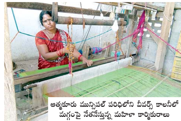
ఆత్మకూరు మున్సిపల్ పరిధిలోని వీవర్స్ కాలనీలో మగ్గాలపై నేతనేస్తున్న మహిళా కార్మికురాలు

ఆ గిరాకికి తగ్గట్లుగా తాము అధునాతనరీతిలో నేతనేసే పరిస్థితి లేదని, నాలుమగ్గాలపై సాధ్యం కావడం లేదని చెబుతున్నారు. ఆత్మకూరు వీవర్స్ కాలనీలో పాతికేళ్ళ క్రితం 50కుటుంబాల వాగరం ప్రభుత్వం అప్పట్లో మంజూరుచేసిన చిన్నపాటి గృహాలు నిర్మించుకున్నామని, కుటుంబాల సంఖ్య 70కు పెరిగినా ప్రభుత్వం నుండి తగిన ఆదరణ లభించలేదని, తమకు పాఠశాల లేదని, అంతర్గత రహదారులు, సైదుకాలువలు లేవని, కాలనీలో ఆక్రమణలు పెరిగిపోయాయని, తమ వృత్తి గిట్టిబాటు కాక కొందరు వలసవెళ్ళారని చెబుతున్నారు. మగ్గాలున్న వారికి ప్రభుత్వం 24వేల రూపాయలవంతు సాయమందించినది, కానీ శాశ్వత ప్రతిపదికన మరమగ్గాలు మంజూరు చేయాల్సిన అవసరం అనివార్యమని వారు పేర్కొన్నారు. గతంలో నెల్లూరుపాళెం పంచాయతీలో ఉన్న తమ ఓట్లు మాత్రం ఆత్మకూరు పంచాయతీలో ఉండడంతో అభివృద్ధికి నోచుకోలేదని, అయితే మున్సిపల్ పరిధిలో చేర్చినా తగిన మౌళికవసతులు కల్పించడం లేదని, గృహాలకు మరమృత్తులు లేదా కొత్తగా ఇళ్ళు మంజూరుకు చర్యలు తీసుకోవాల్సిన అవసరం ఎంతైనా ఉందని వారు చెబుతున్నారు. తమ కాలనీనుండి రోడ్డు వెంబడి చిన్నారులు ఆత్మకూరు పట్టణంలోకి బడికి వెళ్ళడం ఇబ్బందికరంగా ఉందని, తమ కాలనీలోనే ఒక స్కూలు ఏర్పాటుచేయాలన్న తమ కోరిక కంఠశోషగానే మిగిలిందని వారు పేర్కొన్నారు. పవర్ లామ్పి (విద్యుత్ మగ్గాలు) మంజూరుకు అనేక దపాలు విన్నపాలు చేసినా ఎవరూ పట్టించుకోలేదని కూడా వారు ఆవేదనతో చెబుతున్నారు. పాతికేళ్ళకు ముందు నిర్మించిన చిన్నపాటి కాలనీ గృహాలు