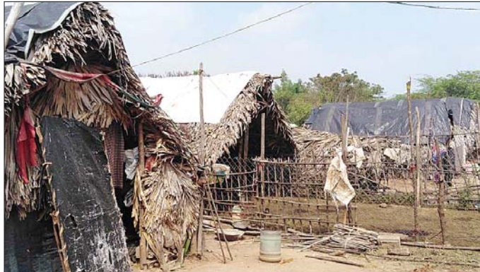
తాటాకు పూరి గుడిసెల్లో నివాసాలు ఉంటున్న గిరిజనులు

ఆత్మకూరు, మేజర్ న్యూస్ : ఆత్మకూరు మండలం పమిడిపాడు వద్ద తాటాకు గుడిసెల నివాసాలకే పరిమితమైన గిరిజనులు (యానాదులు) రెంటికిచెద్దరేవళ్లుగా మారామని తీవ్ర ఆవేదనతో చెబుతున్నారు. ఆ గిరిజనుల గుడిసెలవద్ద మేజర్ న్యూస్ ప్రతినిధి పరిశీలించి అక్కడి మహిళలను పలకరిస్తే వారి గోడు అత్యంత దయనీయంగా ఉంది. అనాదిగా పమిడిపాడు గ్రామం వెలుపల ఆత్మకూరు-వింజమూరు మార్గంలో రోడ్డు అంచున