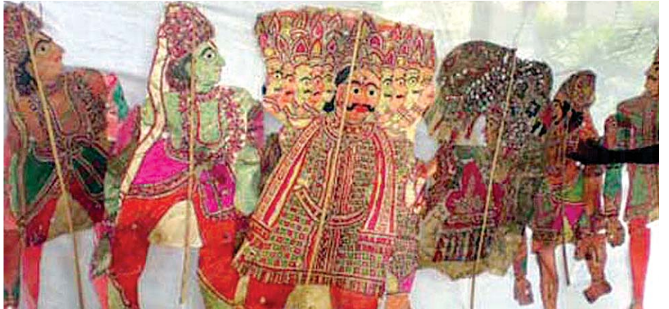
చర్యంతో తయారుచేసి తెరపై ప్రదర్శించే బొమ్మలు

చర్యంతో నిర్మించిన రావణాసురుడు బొమ్మ అలరింపజేసేవారు. తెలుగుసామెతలు, నుడికారాలు, సంభాషణలు గ్రామీణులను ఆకట్టుకునే మాండలిక విధానంలో ఊరూరా ప్రదర్శనలిస్తుండేవారు. కడప,