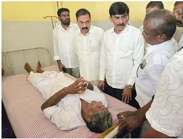
జరిగితే సహించేది లేదని వారు తెలిపారు. ఈ కార్యక్రమంలో వైసిపి నాయకులు కార్యకర్తలు పాల్గొన్నారు.