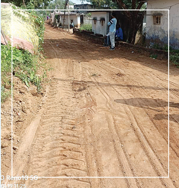
O Reno16 56 01/19 11:25