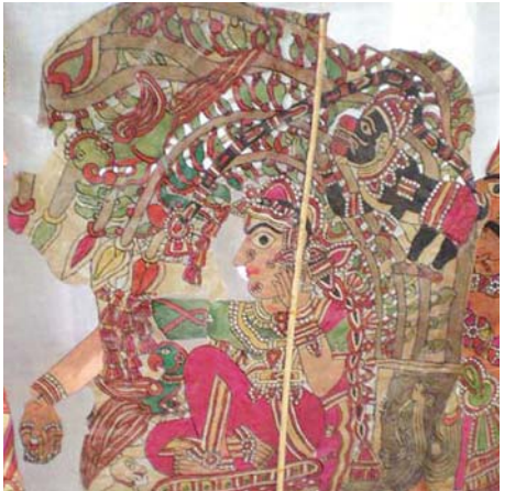
చర్యంతో తయారు చేసిన సీతమ్మ బొమ్మ

అనంతపురం, కాకినాడ, బద్వేలు, చెన్నంపల్లి, నెల్లూరు జిల్లాలోని డి.సి.పల్లి, నువ్వరుపాడు, బోయలచిరువెళ్ళ, లింగంగుంట, మినగల్లు, రేపూరు, శంకరనగరం, తాతిరెడ్డిపల్లి, నల్లినగరం, గండువారిపల్లి, ఓబులూరు పల్లి, తదితర పట్టణాల్లో, గ్రామాల్లో తోలుబొమ్మలాట కళాకారులున్నారు. వారు కేంద్ర, రాష్ట్ర ప్రభుత్వాల సహకారంతో ప్రాచీనకళలుగా తోలుబొమ్మలాట ప్రదర్శనలకు డెన్యూర్స్, టోక్సో, హీరోషిమా, ఇషాబుల్, హాంకాంగ్, అమెరికా, రష్యాలతోపాటు ముంబాయి, ఢిల్లీ, చెన్నై, హైదరాబాదు, విజయవాడ తదితర ప్రాంతాల్లో ప్రదర్శనలిచ్చి అమెరికా అధ్యక్షుడు, భారత ప్రధాన మంత్రి, వివిధ దేశాల అధ్యక్షులు, ముఖ్యమంత్రులు ముద్రించేనాటికి, భవనం వెంకట్రామ్, నందమూరి తారక రామారావు, కోట్ల విజయభాస్కరరెడ్డి, తదితర ప్రముఖులచే ప్రశంశించబడి, సత్కరించబడి పలు పురస్కారాలు కూడా అందుకున్నారు. నేడు వారి కళలకు ఆదరణ గణనీయంగా తగ్గడంతో కూలీనాలీ పనుల ద్వారా జీవనపోరాటం సాగిస్తున్నారు. ఈ కళాకారులు చర్యంతో బమ్మలు ఆకర్షణీయంగా తయారు చేయడం వెన్నతోపెట్టిన విద్యగా ఉంటుంది. డిసిపల్లిలో శతాబ్దం పాటు తోలుబొమ్మలాట కళ విరాజిల్లడంతోపాటు అక్కడ కేంద్రప్రభుత్వం ఆధ్వర్యంలో తోలుబొమ్మల తయారీ కేంద్రం కూడా ఉండేది. అదిలో ఒక బమ్మ 50రూపాయలకే తయారయ్యేదని, నేడు వేలరూపాయలకు చేరిందని చెబుతుంటారు. నేడు తమ ప్రదర్శనలు తిలకించేవారే లేరని, తాము వృత్తి కళాకారులుగా కొనసాగుతూ ఇతరత్రా పనులు చేతకకుండా ఉండగా నేడు అనివార్యమై పొట్టకూటికై కూలీపనులు