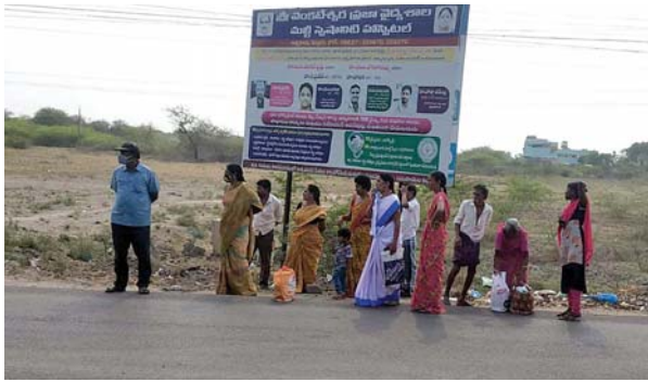
సోమశిల రోడ్డు సెంటర్లో పడిగాపులున్న ప్రయాణీకులు

ఆత్మకూరు, మేజర్స్ న్యూస్ : ప్రయాణీకులు బస్ షెల్టర్లు లేక ఇబ్బందిపడుతుండగా వాటిని చిన్నసమస్యలుగా భావిస్తున్నారా, ఇలాంటి చిన్న సమస్యలను తాము పట్టించుకోవాల్సిన అవసరమా అని బావిస్తున్నారా, పాలకులు ఎలాభావిస్తున్నారో కానీ జనాల ఇబ్బందులు మాత్రం తీవ్రంగా ఉంటున్నాయి. ఆత్మకూరు పట్టణంలో, పరిసరాల్లో పాలకుల నిర్లక్ష్యం, అధికారుల అలసత్వంతో ప్రయాణీకులు బస్సుల కోసం వేచిఉండేందుకు షెల్టర్లు లేక ఎండలో, వానలో నానా అవస్థలు పడుతున్నారు. అనాదిగా ఈసమస్యల గురించి పత్రికలు ఘోషిస్తున్నా ప్రజలుగీపెడుతున్నా ఎవరూ చెవికెక్కించుకోవడం లేదు. ఆత్మకూరులోని జిల్లా ప్రభుత్వ వైద్యశాల ఎదుట, సోమశిల రోడ్డు సెంటర్లో, ఆంధ్రా ఇంజనీరింగ్ కాలేజీ వద్ద, ఏఎస్ పేట క్రాస్ రోడ్డువద్ద ప్రయాణీకులు, రోగుల బంధువులు బస్సుల కోసం