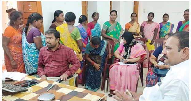
కావలి, మేజర్స్ న్యూస్ : కావలి నియోజకవర్గం దగ్గర్లో మండలంలో సోమవారం జరిగిన గ్రీవెన్స్ డేకు పలు సమస్యలపై అర్జీదారులు దగ్గర్లో