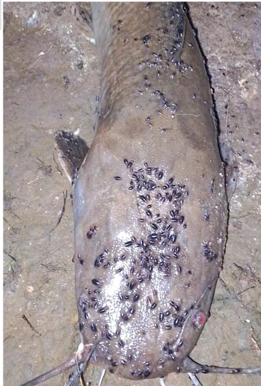
వింత పురుగైన, మున్నర వ్యాపారుల పని అయిన, చేపల వేట జీవనోపాధి అయిన పేద జాలర్లకు నేడు గడ్డు కాలమే అన్నట్లు ఉంటుంది.

చేపపై వందల సంఖ్యలో దాడి చేసే వాటిని పీల్చి పిప్పి చేస్తున్నాయి. వీటి దాడి నేపథ్యంలో మిగిలిన అరకొర చేపలు నీటిలో ఉన్న జమ్ములో, నాచులో దాగుకుంటున్నాయన్న అభిప్రాయం మత్స్యకారుల్లో వ్యక్తం అవుతోంది. ఈ దుస్థితితో వల విసిరి చేపలు పట్టుకుని జీవనోపాధి సాగించే నిరుపేద జాలర్ల జీవన పరిస్థితి కడు దయ నీయంగా మారింది. చేపలు పునరుత్పత్తికి తావు లేకుండా గుడ్లు సీజన్లో కొందరు ముప్పులు నిషేధిత అలివి వల వేట సాగిస్తూ వారి స్వలాభ మే తప్ప పేద జాలర్ల గోడు పట్టించుకోవడం లేదు. చేప లేకపోవడానికి మరి ఒక కారణం ప్రతి నాలుగు సంవత్సరాలకి ఓసారి జలాశయంలో ఇతర సుదూర జిల్లాల నుండి చేప పిల్లలను నీటిలో మత్స్యశాఖ విడుదల చేస్తూ వచ్చేది. అయితే గత ప్రభుత్వ హయాంలో ఆ ఊసే లేకుండా పోయింది. ఈ పరిస్థితి కూడా ప్రస్తుతం జలాశయంలో చేపలు ఉన్నాయా.. అనే సందిగ్ధాన్ని రేకెత్తిస్తున్నాయి. ఏదీఏమైనా అది