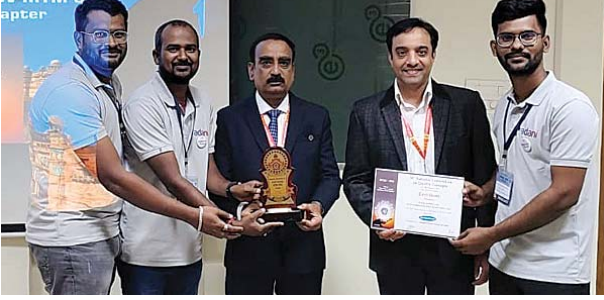
ప్రాజెక్టులు ఈ సంవత్సరం తెవాన్ లో జరగనున్న ఇంటర్నేషనల్ కన్వెన్షన్ ఆఫ్ క్వాలిటీ సర్కిల్ అర్హత సాధించాయి. అదాని కృష్ణపట్నం పోర్ట్ సీఈఓ జగదీష్ పటేల్ జట్టును ప్రశంసించారు.

ముత్తుకూరు, మేజర్స్ న్యూస్ : గ్వాలియర్ లో జరిగిన 38వ నేషనల్ కన్వెన్షన్ ఆన్ క్వాలిటీ కాన్సెప్ట్స్ 2024 కన్వెన్షన్ లో ఎక్సలెన్స్, ఎక్సలెంట్ అవార్డులను శనివారం అదాని కృష్ణపట్నం పోర్ట్ లిమిటెడ్ కైవసం చేసుకుంది. ఈ విషయాన్ని అధికారులు శనివారం తెలిపారు. గ్వాలియర్ లో నిర్వహించిన కార్యక్రమంలో అదాని కృష్ణపట్నం పోర్ట్ హాజరు కావడం జరిగింది. క్వాలిటీ సర్కిల్ ఫోరమ్ ఆఫ్ ఇండియా అటల్ బిహారీ వాజ్ పేయి-ఇండియన్ ఇన్స్టిట్యూట్ ఆఫ్ ఇన్ఫర్మేషన్ టెక్నాలజీ అండ్ మేనేజ్మెంట్ తో కలిసి ప్రజలలో పెట్టుబడి పెట్టడం, మంచి భవిష్యత్తును నిర్మించడం అనే థీమ్ తో వార్షిక ఈవెంట్ ను నిర్వహించారు. అదాని కృష్ణపట్నం పోర్ట్ నుంచి రెండు బృందాలు క్వాలిటీ సర్కిల్ కేటగిరి ఎంట్రీ క్రేస్ యొక్క అవ్ గ్రేడ్ చేసిన మల్టి-అపరేషన్ క్రెజెన్ కేటగిరి ఎంట్రీ "క్విక్ రిలీజ్ హాక్ ఫర్ ఎక్స్ కవేటర్ సిస్టమ్ ఇన్ వెస్ట్రల్ హాక్"లో దాని ఫ్లాగ్ షిప్ కేస్ స్టడీను ప్రదర్శించడం ద్వారా జాతీయ సమావేశంలో పాల్గొన్నారు. రెండు