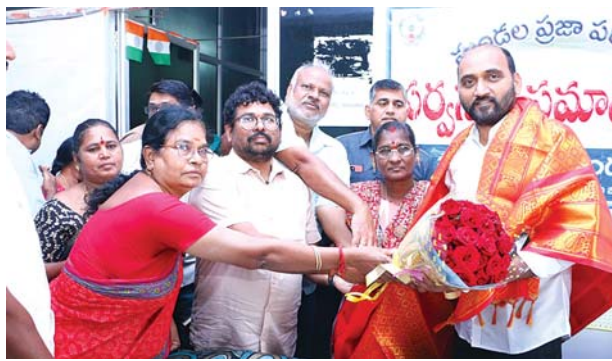
నాయకులు, కార్యకర్తలు, అభిమానులు, ప్రజలు తదితరులు పాల్గొన్నారు.

జలదంకి, మేజర్స్ న్యూస్ : జలదంకి మండల కేంద్రంలోని మండల ప్రజా పరిషత్ కార్యాలయం నందు నిర్వహించిన జలదంకి మండల సర్వసభ్య సమావేశంలో ఉదయగిరి ఎమ్మెల్యే కాకర్ల సురేష్ పాల్గొని అన్ని శాఖల అధికారుల సమన్వయం, వారు చేపట్టిన పనులను తెలుసుకున్నారు. అనంతరం ఎమ్మెల్యే కాకర్ల సురేష్ మాట్లాడుతూ.. ప్రజల యొక్క అవసరాలను తెలుసుకొని, మౌలిక వసతుల కల్పనే ధ్యేయంగా పని చేయాలని అధికారులను ఆదేశించారు. ప్రభుత్వ కార్యాలయాలకు వచ్చిన ప్రజల సమస్యలను సత్వరంగా చర్యలు తీసుకుని పరిష్కరించాలని ప్రజలే దేవుళ్ళు అనే విధంగా వారికి తగు ప్రాధాన్యత ఇచ్చి గౌరవించాలని అధికారులకు సూచించారు. మండల స్థాయిలో గల డ్రైనేజీ, పారిశుధ్య, త్రాగునీరు సమస్యలను ఒకదాని తర్వాత ఒకటి పరిష్కరించడం జరుగుతుందని, ఇది ప్రజా ప్రభుత్వం అని తెలిపారు. ఈ కార్యక్రమంలో అన్ని శాఖల అధికారులు, తెలుగుదేశం జనసేన బిజెపి కూటమి