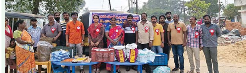
నెల్లూరు రూరల్, మేజర్స్ న్యూస్ : పవర్ యాత్ నిర్వహిస్తున్నారు. అందులో భాగంగా నగరం స్వచ్ఛంద సేవా సొసైటీ 5వ వార్షికోత్సవ నందు బోడిగోడ తోట సమీపంలో 200 మందికి పైగా పేదలకు విశేష అన్నదానం