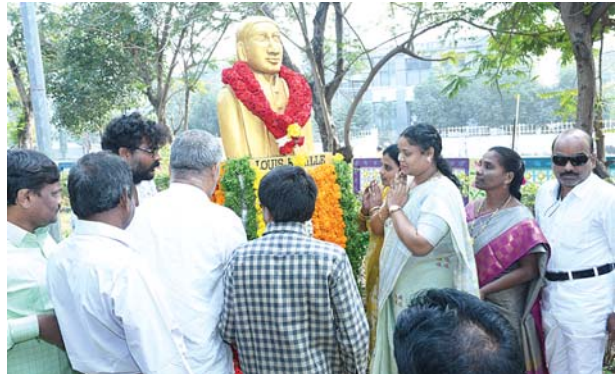
నెల్లూరు కార్పొరేషన్, మేజర్స్ న్యూస్ : బ్రెయిలీ లిపిని కనిపెట్టిన లూయిస్