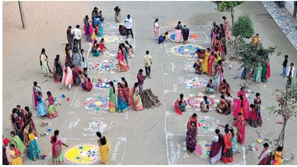
జరుపుకోవాలన్నారు. ఈ కార్యక్రమంలో లంబిని విద్యాలయం బృందం, విద్యార్థులు పాల్గొని ఈ కార్యక్రమం విజయవంతం చేశారు.

చేజర్ల, మేజర్స్ న్యూస్ : చేజర్ల మండలంలోని చేజర్ల లంబిని విద్యాలయంలో గురువారం ముందస్తు సంక్రాంతి పండుగ సంబరాలు జరుపుకున్నారు. ఈ సందర్భంగా విద్యాలయం ఆవరణమంతా తోరణాలు చెరుకు గడలతో, రంగవల్లికలతో, పల్లెటూరి వాతావరణం తీసుకొచ్చారు. కాలుష్యం లేని భోగిమంటలతో వేడుకలకు నాంది పలికారు. విద్యార్థులు సాంప్రదాయ దుస్తుల్లో హాజరయ్యారు. ఈ సందర్భంగా కరస్పాండెంట్ రమేష్ మాట్లాడుతూ.. మన సాంప్రదాయాలు, ఆచార వ్యవహారాలు మన పండుగల్లోనే దాగున్నాయన్నారు. కావున విద్యార్థులు పండుగలోని మూలాలను తప్పక తెలుసుకోవాలన్నారు. సంక్రాంతి పండుగంటేనే భోగి మంటలు,పిండి వంటలు, పూరిగుడిసెలు, గొబ్బెమ్మలు, హరిదాసులు, గాలి పటాలు, విద్యార్థిని విద్యార్థుల నృత్య ప్రదర్శనలు, రంగా రంగవల్లికలలో పాల్గొన్న బాలికలకు బహుమతులు అందజేశారు. ఇలా సంక్రాంతి పండుగ ప్రఖ్యాతి గాంచిన సంక్రాంతి పండుగను ప్రతి ఇళ్లలో సంతోషంగా