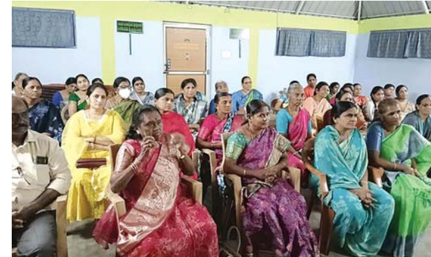
కార్యక్రమంలో పాల్గొన్న జనం