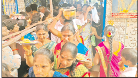
సంవత్సరం కూడా ఎక్కడెక్కడో నివసించిన భక్తులు పొట్లపాడు గ్రామం చేరుకొని తమ మొక్కులను తీర్చు కుంటూ భక్తి శ్రద్ధలతో స్వామివారి పూజలో మమేకమ య్యారు. వచ్చిన భక్తులకు స్వామివారి దేవస్థానం తరువున భోజన వసతి ఏర్పాటు చేశారు. అలాగే కమ్మ సత్రంలో భోజనాలు ఏర్పాటు చేయడం జరిగింది. రాత్రికి భక్తులు జాగరం కొరకై పాట కచ్చేరి వంటి సాంస్కృతిక కార్యక్రమాలు ఏర్పాటు చేయడం జరిగింది.