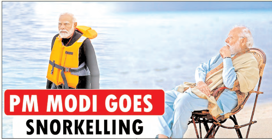
PM MODI GOES SNORKELLING