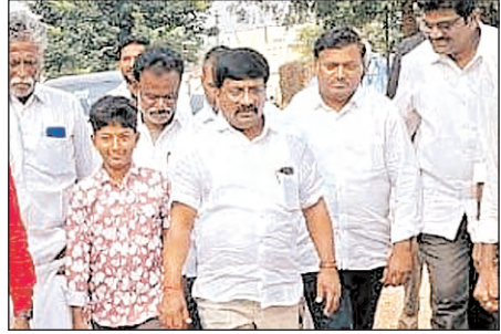
అందిస్తానని ఎమ్మెల్యే అన్నారు. ఈ కార్యక్రమంలో పలువురు మండల, గ్రామ నాయకులు పాల్గొన్నారు.