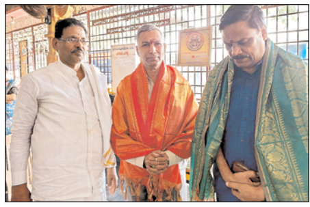
అందిస్తానని ఎమ్మెల్యే అన్నారు. ఈ కార్యక్రమంలో పలువురు మండల, గ్రామ నాయకులు పాల్గొన్నారు.