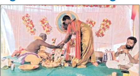
, తీర్థప్రసాదాలు అనంతరం 1000 మందికి అన్న సంతర్పణ కార్యక్రమం నిర్వహించారు. ఈ కార్యక్రమం సు గ్రామ పెద్దలు పర్యవేక్షించారు.