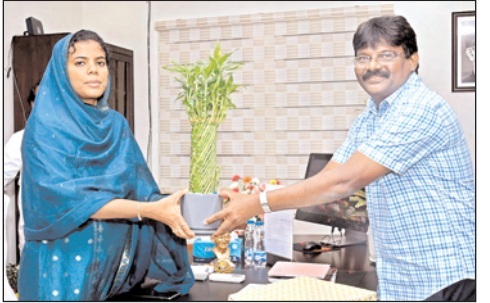
ఛాంబర్లో వివిధ శాఖల ఉన్నతాధికారులు కలిసి నూతన సంవత్సర శుభాకాంక్షలు తెలియజేశారు.