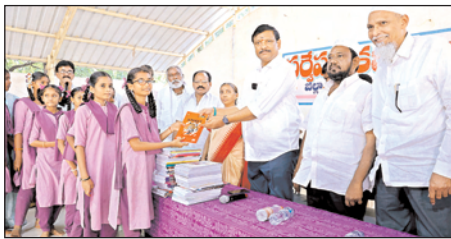
ఇంటి వద్ద ఏర్పాటు చేశామన్నారు. ఈ కార్యక్రమంలో గర్ల్స్ హైస్కూల్ విద్యార్థినిలు, ఉపాధ్యాయులు, తెలుగుదేశం నాయకులు పాల్గొన్నారు.