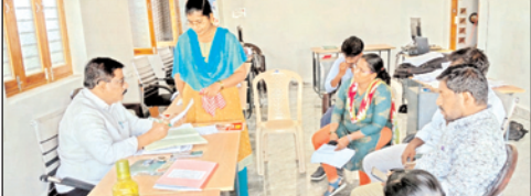
పాటించి బాధ్యతగా వ్యవహరించి, ప్రభుత్వం చేపట్టే ప్రతి సంక్షేమాన్ని ప్రజలకు అందించడానికి, ప్రభుత్వ పథకాలను ప్రజల దృష్టికి తీసుకువెళ్లడానికి, ప్రజా సమస్యలను పరిష్కరించడానికి, అశ్రద్ధ లేకుండా బాధ్యతగా వ్యవహరించి ప్రభుత్వానికి మంచి పేరు తీసుకురావాలని తెలియజేశారు. కార్యక్రమంలో సచివాలయ సిబ్బంది పాల్గొన్నారు.

కొమరోలు, మేజర్ న్యూస్: మండల పరిధిలోని సూరవారిపల్లె గ్రామ సచివాలయాన్ని బుధవారం నాడు స్థానిక ఎంపీడివో సయ్యద్ మస్తాన్ నగ్గి ఆకస్మికంగా తనిఖీ చేశారు. ఈ సందర్భంగా గ్రామ సచివాలయంలోని సిబ్బంది హాజరును పరిశీలించారు. అనంతరం సచివాలయ సిబ్బంది ద్వారా జరుగుతున్న జిఎస్ డిబ్ల్యూఎస్ సర్వే వివరాలను, బయోమెట్రిక్ అటెండెన్స్ అలాగే శానిటేషన్ వివరాలను పరిశీలించి సిబ్బందికి సూచనలు, సలహాలు చేయడం జరిగింది. అనంతరం రానున్న నెలలో పెన్షన్ డిస్ట్రిబ్యూషన్ కు చేపట్టవలసిన ఏర్పాట్లను గురించి సమీక్షించి సిబ్బందికి సలహాలు ఇవ్వడం జరిగింది. అనంతరం సిబ్బందితో ఆయన మాట్లాడుతూ సిబ్బంది అందరూ కూడా సమయాన్ని