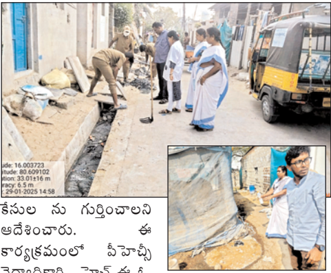
కేసుల ను గుర్తించాలని ఆదేశించారు. ఈ కార్యక్రమంలో పీహెచ్ఐ వైద్యాధికారి, హెచ్ ఈ ఓ, పి హెచ్ ఎస్, ఆరోగ్య పర్యవేక్షకులు, హెచ్ వి, స్టానిక సచివాలయం ఏఎన్ఎం, ఆశా కార్యకర్తలు పాల్గొన్నారు.