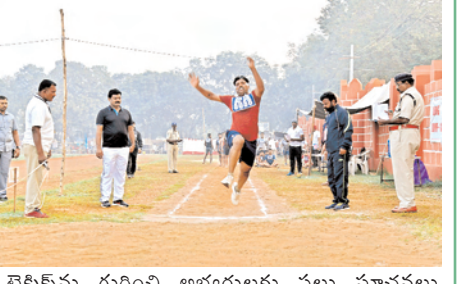
టెక్నిక్స్ ను గురించి అభ్యర్థులకు పలు సూచనలు చేశారు. గురువారం 552 మంది అభ్యర్థులు దేహదారుడ్య పరీక్షలకు హాజరయ్యారు. వీరిలో 365 మంది అభ్యర్థులు క్వాలిఫైడ్ అయ్యారు. అభ్యర్థుల దేహదారుడ్య, పరుగు మిగతా 3లో