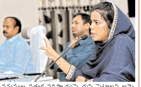
సమస్యల సత్వర పరిష్కారంపై దృష్టి పెట్టాలని ఆమె పుష్టం చేశారు. ఈ విషయంలో మండల సర్వేయర్లతో తహసీల్దారు ప్రత్యేకంగా చర్చించి రెవెన్యూ, రెవెన్యూ యేతర సమస్యలకు సంబంధించిన అర్జీలను వేరుపరచాలని చెప్పారు. సమస్యల మిగతా 3లో

ఒంగోలు, మేజర్ న్యూస్ : రెవెన్యూ సదస్సులలో వచ్చిన అర్జీలను సత్వరమే పరిష్కరించాలని జిల్లా కలెక్టర్ ఏ. తమిమ్ అన్నారాయ్ పుష్టం చేశారు. ఈ నెల 8వ తేదీతో రెవెన్యూ సదస్సులు ముగిసిన నేపథ్యంలో అన్ని మండలాల తహసీల్దార్లు, మండల సర్వేయర్లతో కలెక్టరేట్ లో గురువారం జాయింట్ కలెక్టర్ ఆర్.గోపాలకృష్ణతో కలిసి ఆమె ప్రత్యేక సమావేశం నిర్వహించారు. ఈ సందర్భంగా ఆమె మాట్లాడుతూ రెవెన్యూ సదస్సుల నిర్వహణకు నేపథ్యాన్ని, రెవెన్యూ సమస్యల పరిష్కారానికి ప్రభుత్వం ఇస్తున్న ప్రాధాన్యాన్ని వివరించారు. దీనికోసమే ఇటీవల కలెక్టర్లకు జోసల్ స్థాయి సమావేశాన్ని కూడా మంత్రి, రెవెన్యూశాఖ ప్రిన్సిపల్ సెక్రటరీ, సి.సి.ఎల్.ఎ నిర్వహించడాన్ని ప్రస్తావించారు. ఈ దృష్ట్యా రెవెన్యూ