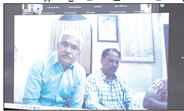
వికారాబాద్ జిల్లా ప్రతినీధి, మేజర్ న్యూస్ (జనవరి 15): ప్రభుత్వ పథకాలను క్షేత్రస్థాయిలో అర్జున ప్రతి ఒక్కరికి అందించాలని జిల్లా కలెక్టర్ ప్రతీక్ జైన్ తెలిపారు. మంగళా 3లో

▶▶ జిల్లా కలెక్టర్ ప్రతీక్ జైన్ ▶▶ ప్రభుత్వ సంక్షేమ పథకాల అమలుపై ఎంఆర్ ఓలు, అధికారులతో వీసీ