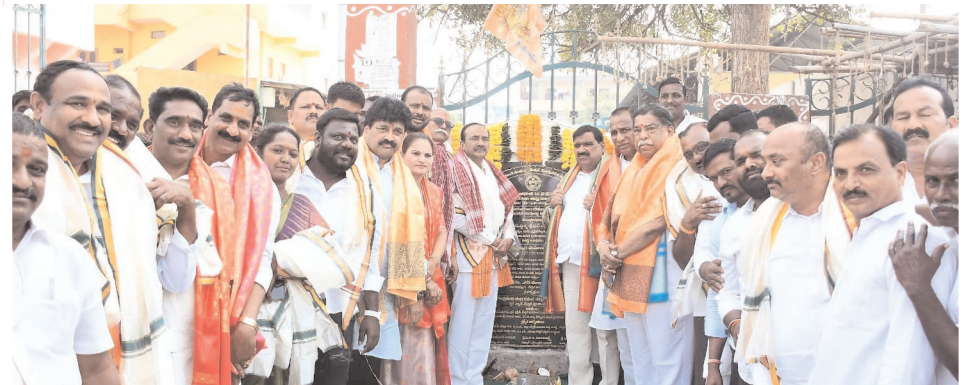
మేడ్చల్ జిల్లా ప్రతినిధి, మేడ్చల్ మేజర్ న్యూస్ (జనవరి 16): రిపబ్లిక్ దినోత్సవం నుంచి రాష్ట్రంలో అరులైన రైతులకు ఎకరాకు రూ.6 వేల రైతు భరోసా, ఇళ్ల స్థలం ఉంది అర్హులను నిర్వహించేందుకు ఇందిరమ్మ ఇళ్ల స్థలాలను ఇచ్చే కార్యక్రమాలను రాష్ట్ర ప్రభుత్వం అమలు చేయనుందని రాష్ట్ర ప్రభుత్వ చీఫ్ విప్ డాక్టర్ పట్నం మహేందర్ రెడ్డి అన్నారు. మిగతా 3లో

▶▶ ప్రభుత్వ చీఫ్ విప్ డాక్టర్ పట్నం మహేందర్ రెడ్డి ▶▶ అరులైన ప్రతి ఒక్కరికి పథకాలు అందిస్తాం ▶▶ మేడ్చల్ పురపాలక సంఘం పరిధిలో రూ.44 కోట్ల నిధులతో పలు అభివృద్ధి పనుల ప్రారంభం