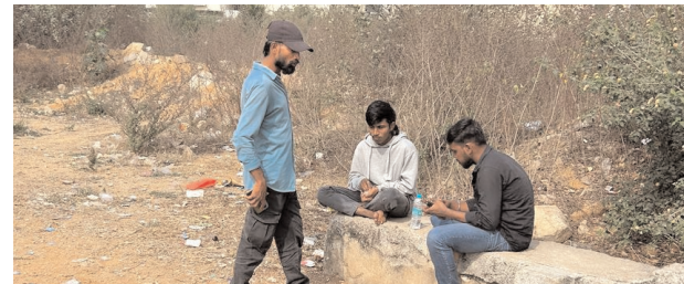
గంజాయి వినియోగంలో యువకులు (ఫైల్)