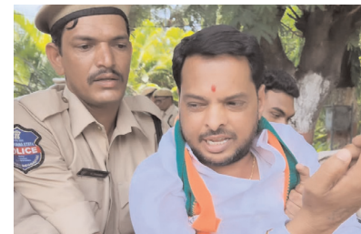
నిరుద్యోగులకు జాబ్ క్యారెండర్ రిలీజ్ చేయాలని ధర్నాలో