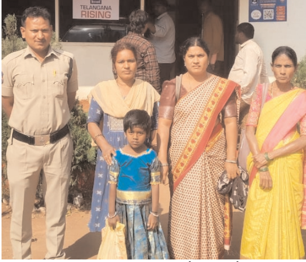
కుమారునికి కూడా మానసిక పరిస్థితి బాగా లేకపోవడంతో మూడు నాలుగు నెలల క్రితం మృతి చెందినట్లు గ్రామస్థులు ఎవరూ వెళ్లకపోవడంతో పంచాయతీ కి చెందిన ట్రాక్టర్లో తీసుకెళ్లి అంత్య క్రియలు చేసినట్లు సమాచారం..