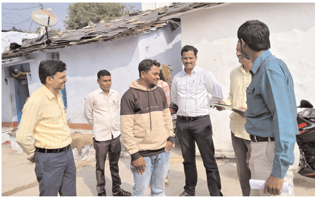
వాలని తెలిపారు. ఈ సందర్భంగా రెవెన్యూ అధికారులు, సిబ్బంది ఉన్నారు.