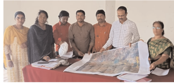
సిబ్బంది తదితరులు పాల్గొన్నారు.