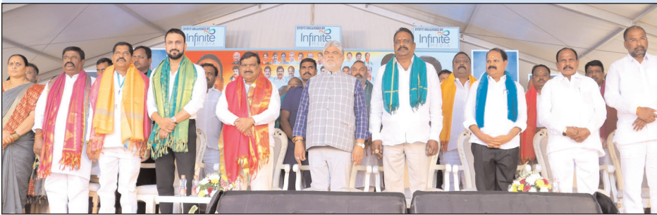
రంగారెడ్డి, మేజర్ న్యూస్ (జనవరి 17) : గుడిమల్కాపూర్ వ్యవసాయ మార్కెట్ కమిటీ నూతన పాలకవర్గం ప్రమాణ స్వీకారం కార్యక్రమం శుక్రవారం నాడు అట్టహాసంగా జరిగింది. తెలంగాణ అసెంబ్లీ స్పీకర్ గడ్డం ప్రసాద్ కుమార్ నూతన పాలకవర్గానికి ప్రమాణ స్వీకారం చేయించారు. మిగతా 2లో