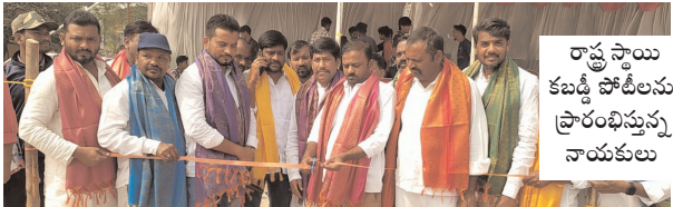
రాష్ట్ర స్థాయి కబడ్డీ పోటీలను ప్రారంభిస్తున్న నాయకులు