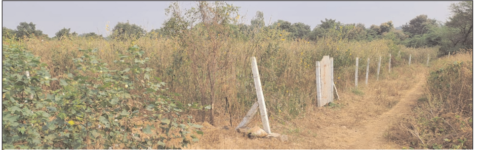
జ్యోతి లింగం కుటుంబ సభ్యులు పొలం చూట్టు పెన్సింగ్ వేసుకున్న దృశ్యం. వికారాబాద్ జిల్లా ప్రతినిధి, మేజర్ న్యూస్ (జనవరి 17): వికారాబాద్ జిల్లా వికారాబాద్ మండలం సిద్దలూరు(చించలం) గ్రామంలో రెవెన్యూ నక్ష రికార్డులకు పొంతన లేదు. ఒక సర్వేసంబర్లో కొనసాగాల్సిన రైతులు మరో సర్వేసంబర్లో కొనసాగుతున్నారు. మిగతా 3లో