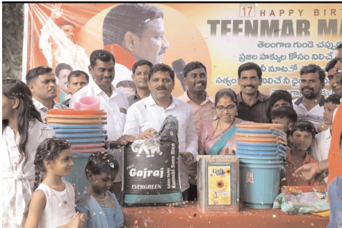
చిన్నారులకు బియ్యం, బకెట్లు అందజేస్తున్న దృశ్యం.

మాటకు లక్షల మందిని కదిలించే శక్తి కలవాడు తీన్మార్ మల్లన్న అని కొనియాడారు. అమాకులను పీడిస్తున్న నాయకులకు యముడిగా మారి ప్రజల పక్షాన పోరాడుతున్న యువతరం నాయకుడని అన్నారు. అలాగే రాష్ట్రంలో అధిక సంఖ్యలో ఉన్న బీసీలకు రాజ్యాధికారం రావాలని అందరిని ఐక్యం చేస్తు ముందుకు సాగుతున్న నాయకుడని ఆయన కలలకు మనందరం సహాయసహకారాలు అందించాల్సిన సమయం ఆసన్నమైందని తెలిపారు.