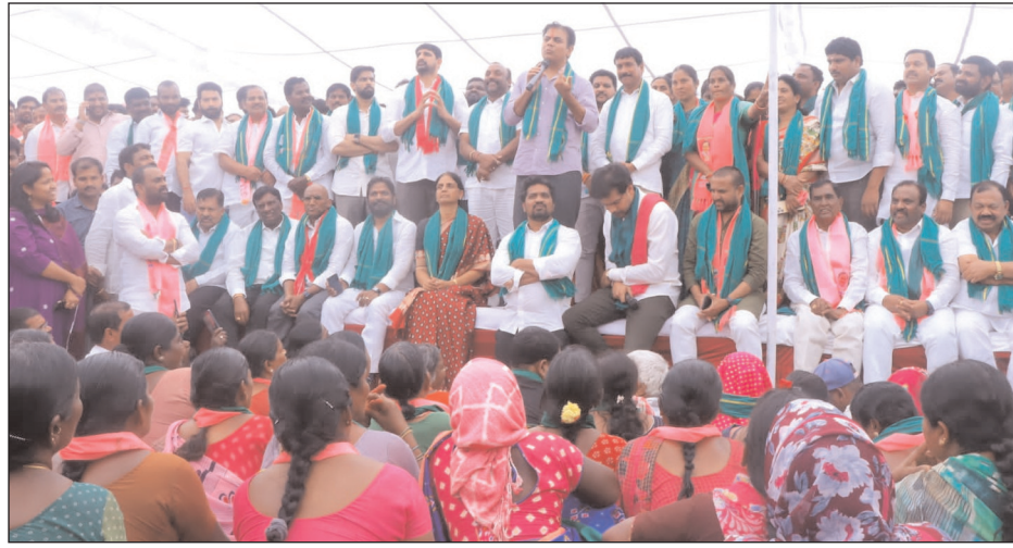
రంగారెడ్డి జిల్లా ప్రతినిధి, మేజర్ న్యూస్ (జనవరి 17) : విధాల అట్టర్ ఫ్లాష్ అయ్యిందని బీఆర్ఎస్ వర్కింగ్ ప్రెస్ రాష్ట్రంలోని కాంగ్రెస్ పార్టీ ప్రభుత్వం ఏడాదికాలానికే అన్ని డెంట్ కల్యకుంటూ తారక రామారావు విమర్శించారు. మిగతా 2లో

- పనుల్లో అలసత్వం వహిస్తే చర్యలు తప్పవు : జిల్లా కలెక్టర్ ప్రతిక్ జైన్ కాడంగల్, జనవరి 17 (మేజర్ న్యూస్): రోడ్డు నిర్మాణ పనుల్లో ప్రజలకు ఇబ్బందులు కలిగించొద్దని జిల్లా కలెక్టర్ ప్రతిక్ జైన్ అధికారులకు సూచించారు. మిగతా 3లో