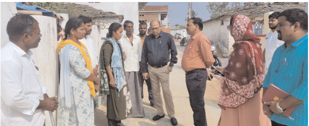
సర్వేను పరిశీలిస్తున్న అదనపు కలెక్టర్ లింగానాయక్

ధారూర్, మేజర్ న్యూస్ (జనవరి 17): సర్వేను పకడ్చందీగా నిర్వహించాలని అడిషనల్ కలెక్టర్ లింగానాయక్ అధికారులకు తెలిపారు. శుక్రవారం మండల పరిధిలోని ఎబ్బనూరు గ్రామంలో నిర్వహిస్తున్న అడిషనల్ కలెక్టర్ లింగానాయక్, ఆర్ డి ఓ వాసు చంద్రతో కలిసి గ్రామంలో ఆహార భద్రత కార్డుల సర్వేను పరిశీలించారు. ఈ సందర్భంగా వారు మాట్లాడుతూ మండలంలో సర్వేను జాగ్రత్తగా చేయాలని ఆయన తెలిపారు. అర్హత పొందిన వారందరికీ ఆహార భద్రత కార్డులను అందించాలని ఆయన అన్నారు. తహసీల్దార్ సిబ్బంది ఎప్పటికప్పుడు క్షేత్రస్థాయిలో పర్యటించి లబ్ధిదారులకు పథకాలు అందేలా చూడాలన్నారు. అధికారులు తదితరులు పాల్గొన్నారు.