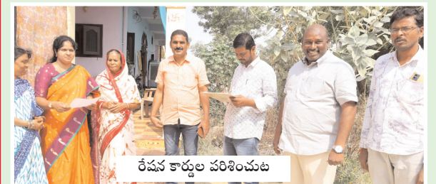
రేషన్ కార్డుల పరిశీలన