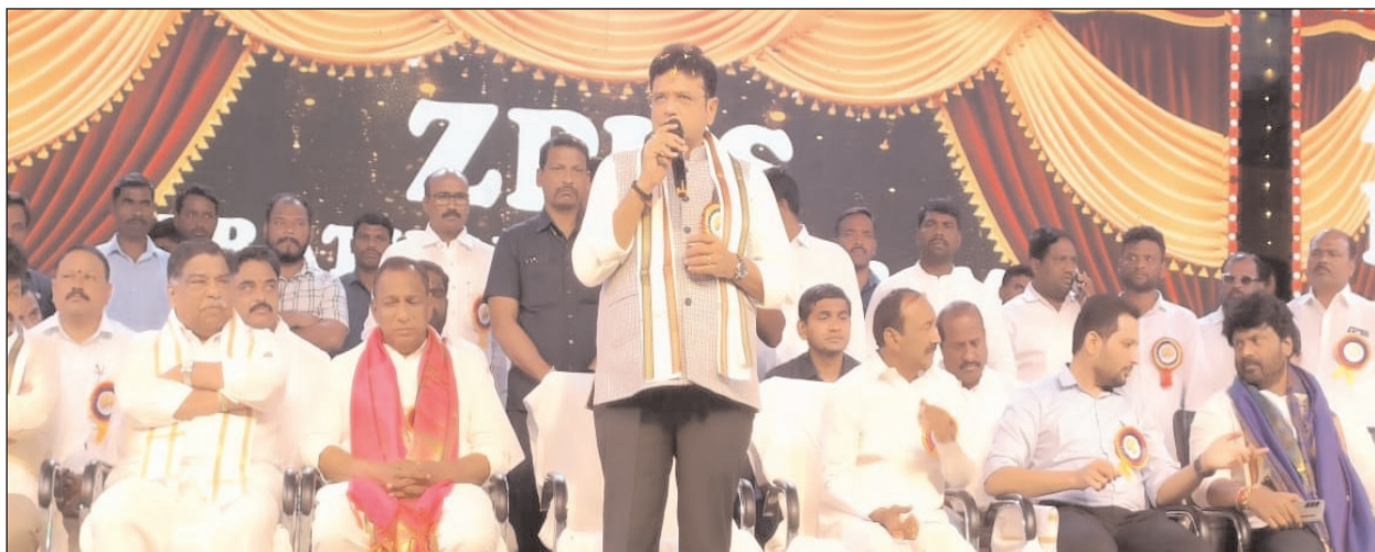
పాఠశాల వార్షికోత్సవంలో మాట్లాడుతున్న మంత్రి శ్రీధర్ బాబు.

ఐటీ శాసనసభ వ్యవహారాల శాఖ మంత్రి శ్రీధర్ బాబు