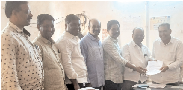
నోడల్ అధికారికి వినతిపత్రం అందజేస్తున్న టిపిజెఎంఎ జిల్లా కమిటీ.

● టిపిజెఎంఎ జిల్లా కమిటీ ● టిపిజెఎంఎ జిల్లా కమిటీ ఆధ్వర్యంలో నోడల్ అధికారికి వినతి