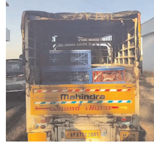
స్వాధీనం చేసుకున్న వాహనం.