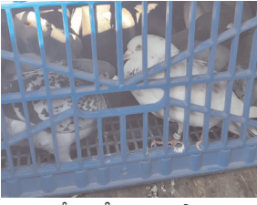
బాక్సులో బందిగా ఉన్న పావురాలు.