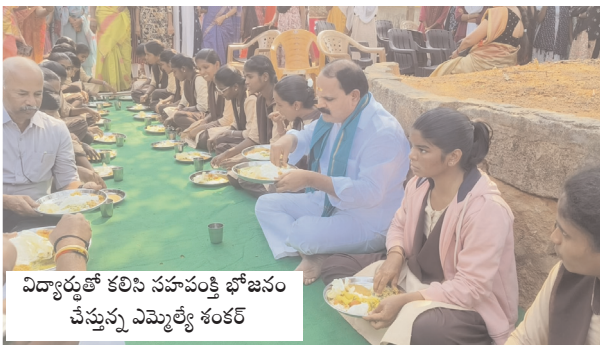
విద్యార్థులతో కలిసి సహపంక్తి భోజనం చేస్తున్న ఎమ్మెల్యే శంకర్

పేదరికంలో పుట్టి ఎన్నో కష్టాలు అనుభవించానని, చదువు కోసం కిలోమీటర్ల దూరం కాలినడకన ప్రయాణం చేసి చదువుకున్నాను కాబట్టి సమాజంలో తనకు ఒక గుర్తింపు వచ్చిందన్నారు. ప్రతి విద్యార్థి పేదరికాన్ని ఆలోచించకుండా కష్టపడి