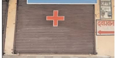
ధారూర్, మేజర్ న్యూస్ (జనవరి 07): తెలంగాణ మెడికల్ కౌన్సిల్ విజిలెన్స్ ఆఫీసర్ రాము ఇచ్చిన

ఫిర్యాదు మేరకు మంగళవారం ఐదుగురు ఆర్ఎంపీ డాక్టర్లపై కేసు నమోదు చేశారు. వివరాల్లోకి వెళితే... తెలంగాణ మెడికల్ కౌన్సిల్ విజిలెన్స్ ఆఫీసర్ రాము ఇచ్చిన ఫిర్యాదు ఏమనగా గతంలో మండల కేంద్రంలో మెడికల్ కౌన్సిల్ వారు ప్రవేట్ క్లినిక్ లను తనిఖీ చేసి మండల కేంద్రంలో మెడికల్ కౌన్సిల్ నిబంధనలకు విరుద్ధంగా సొంత ఆస్తులు నిర్వహిస్తూ, ఆర్ఎంపీలుగా వైద్య సలహాలు ఇవ్వాలి ఉండగా, అందుకు విరుద్ధంగా ఎంబిబిఎస్ డాక్టర్ల