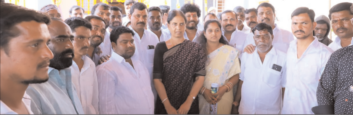
గ్రామ పంచాయితీ భవనాన్ని ప్రారంభిస్తున్న సబితా ఇంద్రారెడ్డి

పడమటి తండాలో పంచాయితీ భవనాన్ని ప్రారంభించిన ఎమ్మెల్యే సబితా ఇంద్రారెడ్డి