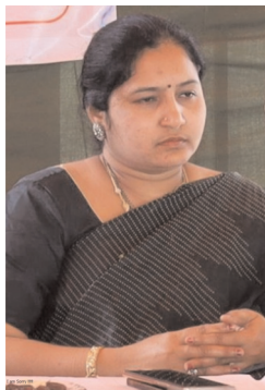
మున్సిపల్ ప్లాన్ ప్రకారం నిర్మాణాలు చేపట్టాలని కమిషనర్.