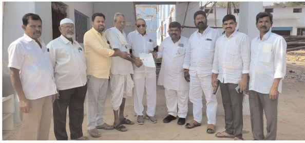
సీఎంఆర్ఎఫ్ చెక్కు అందిస్తున్న కాంగ్రెస్ నాయకులు.