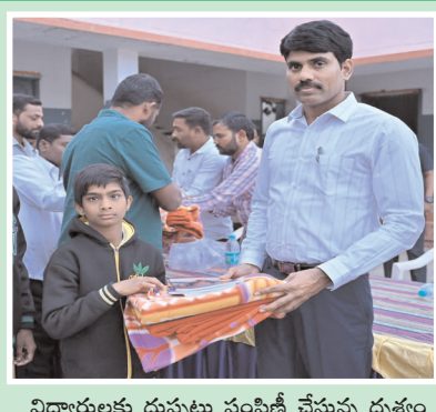
విద్యార్థులకు దుప్పట్లు పంపిణీ చేస్తున్న దృశ్యం