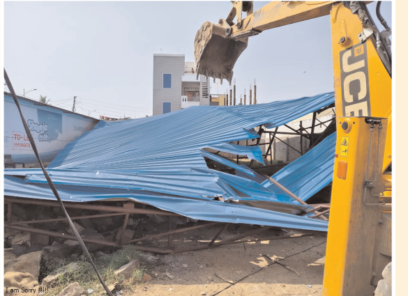
కమిషనర్ ఆదేశానుసారంతో కూల్చివేత

బడంగ్గేట్ నగర పాలక సంస్థ పరిధిలోని వివిధ కాలనీ వాసులు ప్రజలందరూ మునిసిపల్ అనుమతి తీసుకుని ప్లాను ప్రకారం నిర్మాణాలు చేపట్టాలని ఈ సందర్భంగా కమిషనర్ సరస్వతి కోరారు.