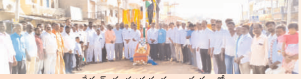
అంబేద్కర్ యువజన సంఘం ఆధ్వర్యంలో.