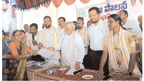
లబ్ధిదారులకు ప్రొసిడింగ్ ప్రతాలు అందజేస్తున్న దృశ్యం.