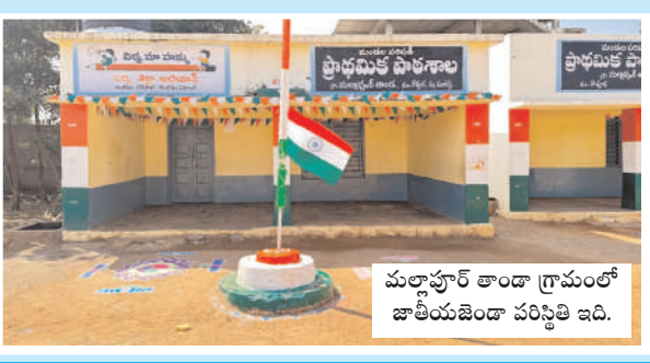
మల్లాపూర్ తాండా గ్రామంలో జాతీయ జెండా పరిస్థితి ఇది.

కొత్తూరు, మేజర్ న్యూస్ (జనవరి 26): రిపబ్లిక్ డే వేడుకల్లో గురువుల నిర్లక్ష్యం మూలంగా జాతీయ జెండాకు అవమానం జరిగింది. కొత్తూరు మండలంలోని మల్లాపూర్ తాండా గ్రామంలోని ప్రాథమిక పాఠశాల ఎదుట ఆదివారం జాతీయ జెండాను ఆవిష్కరించారు. జెండా ఆవిష్కరణలో సరైన జాగ్రత్తలు తీసుకోకపోవడంతో జెండా కాస్త సగం వరకు వచ్చి ఆగిపోయి దర్శనమిచ్చింది. జాతీయ జెండా అవగతం సరిగ్గానే జరిగిందని, ఎవరు లేని సమయంలో పిల్లలు ఆడుకుంటూ తాడు పట్టి లాగారని అధికారులు సమాధానం చెబుతుండటం గమనార్హం. ఈ విషయంలో జిల్లా ఉన్నతాధికారులు ఎలా స్పందనారో వేచి చూడాలి మరి.