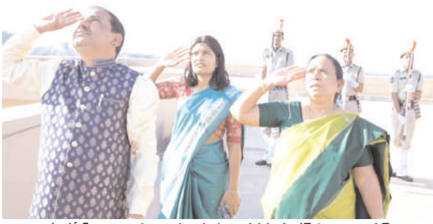
కలెక్టర్ డిపై జెండాను ఆవిష్కరిస్తున్న అదనపు కలెక్టర్ లింగాయక్