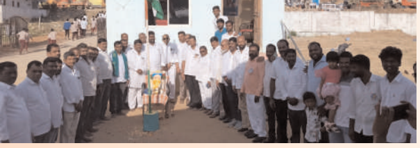
మార్కెట్ కమిటీ కార్యాలయంలో. కుల్చర్ల రూరల్, మేజర్ న్యూస్ (జనవరి 26) 76వ గణతంత్ర దినోత్సవ వేడుక