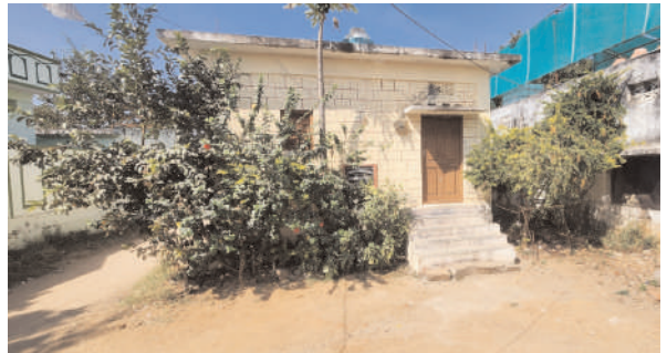
తాళం పేసి ఉన్న వ్యవసాయ శాఖ కార్యాలయం