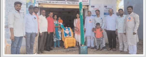
గణతంత్ర వేడుకలో పాల్గొన్న అంకిత సంస్థ సిబ్బంది.