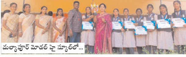
మల్కాపూర్ మోడల్ హై స్కూల్లో...