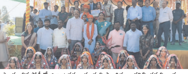
సాంస్కృతిక పోటీల్లో జిల్లా ఉత్తమ బహుమతి పొందిన బండవెల్లిచర్ల విద్యార్థులు.