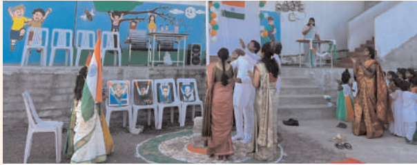
ఇండస్ వ్యాలీ పాఠశాలలో జాతీయ జెండాను ఆవిష్కరిస్తున్న యూత్ కాంగ్రెస్ జాతీయ కో ఆర్డినేటర్ యం.కృష్ణారాజు