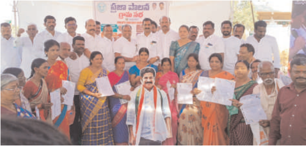
లబ్ధిదారులతో కలిసి ముఖ్యమంత్రి రేవంత్ రెడ్డి చిత్రపటానికి క్షీరాభిషేకం చేస్తున్న ఏఎస్ఐ చైర్మన్ నరసింహులు యాదవ్.