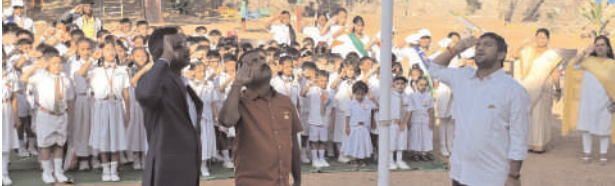
జాతీయ జెండాను ఆవిష్కరిస్తున్న ప్రిన్సిపాల్, ఉపాధ్యాయులు