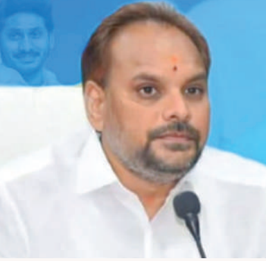
అనందపురం జనవరి 22 మేజర్ స్టూన్

మజ్జి శ్రీనివాసరావు భీమిలి అసింబ్లీ నియోజకవర్గ ఇంచార్జ్