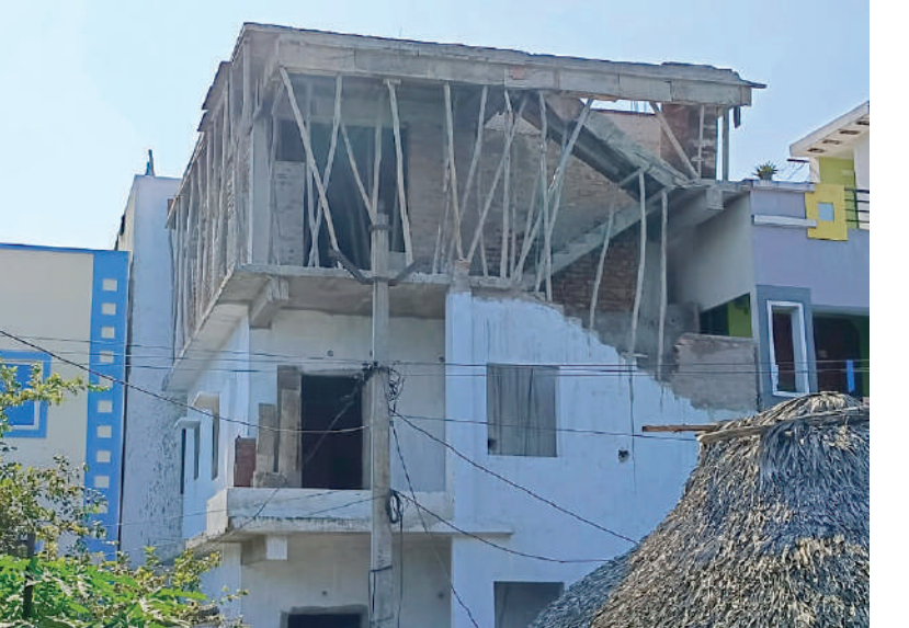
వార్డు పై దృష్టి సారించి తనకు, పార్టీకి చెడ్డపేరు తెస్తున్నారని పార్టీ నుంచి తొలగించాలని పలువురు కోరారు. అక్రమ అదనపు అంతస్తుల పై జీవీఎస్ కమిషనర్ చర్యలు చేపట్టాలని కోరారు.

జీవీఎస్, 13వ వార్డు శ్రీకృష్ణ పురం, సైనాపిల్ కాలనీ, దారపాలెం ప్రాంతంలో తెలుగు తమ్ముళ్ల హవా జోరుగా కొనసాగుతుంది. కొత్త ప్రభుత్వం ఏర్పాటు అయిన దగ్గర నుంచి విపరీతమైన అసంధికార అక్రమ నిర్మాణాలు చేపట్టడం మొదలయ్యింది. ఎక్కడ నిర్మాణం చేపట్టాలన్న తెలుగు తమ్ముళ్ల పర్మిషన్ లేకపోతే అక్రమ నిర్మాణాలు చేపట్టడం ఇబ్బందికరంగా మారుతుంది. ఒక్కొక్క నిర్మాణం బట్టి రేటును లక్షల్లో వసూలు చేస్తున్నారు. ఈ ప్రభుత్వం మాది హోలోమే మేమే అంటూ సచివాలయం సెక్రటరీలను బెదిరిస్తూ వాళ్లతో ముడుపులు అందుకుంటున్నట్లు సమాచారం. సైనాపిల్ కాలనీ లో ఓ వ్యక్తి ఆయన స్థలంలో ఒక చిన్న బాట్రూం కట్టుకుంటుండగా తెలుగు తమ్ముళ్లు మీడియా పేరు చెప్పి వేళ్లలో వసూలు చేసినట్లు సమాచారం. ఇదిలా ఉండగా శ్రీకృష్ణాపురం గిరిజన కాలనీ, క్యాంపెంట్ ప్రాంతం కావడంతో ప్రభుత్వం నిర్మాణాలకు ఆసుమతులు ఇవ్వలేదు. గిరిజన మంజుల అ ప్రాంతంలో నివాసం ఉండడంతో గిరిజనులు ఒక్కరు ఇద్దరు స్థాలో వరకు ఎమ్మెల్యే సహకారంతో నిర్మాణాలు చేపట్టారు. శ్రీకృష్ణ పురం రోడ్డుకు రెండ్ లైన్, ఎటువంటి పర్మిషన్ లేకుండా జీవీఎస్ గండి కొడుతూ పై అదనపు అంతస్తు కు ఓ టిడిపి కార్పొరేటర్ భర్త అందతో నిర్మించారు. ప్రతి ఒక్క నిర్మాణానికి స్థానిక ఎమ్మెల్యే పేరు వినయోగించుకోవడంపై నియోజకవర్గంలో ఉన్న మంచి పేరు, ప్రఖ్యాతిని తెలుగు తమ్ముళ్లు తీసివేస్తున్నారంటూ ఎమ్మెల్యే అభిమానులు ఆవేదన వ్యక్తం చేశారు. ఎమ్మెల్యే ఇప్పటికైనా 13వ