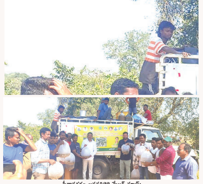
సీతానగరం జనవరి 22 మేజర్ న్యూస్:

శీతాకాల రుద్దలకు ఆయుర్వేదంతో ఉపశమనం : డాక్టర్ హేమాక్షి