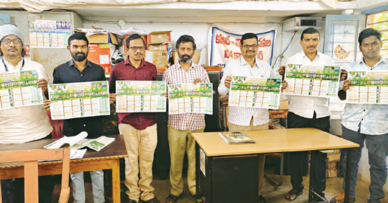
గురుగుమ్మి, జనవరి 21, మేజర్ న్యూస్: