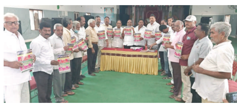
వెల్లిపర్తి, జనవరి 22, మేజర్ న్యూస్:

డిసిసిబి మాజీ వైస్ చైర్మన్ చనమల్లు వెల్లిడి