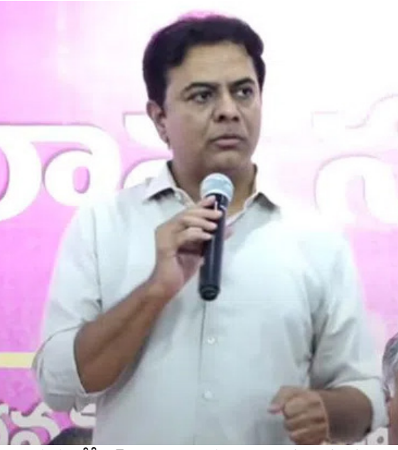
ఒక్కొక్కరం కేసీఆర్ లాగా కొట్లాడుదాం.. గ్రామగ్రామాని కథానాయకులను సృష్టిస్తాం. అద్భుతంగా ఈ ఏడాది పోరాట నామ సంవత్సరంగా ముందుకు పోదాం అని కేసీఆర్ గులాబీ శ్రేణులకు పిలుపునిచ్చారు.

గ్రామగ్రామాని కథానాయకులను సృష్టిస్తాం ఈ ఏడాది పోరాట నామ సంవత్సరంగా ముందుకు పోదామని బీఆర్ఎస్ పరిష్కారం ప్రెసిడెంట్ కేసీఆర్ గులాబీ శ్రేణులకు పిలుపునిచ్చారు. ఒక్కొక్కరం కేసీఆర్ లాగా కొట్లాడుదాం.. గ్రామగ్రామాని కథానాయకులను సృష్టిస్తాం అని పార్టీ కార్యకర్తలకు కేసీఆర్ సూచించారు. తెలంగాణ భవన్ లో బీఆర్ఎస్ పార్టీ డైరీ ఆవిష్కరణ సందర్భంగా కేసీఆర్ మాట్లాడారు. కేసీఆర్ స్పష్టమైన ఆలోచనతో ఉన్నారు. కొత్త కమిటీలు వేసుకోవాలి. సభ్యత్వ నమోదు కార్యక్రమం చేపట్టాలి. బాటే కమిటీ నుంచి గ్రామ, వార్డు, మండల, పట్టణ, జిల్లా, నియోజకవర్గ, అదే విధంగా రాష్ట్ర కమిటీలు వేసుకోవాలి. దాంతో పాటు కొత్త అభ్యుదయ కమాండో ఈ ఏడాది ఎంపిక చేసుకోవాలి. ఉంది. కార్యకర్తలకు శిక్షణ శిబిరాలు పెట్టుకుందాం. 32 జిల్లాల్లో పార్టీ ఆఫీసులను యాక్టివేట్ చేసుకుందాం. జిల్లాల్లోనే శిక్షణ కార్యక్రమాలు నిర్వహించుకుందాం. 60 లక్షల మంది సభ్యత్వం ఉన్న పార్టీ మనది. కుటుంబం లాగా ఈ పార్టీకి ఒకరికొకరు అండగా ఉంటూ కాపాడుకుందాం అని కేసీఆర్ పేర్కొన్నారు. తెలంగాణ ప్రయోజనాల కోసం పోరాడుదాం. తెలంగాణ కోసం పుట్టిన పార్టీ కాబట్టి తెలంగాణ ప్రయోజనాలే పరమాధికారి పని చేసే పార్టీ మనది. తెలంగాణలో ఇబ్బంది అనిపిస్తుందట.. ఉమ్మడి రాష్ట్రంలోనే బాగుండేనట అని ముఖ్యమంత్రికి అనిపిస్తుందట.. ఇది మన భార్య అందుకే తప్పకుండా వందకు వంద శాతం