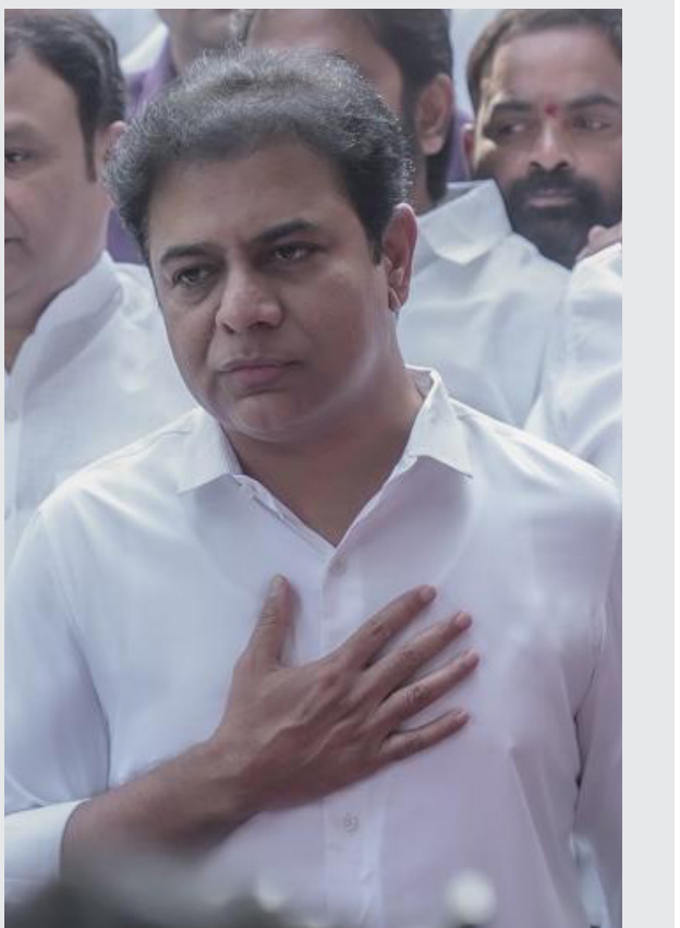
ముందు తల వంచను. తప్పకుండా కొట్లాడుతూనే ఉంటా. పోరాడుతూనే ఉండా. తెలంగాణ బయిం చేదాకా, కాంగ్రెస్ కబంధ హస్తాల్ నుంచి తెలంగాణ బయటకు వచ్చేదాకా కొట్లాడుతూనే ఉంటా.' అని కేటీఆర్ స్పష్టం చేశారు.