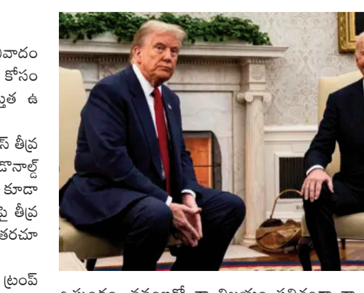
ఒప్పందం. సవంబర్లో నా విజయం ఫలితంగా నా కార్యకర్తల శాంతిని కోరుకుంటుందనే విషయాన్ని ప్రపంచం మొత్తానికి చాటింది. మొత్తం

క్రెడిట్ కోసం బైడెన్-ట్రంప్ పోటీ వాషింగ్టన్: గాజాలో శాంతి ఒప్పందం కుదరగా.. మరోచోట వివాదం మొదలైంది. ఆ ఒప్పందం కుదిరిన ఘనతను దక్కించుకోవడం కోసం ట్రంప్-బైడెన్ల మధ్య చూటల యుద్ధం మొదలైంది. దీనికి ప్రస్తుత ఉపాధ్యక్షుల కమలాహారిస్ కూడా తోడయ్యారు. తన ప్రమాణస్వీకారం నాటికి బంధీలను విడుదల చేయకపోతే హమాస్ తీవ్ర పరిణామాలు ఎదుర్కొంటుందని అమెరికాకు కాబోయే అధ్యక్షుడు డొనాల్డ్ ట్రంప్ కొన్నాళ్ల క్రితం ప్రకటించారు. మరోవైపు నెతన్యాహను కూడా వివిధంగా వీ. వీడియోను ఆయన పేర్ చేశారు. దీంతో ఇరుపార్టీలపై తీవ్ర ఒత్తిడి పెరిగింది. ఇక బైడెన్ కార్యకర్తలలోని అపోసనీ ఖ్లింకెన్ కూడా తరచూ ఇజ్రాయెల్ వెళ్లి చర్చలను ముందుకుతీసుకెళ్లారు. ఇజ్రాయెల్-హమాస్ మధ్య డిల్ కుదిరిన వార్తలు వచ్చిన వెంటనే ట్రంప్ సోషల్ మీడియా ట్రూట్స్ స్పందించారు. "ఇది చాలా గొప్ప కాల్పుల విరమణ