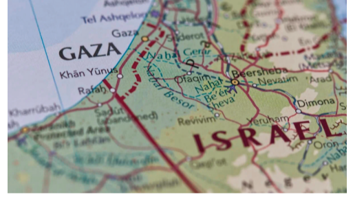
ఇజ్రాయెలీలను కిడ్నాప్ చేశారు. ఈ సందర్భంగా లెబనాన్ నుంచి కూడా ఇజ్రాయెల్ పై దాడులు జరిగాయి. ఇరాన్ మధ్యకు గల హిజ్బుల్లా గ్రూప్ లెబనాన్ నుంచి ఇజ్రాయెల్ పై దాడి చేసిందని ఆరోపించారు. ఇజ్రాయెల్ కూడా స్పందించింది. ఇంతలో ఇజ్రాయెల్ సైన్యం గాజాలోకి ప్రవేశించి హమాస్ను వెంబడించింది. వీటన్నింటి మధ్య ఇరాన్ కూడా ఇజ్రాయెల్ పై క్షిప్త దాడులు చేసింది. గత 15 నెలల్లో ఇజ్రాయెల్ దాడుల్లో దాదాపు 46,000 మంది పాలస్తీనియన్లు మరణించారు. గాజాలో మరణించిన పిల్లల సంఖ్య 13,319. లక్షా 10 వేల 265 మంది గాయపడ్డారు. గాజాలో దాదాపు 1.9 మిలియన్ల మంది నిరాశ్రయులయ్యారు. హమాస్ దాడుల్లో దాదాపు 2,000 మంది ఇజ్రాయెలీలు మరణించారు. వీరిలో 2023 అక్టోబర్ 7న ఇజ్రాయెల్లో దాదాపు 1,200 మంది చనిపోయారు. గాజాలో 251 మందిని బంధించి పట్టుకున్నారు. ఇంకా 101 మంది ఖైదీలు ఉన్నారు. వివిధ నివేదికల ప్రకారం ఇందులో 37 మంది చనిపోయి ఉంటారని భావిస్తున్నారు.

15 నెలల్లో దాదాపు 50,000 మరణాలు ఇరు పక్షాలు ఖైదీలను విడుదలకు ఒప్పందం గాజా నుంచి ఇజ్రాయెల్ బలగాలను ఉపసంహరణ సహాయక చర్యలకు అటంకం కలిగించడానికే నిర్ణయం గాజా : జనవరి 19 నుంచి కాల్పుల విరమణ అమల్లోకి రావచ్చని సమాచారం. తొలుత అరు వారాల పాటు కాల్పుల విరమణ కొనసాగుతుంది. గత 15 నెలల్లో జరిగిన యుద్ధంలో దాదాపు 50,000 మంది పాలస్తీనియన్లు, ఇజ్రాయెలీలు మరణించారు. దాదాపు 15 నెలలు గడిచాయి. దాదాపు 50 వేల మంది ప్రాణాలు కోల్పోయారు. కానీ ఎట్టకేలకు గాజాలో కాల్పుల విరమణ కుదిరింది. ఖతార్ లోని దోహాలో 96 గంటల చర్చల అనంతరం ఇజ్రాయెల్, హమాస్ కాల్పుల విరమణకు అంగీకరించాయి. జనవరి 19 నుంచి కాల్పుల విరమణ అమల్లోకి రావచ్చని సమాచారం. తొలుత అరు వారాల పాటు కాల్పుల విరమణ కొనసాగుతుంది. కాల్పుల విరమణ సమయంలో ఇరు పక్షాలు ఖైదీలను విడుదల చేయనున్నాయి. మరోవైపు అవహరణకు గురైన వారిని కూడా హమాస్ విడుదల చేయనుంది. మరోవైపు పౌరులను నివసిస్తున్న