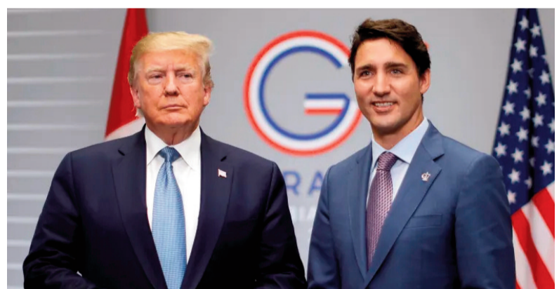
నిత్యం 3.6 బిలియన్ డాలర్లు విలువైన వస్తుసేవలు సరిహద్దులు దాటి వెళుతుంటాయి. ఇప్పటికే కెనడా ప్రభుత్వం సరిహద్దు భద్రతకు బిలియన్ డాలర్లు వెచ్చించాలని నిర్ణయించింది. ముఖ్యంగా మాదకద్రవ్యాలు, మానవ అక్రమ రవాణాను కట్టడి చేయడానికి ఈ మొత్తం వినియోగించనుంది. ట్రంప్ సోమవారం అమెరికా అధ్యక్షుడిగా ప్రమాణస్వీకారం చేయనున్నారు.