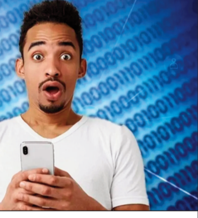
జరుగుతున్నాయి. నేటి కాలంలో మన దైనందిన జీవితం మొబైల్ ఫోన్పై ఆధారపడి ఉంది. దీని ద్వారా ట్రాన్స్మిక్షన్, పాసింగ్, ఇతర పనులను ఇంట్లో కూర్చోనే పూర్తి చేస్తున్నామని మొబైల్ ఫోన్ ప్రజల జీవితాలను ఎంత సులభతరం చేసిందో, అంతే సమస్యలను కూడా సృష్టించింది.

వాషింగ్టన్ : మొబైల్ ఫోన్ ప్రతి ఒక్కరికీ శరీరంలో ఓ భాగంగా మారిపోయింది. అది లేకుండా కనీసం ఓ బరు నిమిషాలు కూడా గడవదు. ఛార్జింగ్ అయిన వెంటనే ప్రాణం ఆగినంత పని అవుతుంది. దాని పేరు వినగానే అందరికీ ఒక రకమైన ఉపశమనం కలుగుతుంది. మొబైల్ సహాయంతో ఈ రోజుల్లో చాలా వసూలు చాలా వసూలు అవుతున్నాయి. నేటి కాలంలో మన దైనందిన జీవితం మొబైల్ ఫోన్పై ఆధారపడి ఉంది. దీని ద్వారా ట్రాన్స్మిక్షన్, పాసింగ్, ఇతర పనులను ఇంట్లో కూర్చోనే పూర్తి చేస్తున్నామని మొబైల్ ఫోన్ ప్రజల జీవితాలను ఎంత సులభతరం చేసిందో, అంతే సమస్యలను కూడా సృష్టించింది. ఇందులో అతిపెద్ద వ్యసనం మొబైల్ ఫోన్ వాడడం. కానీ నేటి కాలంలో మొబైల్ రింగ్ అయిన వెంటనే ప్రజలు భయపడిపోతారంటే మీరు నమ్ముతారా? కాదా? కానీ బ్రిటన్లో మొబైల్ ఫోన్ రింగ్ అవుతుందంటే దాని శబ్దం విని భయపడే యువకులు 25 లక్షలకు పైగా ఉన్నారు. ఏం అశ్రద్ధపోతున్నారో.. అవును ఈ వ్యాధిని కాలే ఆందోళన లేదా టెలిఫోనియా అంటారు. ఈ భయాన్ని తొలగించడానికి ఒక కోర్టు ప్రారంభించారు.