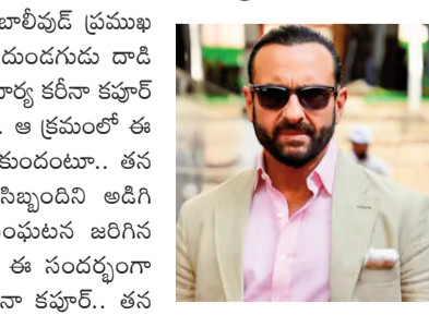
ముంబై, జనవరి 16: బాలీవుడ్ ప్రముఖ నటుడు సైఫ్ అలీఖాన్పై దుండగం దాడి చేసిన ఘటనతో ఆయన భార్య కరినా కపూర్ తీవ్ర ఆందోళన చెందారు. ఆ క్రమంలో ఈ ఘటన ఎలా చోటు చేసుకుందంటూ.. తన నివాసంలో పని చేసే సిబ్బందిని అడిగి తెలుసుకొన్నారు. ఈ సంఘటన జరిగిన తీరును కరినా కపూర్కు ఈ సందర్భంగా వారు వివరించారు. కరినా కపూర్, తన నివాసంలోని పని వారుతో మాట్లాడుతున్న ఓ వీడియో సోషల్ మీడియాలో వైరల్ గా మారింది. ఈ వాడి జరిగిన సమయంలో కరినా కపూర్ అక్కడే లేరు. ఈ దాడి ఘటనపై సమాచారం అందుకున్న అమె మాట్లాడుతున్నారని ఒక సర్వేలో తేలింది. అందుకంటే చేరుకున్నారు. ఈ ఘటనపై సైఫ్ అలీఖాన్, కరినా కపూర్ డిమ్మ స్పందించారు. ఇది ఊహించని పరిణామమని స్పష్టం చేశారు.

ఆందోళన లో కరినా కపూర్ ముంబై, జనవరి 16: బాలీవుడ్ ప్రముఖ నటుడు సైఫ్ అలీఖాన్పై దుండగం దాడి చేసిన ఘటనతో ఆయన భార్య కరినా కపూర్ తీవ్ర ఆందోళన చెందారు. ఆ క్రమంలో ఈ ఘటన ఎలా చోటు చేసుకుందంటూ.. తన నివాసంలో పని చేసే సిబ్బందిని అడిగి తెలుసుకొన్నారు. ఈ సంఘటన జరిగిన తీరును కరినా కపూర్కు ఈ సందర్భంగా వారు వివరించారు. కరినా కపూర్, తన నివాసంలోని పని వారుతో మాట్లాడుతున్న ఓ వీడియో సోషల్ మీడియాలో వైరల్ గా మారింది. ఈ వాడి జరిగిన సమయంలో కరినా కపూర్ అక్కడే లేరు. ఈ దాడి ఘటనపై సమాచారం అందుకున్న అమె మాట్లాడుతున్నారని ఒక సర్వేలో తేలింది. అందుకంటే చేరుకున్నారు. ఈ ఘటనపై సైఫ్ అలీఖాన్, కరినా కపూర్ డిమ్మ స్పందించారు. ఇది ఊహించని పరిణామమని స్పష్టం చేశారు.