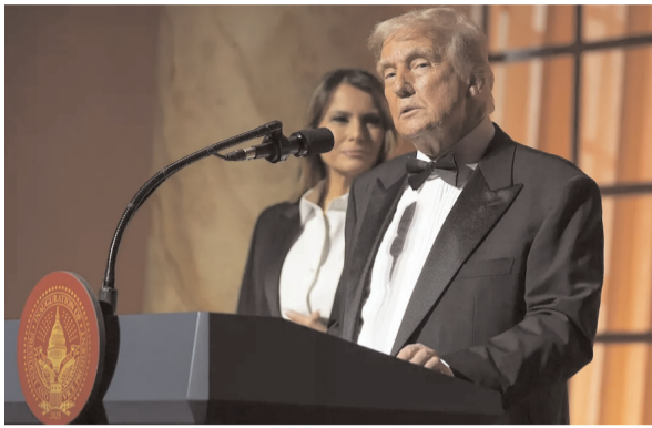
దీనిని 'ట్రంప్ ఏఫెక్ట్' అని పిలుస్తున్నారు. టిక్ టాక్ తిరిగి వచ్చింది. టిక్ టాక్ ను కాపాడుకోవాలి ఎందుకంటే మనం చాలా ఉద్యోగాలను కాపాడాలన్నారు. ట్రంప్ ప్రసంగంలోని 10 ముఖ్య విషయాల గురించి తెలుసుకుందాం. మధ్యప్రాచ్యంలో

గందరగోళాన్ని అంతం చేస్తామని, మూడవ ప్రపంచ యుద్ధం జరగకుండా నివారించాలని అన్నారు. అమెరికా నుండి అత్యున్నత వలసదారులను బహిష్కరిస్తూ, సరిహద్దులపై కఠినమైన నియంత్రణను విధిస్తామని, మా వ్యాపారాన్ని చైనాకు ఇవ్వడం ఇష్టం లేదు. చాలా ఉద్యోగాలను ఆదా చేయాలి. అమెరికాను మళ్ళీ గొప్పగా చేయాలి. అమెరికా బలాన్ని గర్హించి పునరుద్ధరించాలి. ఇజ్రాయెల్-హమాస్ కాల్పుల విరమణ అమెరికాకు చాలాతీవ్రత విజయం. ఈ ఒప్పందం మన వల్లే కుదిరింది. మేము టిక్ టాక్ ను ప్రేమిస్తున్నాము. దానిని కాపాడుకోవాలి. టిక్ టాక్ మళ్ళీ యుఎస్ లో ప్రారంభమైంది. అమెరికా టిక్ టాక్ లో 50 శాతం వాటాను కలిగి ఉండాలనే షరతుపై నేను టిక్ టాక్ ను ఆమోదించడానికి అంగీకరించానని ఆయన అన్నారు. మేము మా పాఠశాలల్లో దేశభక్తిని పునరుద్ధరించబోతున్నాం. రాడికల్ వామపక్షమాలను తరిమివేస్తాం. ఎన్నికల్లో తన విజయం గురించి ట్రంప్ మాట్లాడుతూ.. ఇది అమెరికా చరిత్రలో అతిపెద్ద రాజకీయ ఉద్యమం అని, 75 రోజుల క్రితం మన దేశంలో ఇప్పటివరకు అతిపెద్ద రాజకీయ విజయాన్ని సాధించామని అన్నారు. దీనికి ముందు ఎవరూ బహిష్కరించలేదు. జైళ్లు, మానసిక సంస్థలు, పురుషులు మహిళల క్రిడలు ఆడే విధానం, లింగమార్పిడి వ్యక్తుల గురించి కూడా ఆలోచించలేకపోయాడని ట్రంప్ అన్నారు.