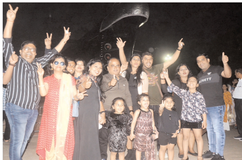
విశాఖపట్నం, డిసెంబర్ 31, మేజర్స్ సమన్వయం

బీచ్ రోడ్డుగా సందడే సందడి మిరుమిట్లుగొలిపే విద్యుత్ కాంతులతో మెరిసిన నగరం లేజర్ కాంతులతో తళుక్కుమన్న భామలు