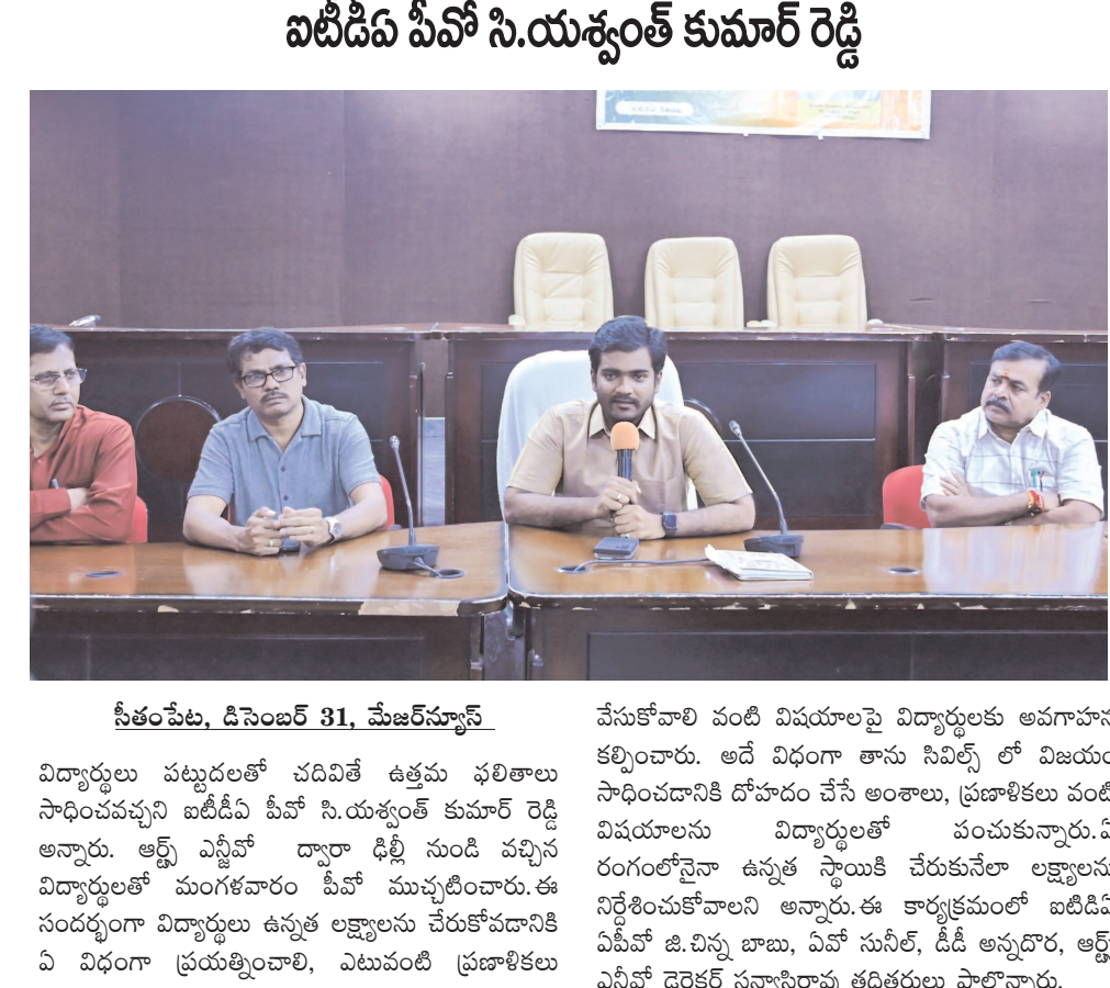
పీఠిపేట, డిసెంబర్ 31, మేజర్స్ సమన్వయం