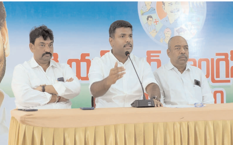
విశాఖపట్నం, జనవరి 1, మేజర్ న్యూస్