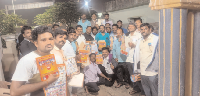
ఘనపాటిచేగ, జనవరి 1, మేజర్ న్యూస్