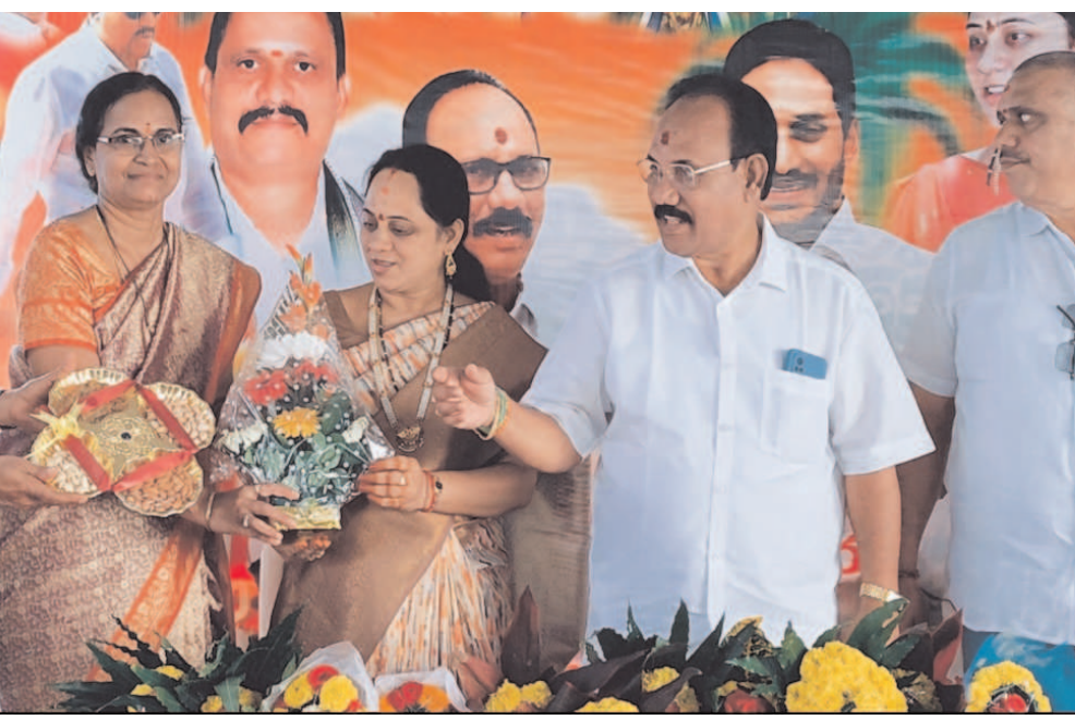
ఘనపాటిచేగ, జనవరి 1, మేజర్ న్యూస్