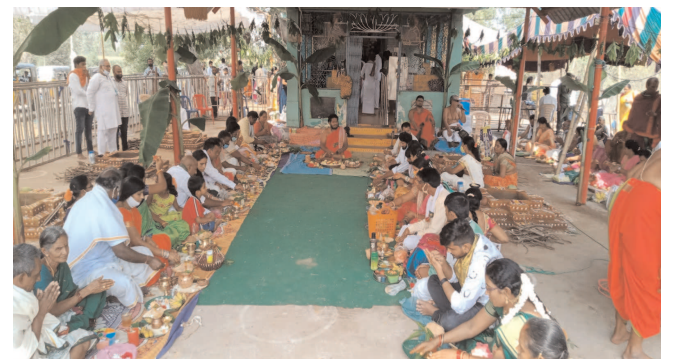
అడివిదునుగా శ్రీ పోలమాంబ అమ్మ వారి కల పిలుపు చదువారు. ఆ విధవనే మిగిలిన వారికి పిలుపు కార్డులు చేరుతాయి. అంతేకాదు అరుగులం కట్టడం రైతులు ఇంటికి తొలి పంట చేరే ముందు అమ్మ వారి సన్నిధికి చేరుదం ఈ ప్రాంతం రైతులకు ఆననాటి.

మక్కువ, జనవరి 1, మేజర్ న్యూస్ :- ఉత్తరాంధ్రలో ప్రత్యేక గాంచిన శంబర శ్రీ పోలమాంబ అమ్మవారు నామస్కరణం జపిస్తే సర్వపాపాలు హరిస్తాయని ఈ ప్రాంత భక్తుల నమ్మకం. గిరిజన ఆదరణను పొందిన శ్రీ పోలమాంబ అమ్మవారు అనేక మహిళా భక్తులకు మరీత ప్రీతి. శ్రీ పోలమాంబ అమ్మవారి నామస్కరణం చేసిన పిదపనే ఈ ప్రాంతీయులు ఏ ఏ పనినైనా తలపెడతారు. ఈ ప్రాంతీయుల ఇంటికి శుభకార్యం జరిగిన శ్రీ పోలమాంబ అమ్మవారి సన్నిధికి వెళ్లి తమ ఇంటి తలపెట్టిన శుభకార్యాల విజయవంతం చేయాలని కోరుకుంటారు. అంతేకాదు ఈ ప్రాంతీయులు పొంది పనులకు వెళ్లే ముందు కూడా అమ్మవారి ఆలయం ముందు వారు కాళ్ళకు ధరించిన పాదరక్షలను తీసి అమ్మ నామస్కరణం చేస్తారు. శంబర గ్రామస్థులతో పాటు చుట్టుపక్కల గ్రామ ప్రజలు, గ్రామం విడిచి బయటకు వెళ్తున్నప్పుడు అమ్మ సన్నిధిలో నిలబడి తమ పనులను జయప్రదం చేసి, తిరిగి తమను సుఖంగా తమ గ్రామాలకు చేర్చాలని కోరుకుంటారు. అమ్మ నామస్కరణం ఏ పని తలపెట్టిన అది జయప్రదం అవుతుందని ఇక్కడ ప్రజల ప్రతీతి. ఈ ప్రాంతీయుల ఇంటికి జరిగిన వివాహ, శుభకార్యం వేడుకలకు, తమ ఇంట