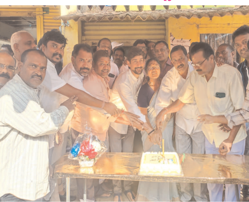
కురుపా, జనవరి 1, మేజర్ న్యూస్