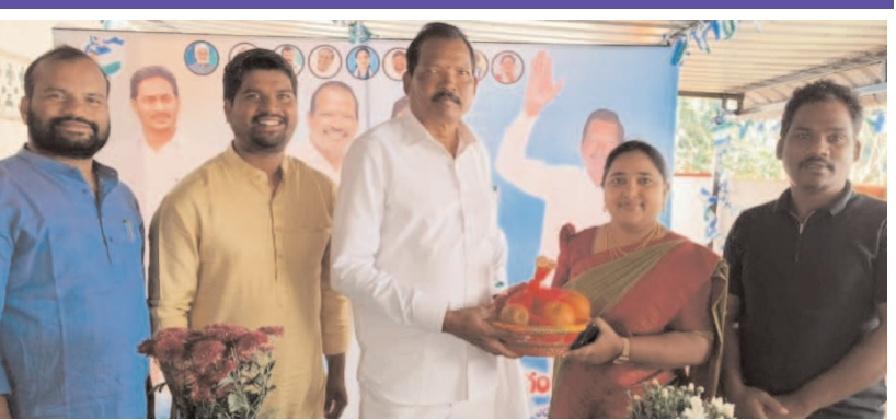
ఎమ్మెల్యేకు శుభాకాంక్షలు తెలుపుతున్న జెడ్పీసీ

అరకులోయ, జనవరి 1, మేజర్ న్యూస్: ఆంధ్రా ఊటీగా పేరొందిన అంద చందాల అరకులోయలో నూతన సంవత్సర వేడుకలను రాజకీయ పార్టీల నాయకులు, గిరిజన ప్రజాప్రతినిధులు, ప్రభుత్వ ఉద్యోగి, ఉపాధ్యాయులు, విద్యార్థులు, వ్యాపారులు, గిరిజనులు, పర్యాటకులు ఆనందోత్సాహంతో ఘనంగా జరుపుకున్నారు. ప్రభుత్వ కార్యాలయాల్లో ఉద్యోగులు, పార్టీల కార్యాలయాల్లో రాజకీయ నాయకులు, విద్యాసంస్థల్లో మండల విద్యాశాఖ అధికారులు, ఉపాధ్యాయులు, విద్యార్థులు, పర్యాటక కేంద్రాల్లో సందర్శకులు, గ్రామాల్లో గిరిజనులు న్యూ ఇయర్ వేడుకలను ఘనంగా నిర్వహించారు. నూతన సంవత్సర వేడుకలు జరుపుకొని ఒకరికొకరు శుభాకాంక్షలు తెలుపుకున్నారు. ఈ వేడుకలను పర్యాటక ప్రదేశాల్లో జరుపుకోవాలని ఉద్దేశంతో కుటుంబ సభ్యులు, మిత్రులు, సహచర ఉద్యోగులతో కలిసి అరకులోయకు తరలి రావడంతో ఈ ప్రాంతం రద్దీగా మారింది. 2024 సంవత్సరం ముగింపు సందర్భంగా వివిధ ప్రాంతాలకు చెందిన వారు ఇక్కడికి ఆసక్తితో రావడంతో అరకులోయలో న్యూ ఇయర్ జోష్ కనిపించింది. ఈ నేపథ్యంలో పర్యాటక కేంద్రాలకు కిక్కిరిసిపోయింది. రిసార్ట్స్, టెంట్లు పర్యాటకులతో నిండి పోయాయి. స్థానిక గిరిజన సంస్కృతి ముఖ్యమంత్రి ప్రాంతంలోని మల్ల కాయమ్మ సాంస్కృతిక కళావేదికలో బిడీ ఆధ్వర్యంలో న్యూ ఇయర్ సు పురస్కరించుకొని సాంస్కృతిక కార్యక్రమాలు నిర్వహించారు. స్థానికులు పర్యాటకులు ఈ కార్యక్రమాలు తిలకిస్తూ ఎంతో ఆసక్తిగా వచ్చారు. స్థానిక ఎమ్మెల్యే రేగం, మత్స్యలింగం, ఏపీ ఆన్లైన్ విజయనగరం జోన్ చైర్మన్ సివే. దొమ్మిరె, పెదబెజుడు మేజర్ పంచాయతీ సర్పంచ్ పెద్ది, దాసుబాబులకు