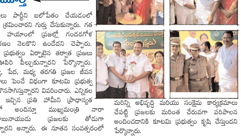
మరిన్ని అభివృద్ధి మరియు సంక్షేమ కార్యక్రమాల చేపట్టి ప్రజలకు మరింత చేరువగా పరిపాలన అందించడానికి కూటమి ప్రభుత్వం కృషి చేస్తుంది అన్నారు. ఈ నూతన సంవత్సరంలో