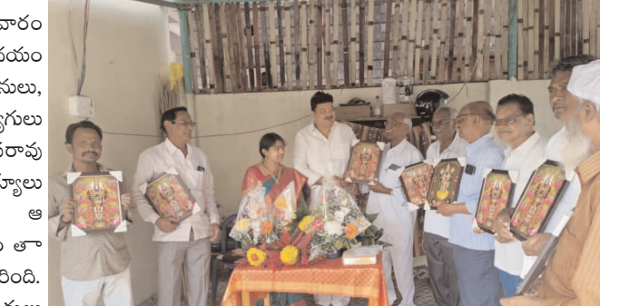
అభిమానులకు నూతన సంవత్సరంలో అంతా శుభాలు కలగాలని, ఆధ్యాత్మిక చింతన కలిగి ఉండాలని ఆకాంక్షిస్తూ వచ్చిన వారందరికీ వెంకటేశ్వర స్వామి చిత్రపటాలను అందజేశారు.

నాగ మాధవ నూతన సంవత్సర వేడుకలను బుద్ధవారం ఘనంగా నిర్వహించారు. ఎమ్మెల్యేను కలిసేందుకు నియోజకవర్గానికి చెందిన పార్టీ అభిమానులు, కార్యకర్తలు, నాయకులు, ప్రజాప్రతినిధులు, ఉద్యోగి ఉపాధ్యాయులు సిబ్బంది కుక్కలు కట్టారు. ఎమ్మెల్యేను కలిసే వారితో అత్యధిక మంది భోజిలు, సాంబారులు బదులు పుస్తకాలు, పెన్సిలు పెన్సిల్స్ తీసుకొని వచ్చి ఎమ్మెల్యే కి అందించి నూతన సంవత్సర శుభాకాంక్షలు తెలిపారు. నూతన ఏడాదిలో అంతా మంచి జరగాలని, గ్రామీణ ప్రాంతాల్లో అభివృద్ధి కార్యక్రమాలు, ఉపాధి అవకాశాల కల్పించే విధంగా కృషి