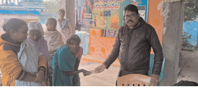
బాదగి, జనవరి 1, మేజర్ న్యూస్