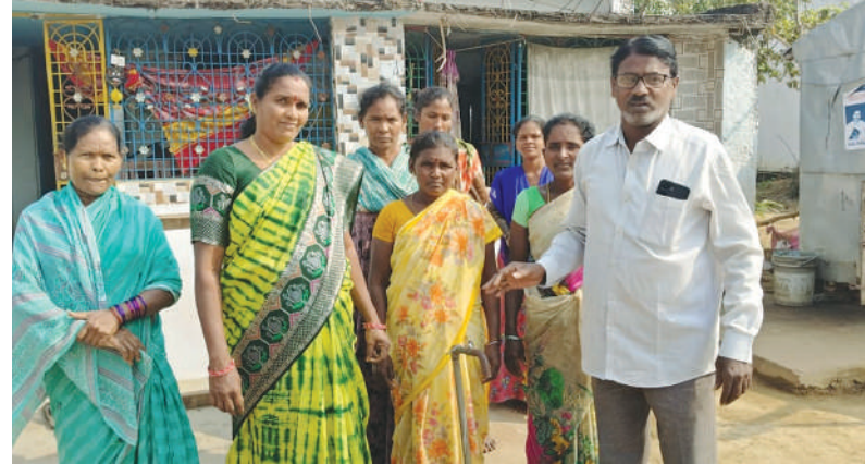
సంక్రాంతి పండుగలో అవ్వలు పోటీ:

పార్లమెంటులో రూరల్ జనవరి 16 ( మేజర్ స్టాన్స్): మండలంలోని డోకి సేల గిరిజన గ్రామాల్లో దాహం కేకలు రాజ్యమేలుతున్నాయి. వంచాయతీ పరిధిలో గల అనుబంధ గ్రామాల్లో పూర్తిస్థాయిలో త్రాగునీరు అందక ఆయా గ్రామ గిరిజనులు ఇబ్బందులు పడుతున్నారు. సంక్రాంతి పండుగకు కుటుంబ సభ్యులు సమీప చుట్టూలందరూ గ్రామంలోకి వచ్చినప్పటికీ పూర్తిస్థాయిలో మంచినీరు సరఫరా కాకపోవడంతో గ్రామస్థులు రోడ్డు ఎక్కారు. బుచ్చింపేట గ్రామంలోనైతే త్రాగునీరు సరఫరా కి సంబంధించి కొరాయిలు ఏర్పాటు చేశారు తప్ప ఒక్కరోజు కూడా నీరు రావడంలేదని మహిళలు అంటున్నారు. గతంలో వైసిపి పాలన ఉన్నప్పుడు నెలకొకసారి ముచ్చటగా త్రాగునీరు సరఫరా చేసే వారిని నేడు రాష్ట్రంలో కూటమి ఏర్పడక కనీసం కూడా మీరు రావడం లేదని మహిళలు ఆవేదన వ్యక్తం చేస్తున్నారు కలుస్తే నీరు తాగి రోగాల బారిన పడుతున్నామని ముఖ్యంగా వృద్ధులకు చిన్న పిల్లలకు మోకాళ్ల నొప్పిలు వస్తున్నాయని వివ జ్యూల ప్రజలు అంటున్నారు, గ్రామానికి ప్రభుత్వం ఏర్పాటు చేసిన కొరాయి గొట్టాలు డిస్టిబ్యూషన్ మారాయి తప్ప మళ్ళీ నీరు ఇవ్వడం లేదని ప్రజా సంఘాల నాయకులు పి. సంఘం అంటున్నారు. గతంలో కూడా ఈ విషయాన్ని ఆర్డర్లు అధికారుల దృష్టికి తీసుకెళ్లమని, దీనిపై సంబంధిత అధికారులు దృష్టి సారించి సమస్య పరిష్కరించకపోతే ఆందోళన చేస్తామని హెచ్చరిస్తున్నారు. దీనిపై ఆర్డర్లు జీవనరాజు వివరణ కోరగా బుచ్చింపేట విషయం తమ దృష్టిలో ఉందని గతంలో సాంకేతిక లోపం వల్ల గ్రామంలో గల పలు పీఠులకు నీరు రావడంలేదని ప్రస్తుతం ఈ సమస్య పరిష్కారానికి శాఖ పరంగా చర్యలు తీసుకుంటున్నామన్నారు.