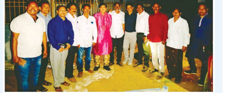
గురుబిల్లి, జనవరి 16, మేజర్ స్టాన్స్: