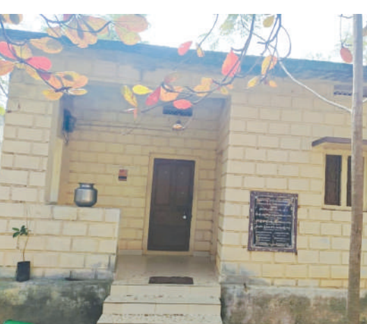
నెల్లూరు, జనవరి 16, మేజర్ స్టాన్స్:

-తెరుచుకోని హౌసింగ్ కార్యాలయం- వెనుదిరిగిన లబ్ధిదారులు