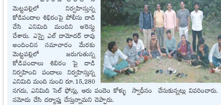
వీరుతుపల్లి జనవరి 16 మేజర్ స్టూన్స్ :

వం డ ల లో ని మెట్లపల్లిలో నిర్వహిస్తున్న కోడిపందాల శిబిరంపై పోలీసు డా. చేసి ఎనిమిది మందిని అరెస్టు చేశారు. ఎన్నో ఎల్ డామెడర్ రావు అందించిన సమాచారం మేరకు మెట్లపల్లిలో జరుగుతున్న కోడిపందాలు శిబిరం పై డా. ఎనిమిది మందిని అరెస్టు చేసి వినిమిది మందిని సుందీ రూ. 15,280 నగదు, ఎనిమిది సెల్ ఫోన్లు, ఆరు పందిం కోళ్ళు స్వాధీనం చేసుకున్నట్లు వివరించారు. కేసు నమోదు చేసి దర్యాప్తు చేస్తున్నామని చెప్పారు.