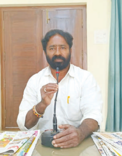
విజయనగరం జిల్లా, మేజర్ స్టూన్ :