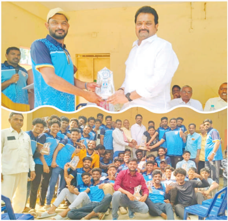
గరుగుబిల్లి, జనవరి 16, మేజర్ స్టూన్స్.