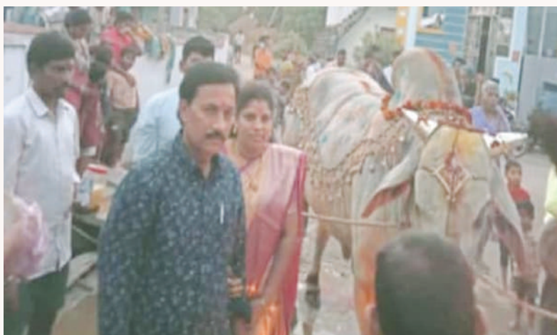
వేపాడ, మేజర్ స్టాన్స్: