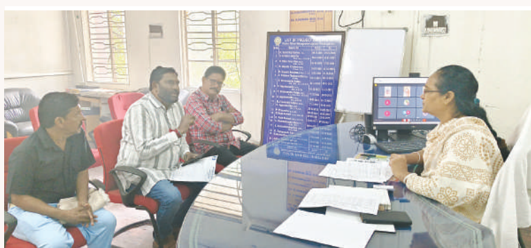
విజయనగరం టౌన్, మేజర్ స్టాన్స్ :