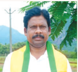
జనవరి 16, గుమ్మలకీపురం (మేజర్ స్టాన్స్)

బి.జె.పి ఎస్.టి మార్గ జిల్లా అధ్యక్షులు నిమ్మక సింహాచలం