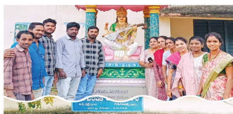
గరుగుబిల్లి, జనవరి 16, మేజర్ స్టూన్స్:

గతశత్రువులను నెమరు వేసుకున్న పూర్వ విద్యార్థులు సంక్రాంతి వరకు సందర్భంగా పూర్వ విద్యార్థులు అపూర్వకలయిక