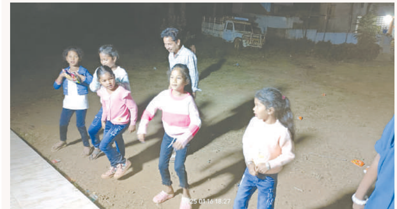
దుంట్రిగుడ, జనవరి, 16 మేజర్ స్టూన్:-

సంక్రాంతి పండగ ఉత్సవాలను మండలంలోని గిరిజన గ్రామాల్లో గిరిజనులు ఘనంగా నిర్వహించుకుంటున్నారు. ఈ సందర్భంగా గిరిజన సంప్రదాయమైన దింసా నృత్యాలను ప్రదర్శిస్తూ గిరిజనులు అనందంగా జరుపుకుంటున్నారు. షేర్ బుడియా, సోలోరి నృత్యాలను ప్రదర్శిస్తూ ఇంటింటికి చందాలను వసూలు చేస్తూ గిరిజనులు ఘనంగా జరుపుకున్నారు. స్థానిక మండల కేంద్రంలో అల్లారి యాత్ ఆధ్వర్యంలో గత మూడు రోజుల నుంచి దింస నృత్యాలు, ఆటపాటలతో ఘనంగా నిర్వహిస్తున్నారు.