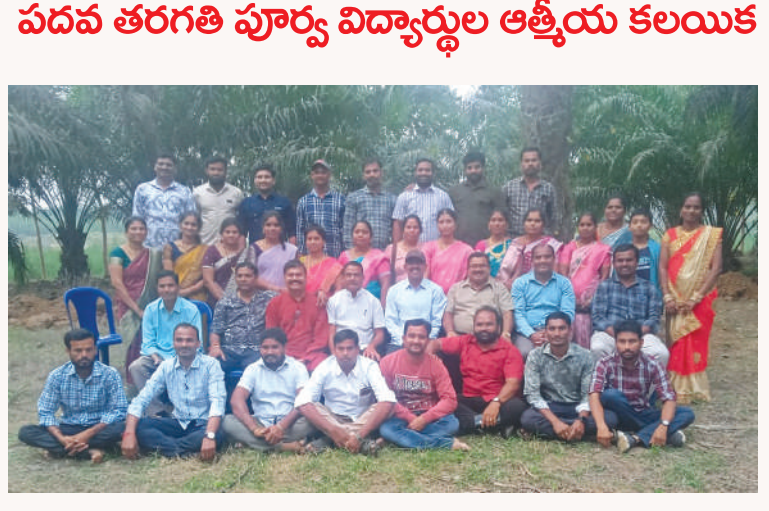
గొలుగొండ మేజర్ స్టూన్స్

పదవ తరగతి పూర్వ విద్యార్థుల ఆత్మీయ కలయిక