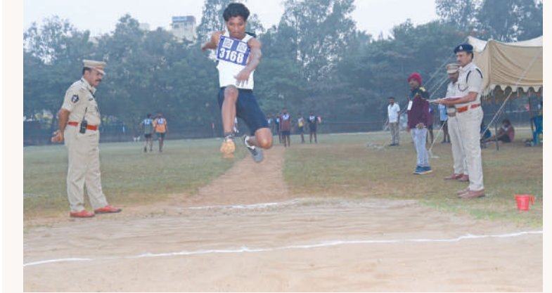
విజయనగరం జిల్లా, మేజర్ స్టూన్ :