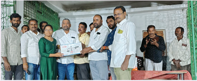
మునగపాక జనవరి 19 మేజర్ న్యూస్