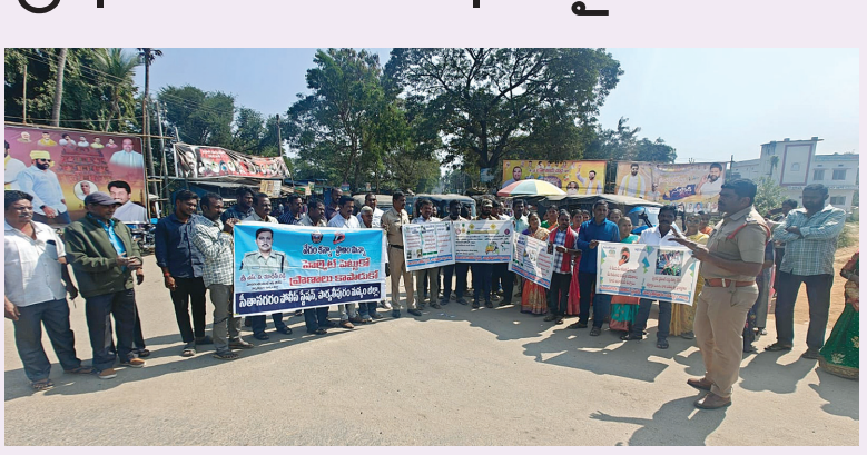
సీతానగరం జనవరి 19 మేజర్ న్యూస్.....