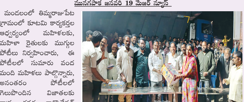
మునగపాక జనవరి 19 మేజర్ న్యూస్