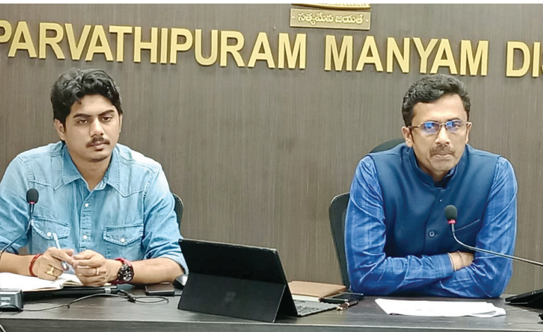
పార్వతీపురం, జనవరి 19, మేజర్ న్యూస్ :