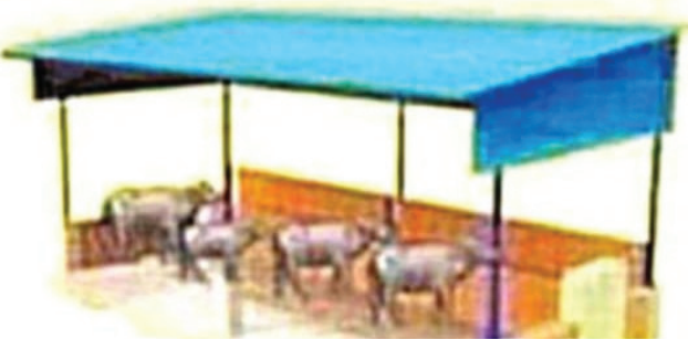
మెరకముడిదాం జనవరి 19 న్యూస్ మేజర్

మెరకముడిదాం జనవరి 19 న్యూస్ మేజర్ అధికార పార్టీ నాయకుల హుకుం తో గోశాలల మంజూరిలో మరలా లొబ్బి మొదలైంది. అక్టోబరు 14 న మొదలైన ఈ లొబ్బి కొనసాగుతూనే ఉంది. దీంతో అధికారుల గుండెల్లో రైళ్ళు పరుగెడుతున్నాయి. మండల పశు సంవర్ధకశాఖ, ఉపాధి హామీ అధికారులు గిలా, గిలా కొట్టుకుంటున్నారు. గోశాలల మంజూరు వ్యవహారంలో ముందు నుయ్యి, వెనుక గొయ్యి లా అధికారులు పరిస్థితి తయారైంది. గోశాలలకు రూల్స్ ను పక్కన పెట్టి అనుమతులు, ఉన్నా, లేకున్నా మంజూరు ఇచ్చి గ్రాండ్డింగ్ చేసేయాలిందేనని ఒక పక్క అధికార పార్టీ నాయకుల అధికారులకు హెచ్చరికలు జారీ చేస్తున్నట్లు సమాచారం. అనుమతులు, గినుమతులు జాతా సహా! పని చేస్తావా! పోతావా! అన్న దోరణతో వ్యవహరిస్తున్న అధికార పార్టీ నాయకులు తీరుతో గత్యంతరం లేని పరిస్థితిలో పశు సంవర్ధకశాఖ అధికారి పూర్తి స్థాయిలో దాక్కుమొట్టలు లేకుండానే, వచ్చిన దరఖాస్తులను పరిశీలించి ఉపాధి