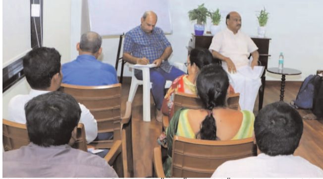
సంఘాలను ఆర్థికంగా అభివృద్ధి చెందేలా తీర్చిదిద్దడమే లక్ష్యంగా సూచనలు ఇచ్చారు. ఈ సమావేశం లో వెలుగు ఏరియం కో ఆర్డినేటర్, ఏ పి ఎమ్ లు, నాలుగు మండలాల ఎస్ బి ఐ బ్యాంక్ ట్రాంట్ మేనేజర్లు తదితరులు పాల్గొన్నారు.

సర్పిపట్నం జనపరి 3 మేజర్ సూర్య: వెలుగు డిపార్ట్మెంట్ మరియు బ్యాంకర్స్ తో స్పీకర్ క్యాంప్ కార్యాలయంలో స్పీకర్ చింతకాయల అయ్యన్నపాత్రుడు గారు సమీక్ష సమావేశం నిర్వహించారు. ఈ సమావేశంలో ద్వారా గ్రామీణులు సభ్యులు తీసుకుంటున్న రుణాలు వారికి ఎంతవరకు ఉపయోగకరంగా ఉంటున్నాయో వారిని ప్రశ్నించారు. మహిళలను ఆర్థికవేత్తలుగా తీర్చిదిద్దాలనే ఉద్దేశంతో ప్రణాళికలు రూపొందించాలని సూచించారు. నియోజవర్గంలోని మండలాల్లో ఎన్ని గ్రామీణులు ఉన్నాయో, వారు తీసుకున్న రుణాలు సక్రమంగా చెల్లిస్తున్నారా అని బ్యాంకర్స్ ను అడిగి తెలుసుకున్నారు. గ్రామ సభ్యులు తీసుకున్న రుణాలు వారికి ఆదాయం వచ్చేలా చిన్న తరహా పరిశ్రమలు పెట్టడానికి ప్రోత్సహించాలని అన్నారు. సభ్యులకు సబ్సిడీ, షాంపులు, క్యాండిట్స్, పసుపు పొడి వంటి వివిధ ఉత్పత్తుల తయారీపై శిక్షణ తరగతులు ఏర్పాటు చేయాలని సూచించారు. ఆ పరిశ్రమలలో తయారీచేసిన వస్తువులను ట్రాండింగ్ చేసి, ఆన్లైన్ ద్వారా మరియు సూపర్ మార్కెట్లలో అమ్మే విధంగా ప్రోత్సాహం అందించాలని అన్నారు. వెలుగు డిపార్ట్మెంట్ బ్యాంకర్ల సమన్వయంతో ద్వారా గ్రామ