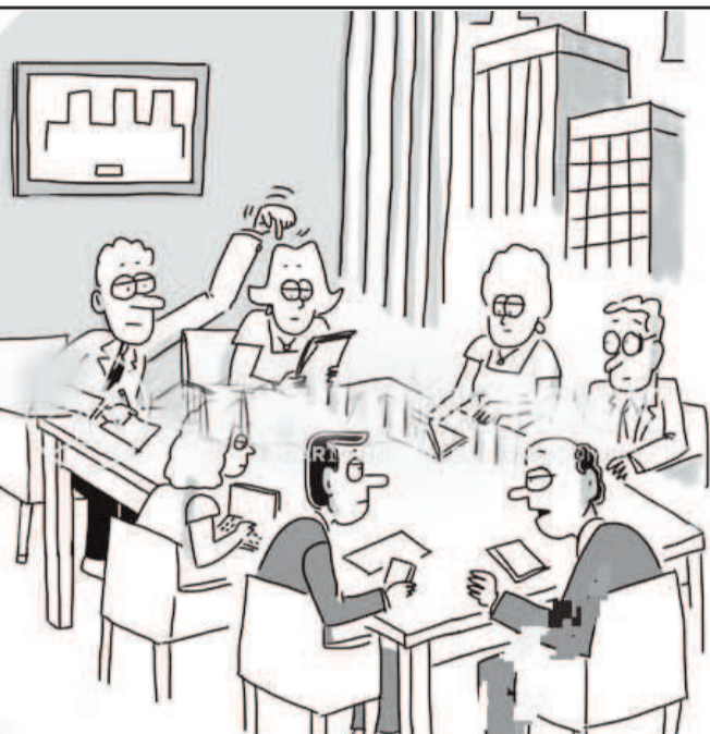
బట్ట బయలై పోయింది. ఇలాంటి పనులు చేస్తున్న వీరితో వేగడం కన్నా మనసు చంపుకొని టిడిపిలో కొనసాగడం అవసరమా ! అంటూ మరి కొందరు జనాంగం విమర్శలకు దిగుతున్నారు. భయంకో, భక్తికో ప్రస్తుతం

మెరకముడిదాం జనపరి 3 మేజర్ సూర్య: అదేబో గాని అందరిది ఒకదారి ఒకటి పట్టి ఒక దారి అన్నట్లుగా ఉంటాయి మెరకముడిదాం టిడిపి రాజకీయాలు. గతంలో వైయస్సార్ కాంగ్రెస్ పార్టీ ఇదే పంధాను అవలంబించి మండలంలో ఘోరపరాజయం పాలయ్యింది. అయితే అదే పరిస్థితి మండలంలో తెలుగుదేశం పార్టీ కోరి తెచ్చుకునే పరిస్థితి వచ్చింది. ఆ పార్టీలో సీనియర్లకు విలువలు లేవు. అప్పుడు వచ్చిన వారికి అడ్డుగమ్మి అన్నట్లుగా పాలకులు వ్యవహారం చేసి అందరి ఆరోపణలు ఉన్నాయి. ప్రస్తుతం వైఎస్ఆర్ పార్టీ వీలన్నిటిని కేసీ చేసు కుంటున్నట్లు సమాచారం. ఇదే క్రమంలో వైఎస్ఆర్ పార్టీ గతంలో చేసిన తప్పులను తెలుసుకొని పార్టీ బలోపేతానికి కృషి చేస్తుందగా, టిడిపి లో మాత్రం కొలువుల కొట్లాట మొదలైంది. గతంలో టిడిపి లో ఇటువంటి చేదు అనుభవాలు ఉన్నా, అవి పరిమితంగానే వెళ్లాయి. అందరి మాట చెబుతామని అయ్యింది. ఎవరు అవునన్నా! కాదన్నా! పాలకులతో త్రిమూర్తులు కూర్చోని, ఆ త్రిమూర్తుల మాటే ఇప్పుడు చెబుతామని అవుతోందని కేదర్లు తెలిసిపోయింది. కనీసం ఒక పంచాయతీ సర్పంచ్ కు కూడా విలువ లేకుండా పోయింది. వారి సిఫార్సులను పక్కన పెట్టేయడమే ఇందుకు తారాణం. ఇద్దరు ముగ్గురు చెప్పిందే వేదంలా భావిస్తున్నారు. ఇందుకు ఉదాహరణగా చెప్పాలంటే త్రిమూర్తులుగా పిలవ బడ్డ వీరు ముందు రోజు అధినాయకత్వం ను కలిసి ఆ మరునటి రోజు ఏమీ తెలియనట్లుగా మరునటి రోజు అధిష్టానం ఆమోదం కోసం అందరిని వెంటబెట్టాలని వెళుతుంటారు. మండలంలో నాలుగు సాసైటీలకు పేర్లను ఎంపిక చేసిన విధానమే ఉదాహరణగా చెప్పవచ్చు. మరునటి రోజు ఏమీ తెలియనట్లు కలరింగ్ ఇవ్వడమే తోనే పాలకులు అసలు విషయం