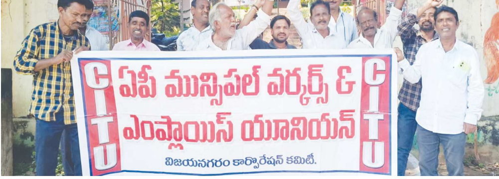
విజయనగరం కార్పొరేషన్ కమిటీ.