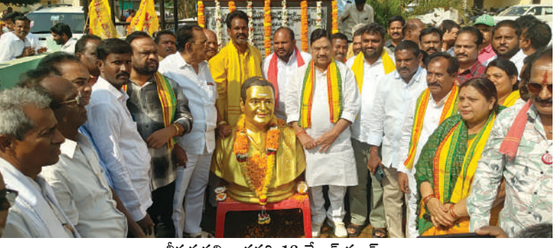
చీపురుపల్లి, జనవరి 18 మేజర్ స్టూన్: