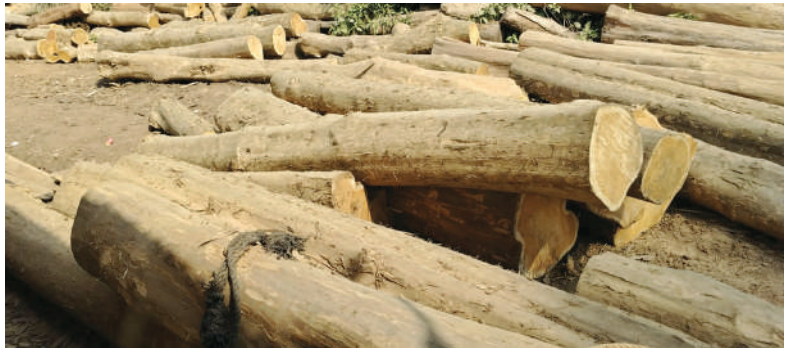
పార్వతీపురం రూరల్ జనవరి 18 (మేజర్ న్యూస్):

ఒరిస్సా నుంచి దిగుమతి....! లక్షలు సంపాదిస్తున్న కలప స్టగర్లు