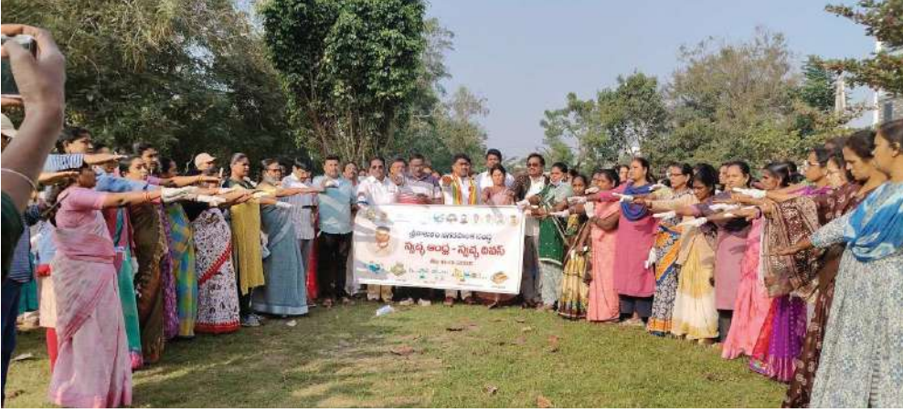
శ్రీకాకుళం, జనవరి 18, మేజర్ స్టూన్స్:

- సంప్రదాయ గురుకులంలో స్వచ్ఛ స్వచ్ఛ ఆంధ్ర స్వచ్ఛ దివస్