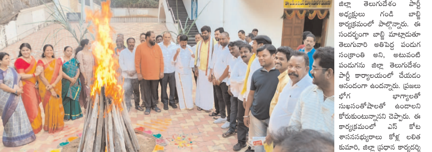
విశాఖపట్నం, జనవరి 12, మేజర్ న్యూస్

తెలుగుదేశం పార్టీ కార్యాలయంలో ఆదివారం సంక్రాంతి సంబరాలు జరిగాయి. భోగిమంటలతో ప్రారంభించి బూరెలు విరాయిలు పంపిణీ చేశారు. తెలుగువారి సాంప్రదాయ దుస్తులతో రాష్ట్ర కోఆపరేటివ్ ఆయిల్ సిస్ట్రి గ్రోవర్స్ ఫెడరేషన్ చైర్మన్