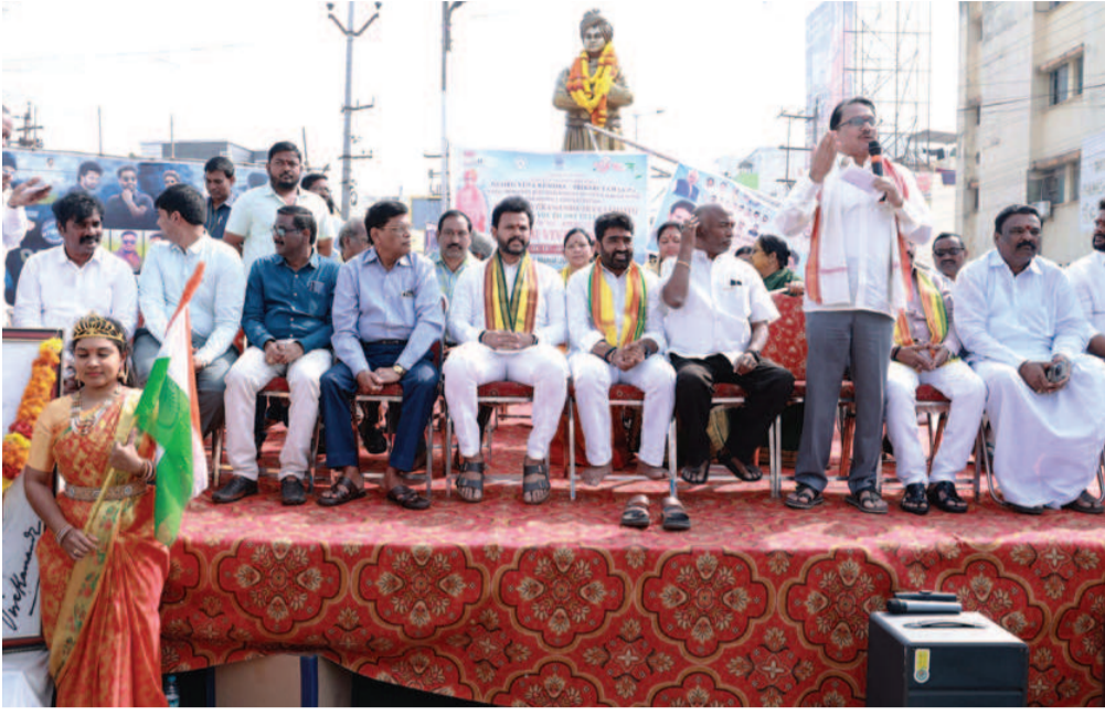
శ్రీకాకుళం, జనవరి 12, మేజర్ న్యూస్

కేంద్ర పౌర విమానయాన శాఖ మంత్రి కింజరాపు రామ్మోహన్ నాయుడు - నెహ్రూ యువ కేంద్రం, జైసిం అధ్యక్షులలో ఘనంగా స్వామి వివేకానంద జయంతి వేడుకలు