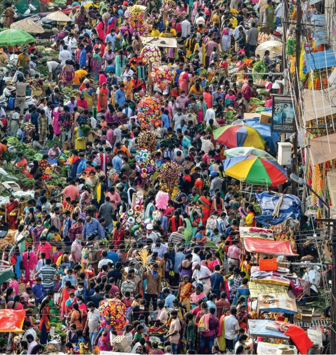
ఆదివారం పండుగ బజార్...!

ఎప్పుడెప్పుడా అని ఎదురు చూస్తున్న సంక్రాంతి పండుగ రానే వచ్చింది. దీంతో సోమవారం భోగి పండుగ కోసం ఊరంతా ముస్తాబు అయింది. ఎక్కడ చూసినా భోగి పండుగ వేళ మంటలు వేసేందుకు రాత్రి నుంచే ఏర్పాట్లు చేస్తున్నారు. పాత పప్పులను ఈ మంటల్లో వేయడం సాంప్రదాయమే అయినా ఈ మంటల కోసం కట్టెలు తెచ్చేందుకు యువత ఉమ్మడిగా తున్నారు. పాత సామాన్లను పెద్ద ఎత్తున పోగొయడం ఒక ఎత్తయితే మరో పక్క కట్టెలు, పాత చెక్కలను మంటల్లో వేసేందుకు ఆయా వీధి కమిటీలు సమాయత్తమవుతున్నాయి. ఈ మంటల్లోనే వేడి నీళ్లు కాసుకునేందుకు సైతం సిద్ధపడు తున్నారు. అయితే శనివారం సుబ్బీ ప్రభుత్వ కార్యాలయాలకు, స్కూళ్లకు సెలవులు ఇచ్చేయడంతో నగర వాసులు నగరానికి నగం పైగా గ్రామీణ ప్రాంతాలకు తరలిపోయారు. మిగిలిన వారు నగరంలో సందడి చేస్తూ సంక్రాంతి హడావిడి చేస్తున్నారు. రైళ్లు, బస్సులు, సొంత వాహనాలు పూర్తిగా ప్రయాణీకులతో కిక్కిరిసి ప్రయాణిస్తున్నాయి. బస్సుల్లో నీళ్లు దొరక్క అనేక మంది బైకుల్లోనే ప్రయాణాలు సాగిస్తున్నారంటే పరిస్థితి ఊహించుకోవచ్చు.