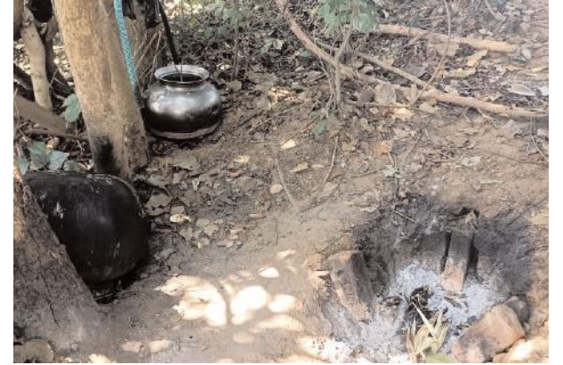
చాప కింద నీరులా విస్తరిస్తున్న గుడుంబా వ్యాపారం

మంగపేట, జనవరి 12, సూర్య(మేజర్ న్యూస్):ములుగు జిల్లా మంగపేట మండలంలో మధ్యం ఏర్పాటు పాఠశాలలు. ఒక వైపు బెల్లు దండా మరో వైపు గుడుంబా దండా జోరుగా సాగుతోంది. మండలంలో ఎక్కడ చూసిన బెల్లు దుకాణాలు దర్శనమిస్తున్నాయి. దీనికి తోడు కొంత మంది గుర్తు తెలియని వ్యక్తులు ధనాధిని ద్యేయంగా నిర్మానుష్యంగా ఉన్న ప్రాంతాల్లో రాత్రి, పగలు తేడా లేకుండా గుడుంబా కాస్తున్నారని పలువురు ఆరోపిస్తున్నారు. అంతేకాకుండా అనువుగా ఉన్న ప్రదేశాలు అయిన వాగులను ఎంచుకుని రాత్రి వేలల్లో కాస్తున్నారని ఆరోపణలు ఉన్నాయి. పవర్ సప్లై సైతం ఏర్పాటు చేసుకుని గుడుంబా తయారు చేస్తుండడంతో పలువురు విస్తుపోతున్నారు. ముఖ్యంగా రామచంద్రునిపేట, తిమ్మాపురం, మల్లూరు, రాజుపేట తదితర గ్రామాల్లో గుడుంబా విక్రయాలు జోరుగా సాగుతున్నాయి. పక్క జిల్లా నుంచి సైతం గుర్తు తెలియని వ్యక్తులు ద్వితీయ వాహనాలపై క్యాన్ లలో గుడుంబా తీసుకుని వచ్చి చిన్న చిన్న కిరాణి షాపులలో పాటు బెల్లు షాపులకు సప్లై చేస్తుండడంతో గ్రామాల్లో ఎక్కడ చూసినా గుడుంబా విక్రయాలు కనిపిస్తున్నాయి. మండలంలో బెల్లు దండా, గుడుంబా దండా యధేచ్ఛగా జరుగుతున్న పట్టించుకోల్పిన ఎక్సైజ్ శాఖ అధికారులు నిద్రావస్థలో ఉన్నారని ప్రజలు ఆగ్రహం వ్యక్తం చేస్తున్నారు. ఇంత తతంగం జరుగుతున్న చూసి చూడనట్లు వ్యవహరించడంపై పలు అనుమానాలు వ్యక్తమవుతున్నాయి. ఇప్పటికైనా ఎక్సైజ్ శాఖ అధికారులు స్పందించి గుడుంబా విక్రయాలు జరగకుండా చర్యలు తీసుకోవాలని మండల ప్రజలు కోరుతున్నారు.