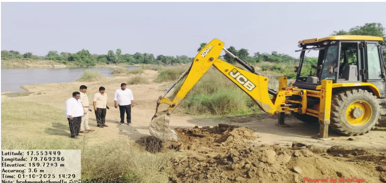
Latitude: 17.553449 Longitude: 79.769286 Elevation: 189.72±3 m Accuracy: 3.6 m Time: 01-10-2025 14:29 Note: brahmanakothapalli మామిడితోట వద్ద