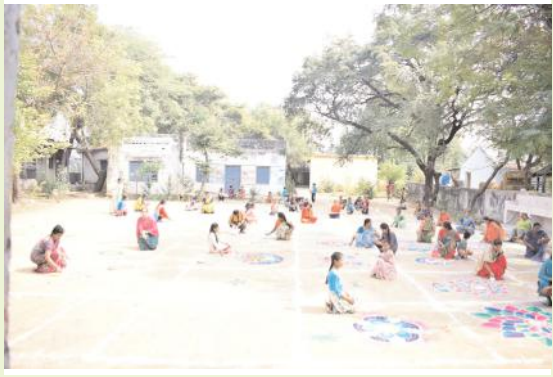
మచ్చాపూర్ లో ఘనంగా ముగ్గుల పోటీలు